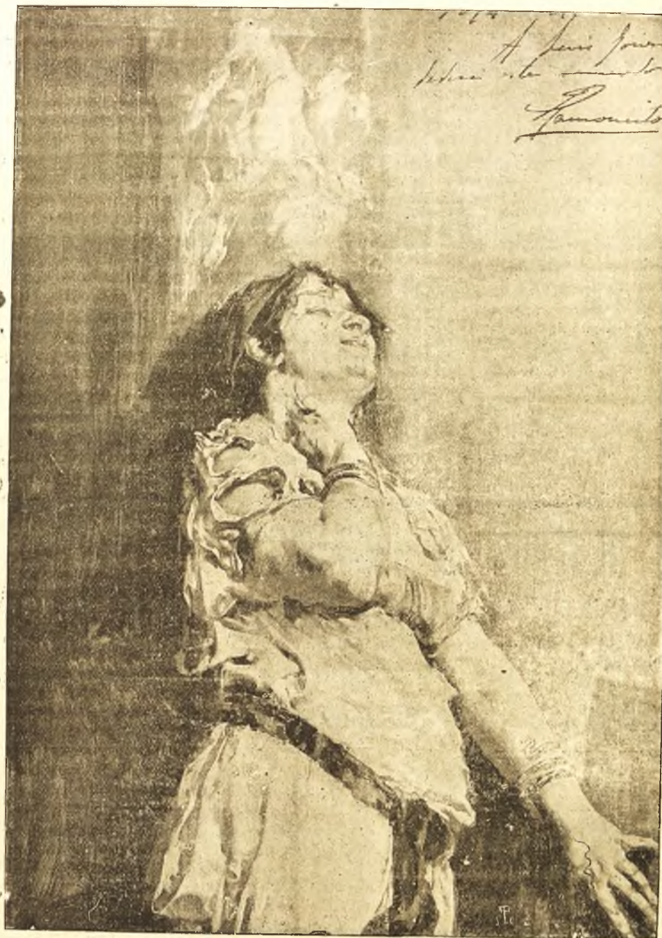
OTRA ELSA POMPEYANA

¿Por qué lloras, madre? ¿Por qué es tu tristeza? ¿Por qué amargo llanto tus ojos anega? ¿Acaso presientes que mi fin se acerca? Si es por eso, madre, ¡no llores, no temas! Porque en esta vida, valle de pesares, ¡la dicha es perderla!