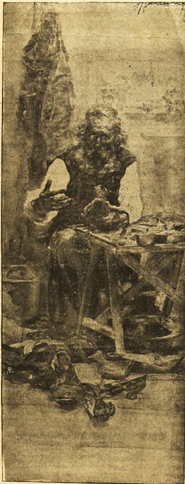
Recordando ciertas frases del mitin.