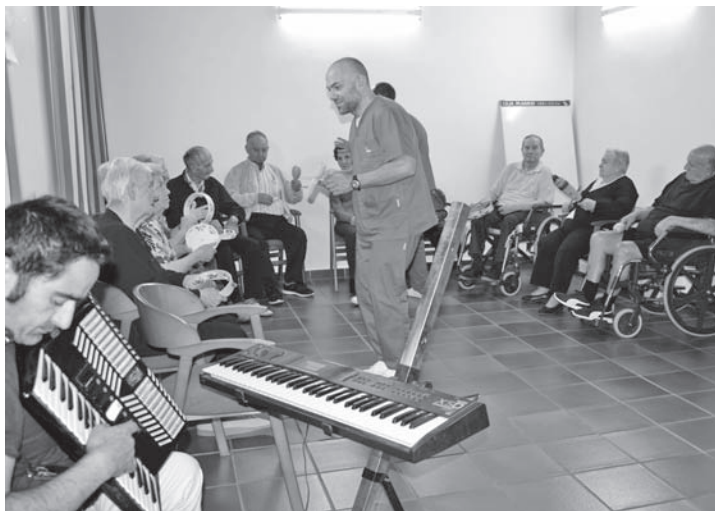
Nuestros mayores pudieron disfrutar de una sesión de musicoterapia