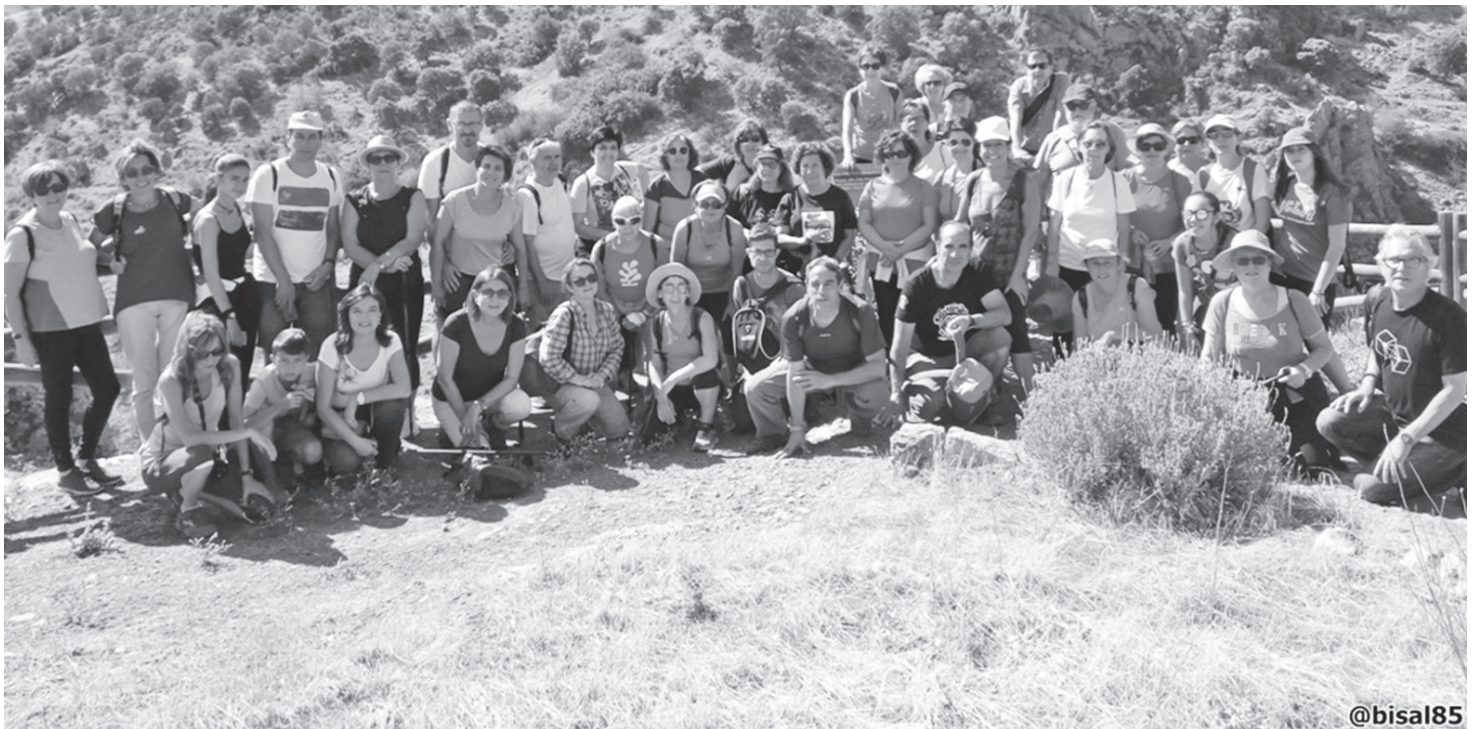
Participantes en la Ruta de Senderismo

El pasado 24 de septiembre, se superaba la cifra de 40 participantes en la Ruta de Senderismo organizada por la Universidad Popular local.