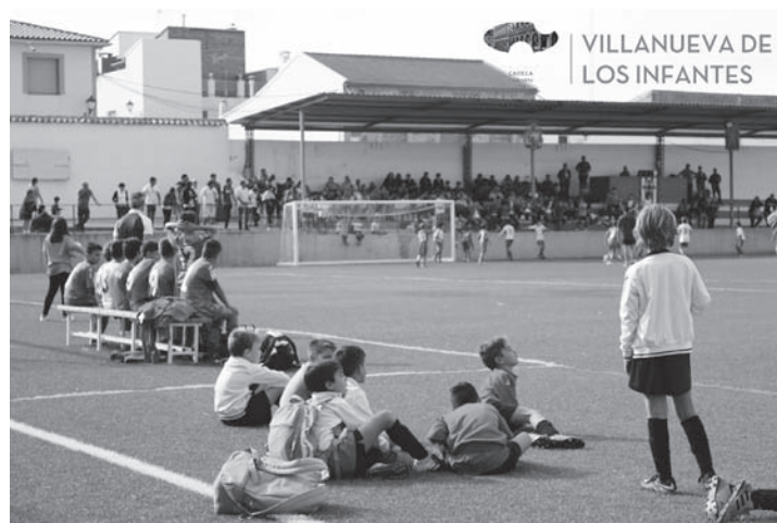
Aspecto de las gradas del Campo de Fútbol durante el Torneo