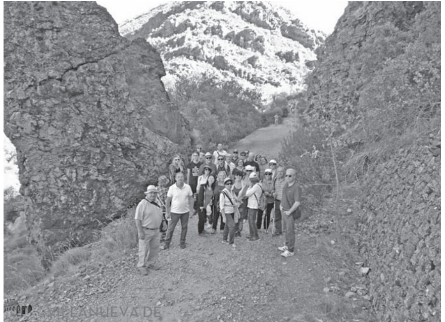
Foto de "familia" del viaje para conocer los Parques Nacionales de la provincia

La iniciativa, que ha sido valorada muy positivamente por los participantes, les ha llevado a pernoctar en el Palacio de los Condes de Valdeparaíso, en Almagro, y les ha permitido también disfrutar del encanto y de la rica gastronomía manchega.