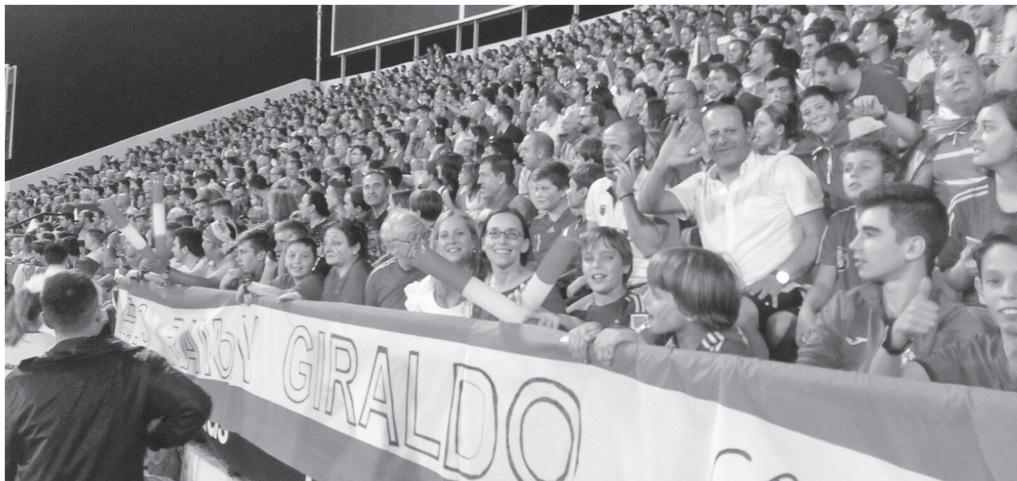
Miembros del AMPA del IES Ramón Giraldo en las gradas del estadio Rico Pérez de Alicante

Setenta personas viajaron ayer hasta Alicante para acompañar a la Selección de Fútbol y disfrutar de su victoria 3-0 frente a Albania en el estadio Rico Pérez. Una intensa y divertida jornada que daba comienzo a las 15 horas y que se prolongó hasta las 3.30 de la madrugada y donde reinó el buen ambiente tanto en los prolegómenos como durante el partido.