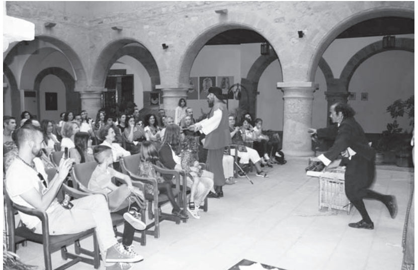
Una de las actuaciones en la Alhóndiga