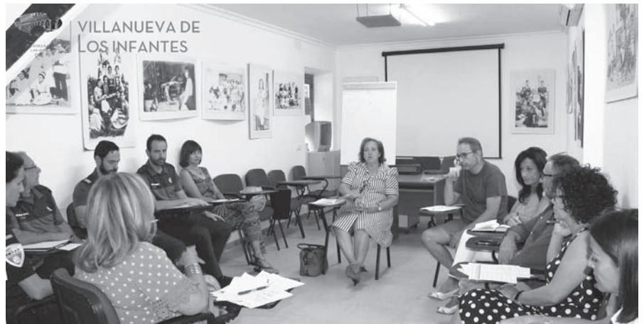
Un momento de la reunión

El Protocolo Local sobre Violencia es el documento según el cual se regulan las actuaciones sobre violencia de género llevadas a cabo por los distintos profesionales implicados. Fue aprobado en el año 2006 y coordina las intervenciones de las Fuerzas y Cuerpos de Seguridad, del personal sanitario, social, educativo, judicial y de las técnicas del Centro de la Mujer, frente a un caso de violencia de género.