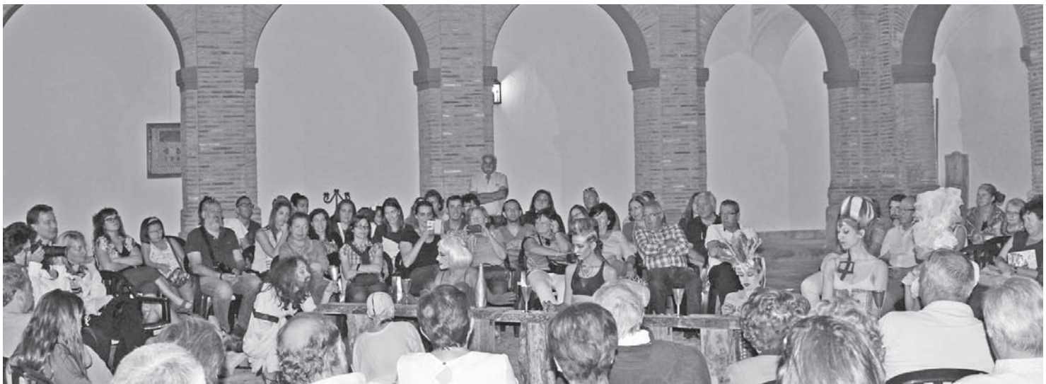
Los Claustros de Santo Domingo acogieron la obra "Ticus" de Shakespeare