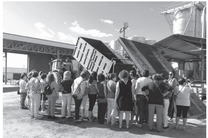
Visita a la Cooperativa Ntra. Sra. de la Antigua

Las personas interesadas pueden realizar sus inscripciones para las diversas actuaciones contactando con cualquier miembro de la Junta Directiva.