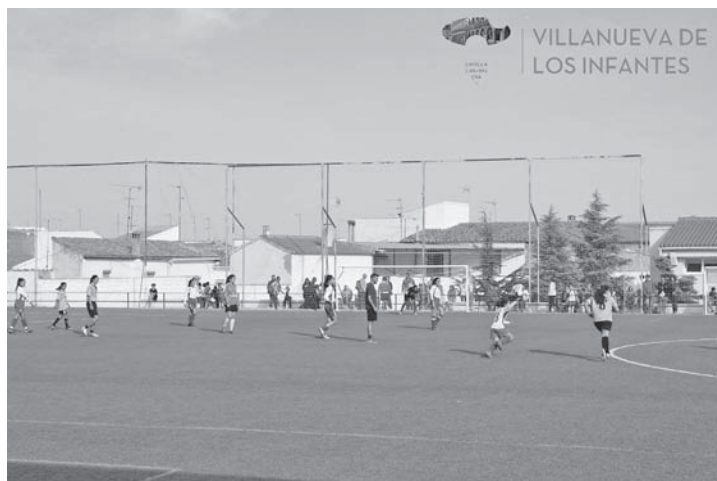
Unos de los partidos del equipo Infantes Femenino en el Torneo

El pasado 23 de Septiembre tuvo lugar un año más el Torneo de 8 Fútbol Base 'Ciudad de Villanueva de los Infantes' en el que participaron más de 500 jóvenes futbolistas en el torneo que se celebró en el Campo de Fútbol "San Miguel". En él participaron 36 equipos divididos en tres categorías con una gran afluencia de público, como cada año, y muy buen tiempo para la práctica del fútbol.