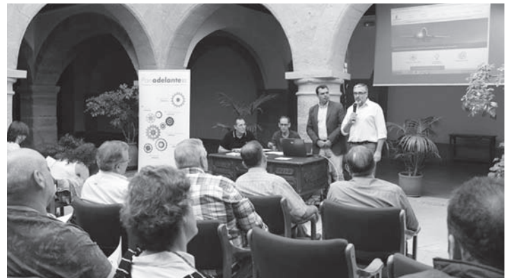
Un momento de la conferencia en la Alhóndiga