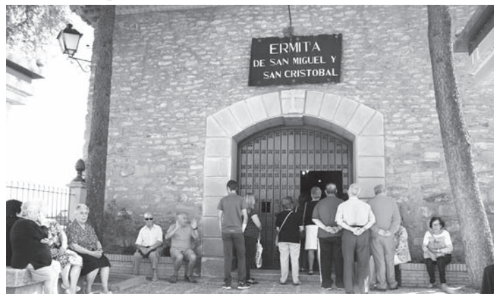
Ermita de San Miguel el día de su festividad

Un año más, infanteños y visitantes pudieron seguir la tradicional subasta de los más diversos productos de la tierra, artesanales etc. donados por los infanteños.