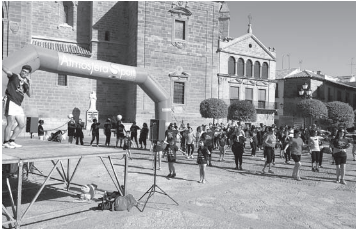
Master Class de Zumba a cargo de Savia Nueva

Tras la carrera tenía lugar en la Plaza Mayor una Master Class de Zumba a cargo de Savia Nueva, donde mujeres y algún que otro hombre se animaron a hacer ejercicio al ritmo de la música. Posteriormente, todas las personas inscritas pudieron disfrutar de un desayuno saludable con la colaboración de las asociaciones de mujeres de la localidad, consistente en pan tostado con aceite de oliva, donado por la Cooperativa Ntra. Sra. de la Antigua y Santo Tomás de Villanueva, acompañado de leche, café o cacao. Una jornada festiva donde se reivindicaba la igualdad entre mujeres y hombres y se tomaba conciencia de los hábitos de vida saludables.