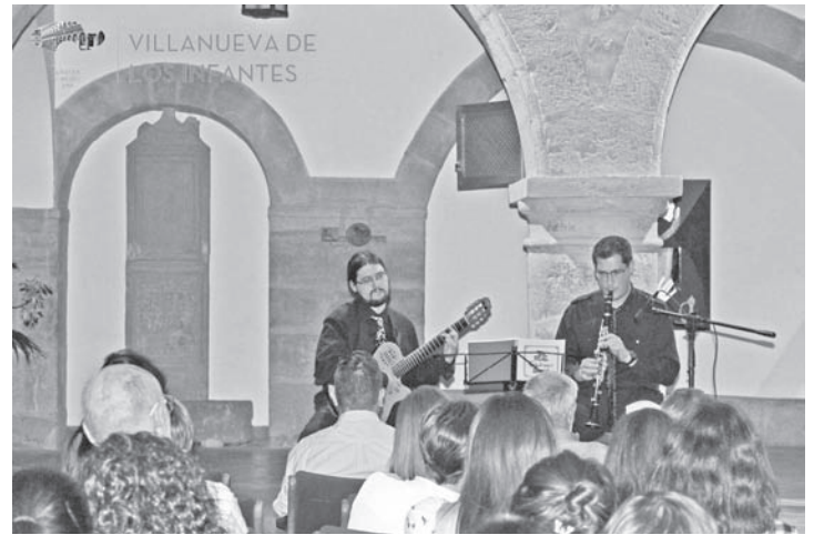
Concierto de Música en la Alhóndiga