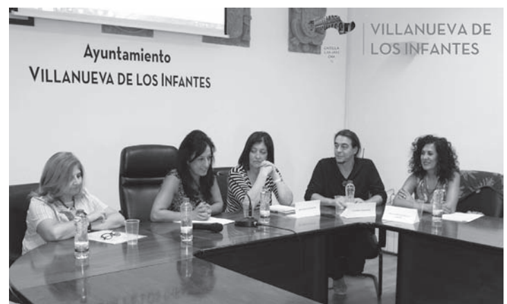
Jornada de Empoderamiento celebrada en el Salón de Plenos del Ayuntamiento

Por último, la Decana de la Facultad de Ciencias Sociales de la UCLM en Talavera de la Reina, ha impartido un Taller sobre Feminismos y Empoderamiento, cuyo objetivo para por concienciar a las mujeres de la existencia de unos intereses e inquietudes comunes entre ellas; descubrir capacidades, potencialidades y recursos que les permitan participar tanto en los ámbitos de espacios públicos como de espacios privados. "Los hombres y mujeres tenemos que trabajar en conjunto... El feminismo implica sólo la lucha por los derechos para mujeres y hombres en igualdad de condiciones. No se pretende usurpar el poder. El poder es compartido donde hombres y mujeres sumemos por vivir más plenamente nuestra vida", ha subrayado.