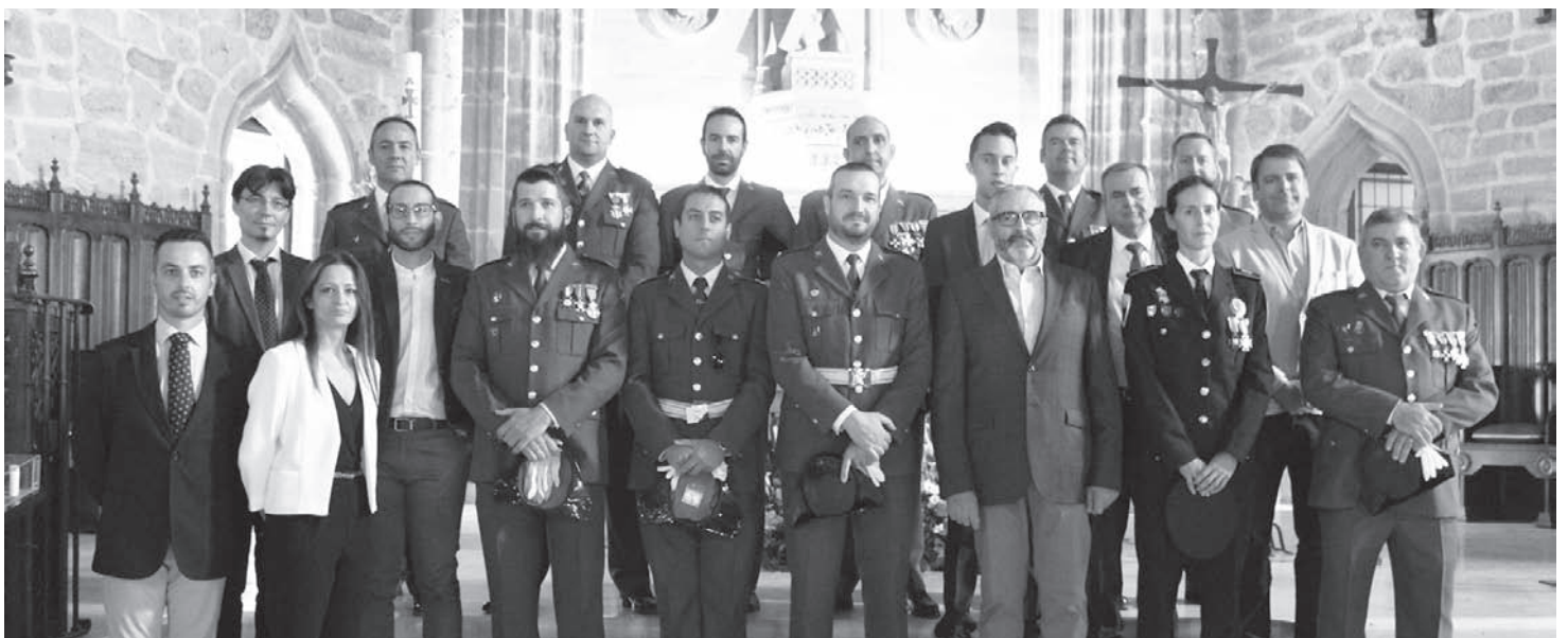
Miembros de la Guardia Civil, Policía Local y Corporación Municipal en la Iglesia de San Andrés Apóstol

La mañana del 12 de octubre, la Guardia Civil de Villanueva de los Infantes ha celebrado el día de su patrona, la Virgen del Pilar. Una jornada que comenzaba con la celebración de la Santa Misa en la Iglesia Parroquial de San Andrés Apóstol, acompañados por autoridades, amigos y familiares