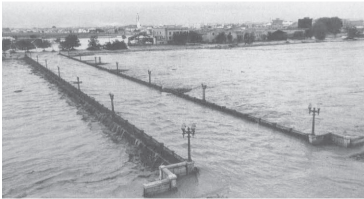
Riada en Valencia, año 1406

toda la cuenca del Segura, desbordándose los ríos Pliego, Mula y Segura y las ramblas costeras, centenares de personas tuvieron que ser evacuadas. La sucesión de varios años de lluvia en este mes extraordinariamente lluvioso a mediados del siglo XIX, provocó en Irlanda la Gran Hambruna, debido a que al inundarse los campos se pudrieron las patatas, que por a que entonces eran el sustento básico de la población.