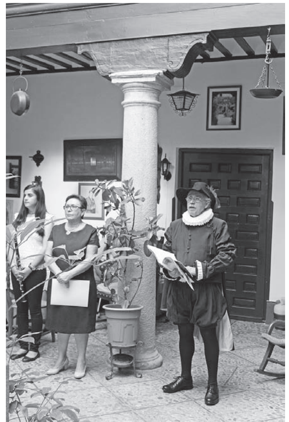
Lecturas y música en la Casa del Caballero Verde Gabán