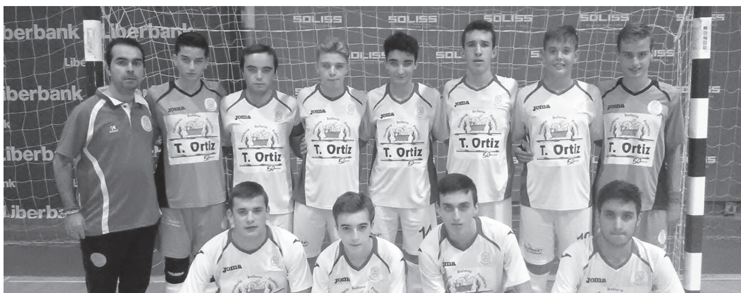
Equipo Juvenil del Panadería Ortiz Infantes F.S. en la presente temporada