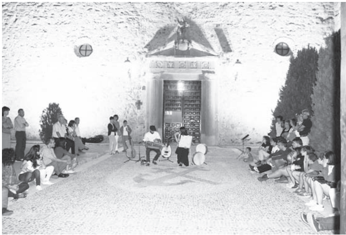
Recital de música en el atrio de la Iglesia del Corpus Christi

Fue Noticia Fue Noticia Fue Noticia Fue Noticia Fue Noticia Fue Noticia Fue Noticia Fue Noticia Fue Noticia Fue Noticia Fue Noticia Fue Noticia