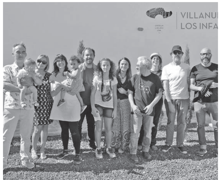
Artistas participantes en la exposición

Fundaciones, que asume como argumento clave de su compromiso la atención a la holografía, a la creación contemporánea y a la transferencia del conocimiento en favor de la ciudadanía.