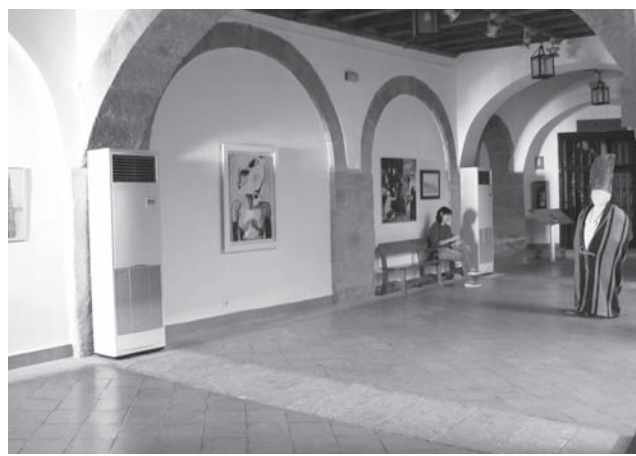
Obras situadas en la Exposición