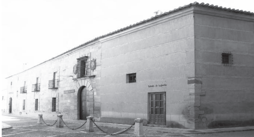
Sede de la Universidad Popular

Aunque las fechas de algunas actividades están por determinar, las inscripciones están abiertas en la sede de la Universidad Popular, en la calle Ramón y Cajal, 12 de Villanueva de los Infantes.