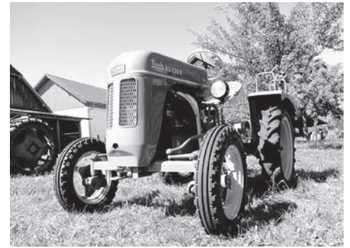
Tractor de la marca Bautz

Para la firma alemana Bautz, la producción de tractores pequeños fue sólo un paréntesis: había adquirido los derechos del Zanker M1 y los utilizó para construir el Bautz AW/AS 120, el cual incorporaba un moderno motor diésel inyección directa. Bautz sólo producía tractores de tamaño y potencia reducidos. Pero cuando este mercado se saturó a principios de la década de 1960, la firma empezó a fabricar tractores agrícolas. El primer modelo