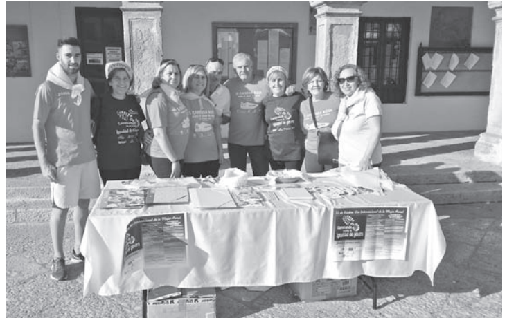
Mesa de recogida de donativos a favor de AMUMA