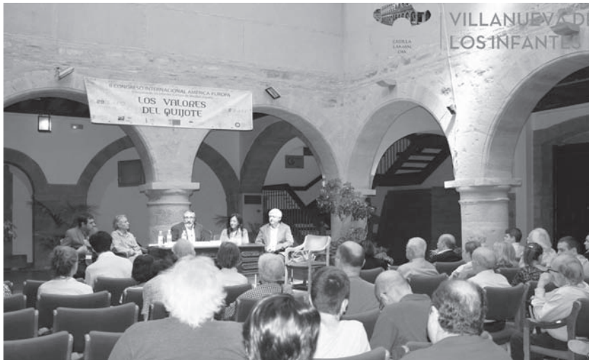
Imagen del II Congreso Internacional América-Europa Una de las muchas actividades Culturales que se celebran en nuestra localidad

Y antes de todo, volver a explicar y consensuar el plan con las fuerzas vivas de Infantes (ya existe un apoyo por escrito de 150 infanteños notables así como de sus últimos cinco exalcaldes) como pretende la Mesa de desarrollo creada al efecto y donde parece que está previsto aplicar algún índice de este tipo. Ojalá sea vean pronto sus frutos, ya que Infantes lo tiene todo en este año de 2017 para su despegue como una potencia turístico-cultural de primer orden, principalmente por su calidad. Sólo hay que recordar y con fuerza los dos requisitos a cumplir: ser conscientes de nuestro potencial y saber faltar silenciosamente y sin daño para nadie los despreciables intereses políticos en juego. Lo hecho hasta ahora en solo cinco años demuestra que es perfectamente posible. Y si esto no es oro, queridos paisanos, se le parece mucho.