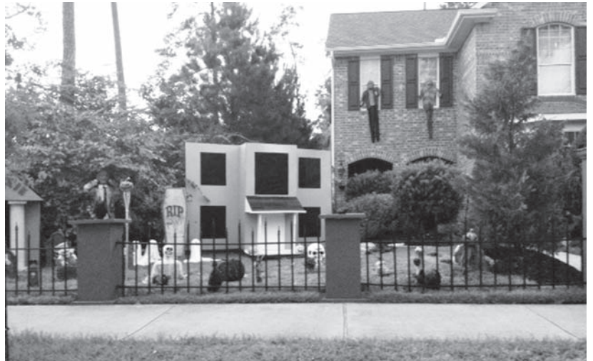
Casa decorada para la festividad de Halloween