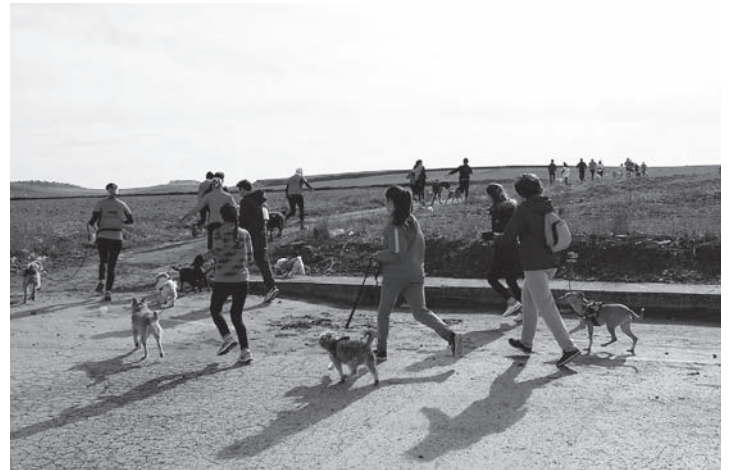
Un momento de la carrera

La competición constaba de dos pruebas. La primera, incluida en la liga provincial de la Diputación de Ciudad Real, consistió en un recorrido de 6 kilómetros hacia el Paraje de la Fuente del Lirio. La segunda, de carácter popular, en un recorrido de 2 kilómetros alrededor del Paraje de San Miguel.