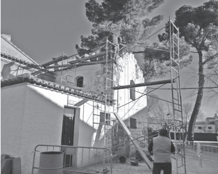
Obra realizada en el Paseo de la Constitución

Dentro del Plan Extraordinario de Obras Municipales por Empleo, CLM del año 2016 de la Diputación Provincial en su segunda fase...el primer proyecto llevado a cabo ha sido la consolidación del muro de mampostería de la Plaza de San José y en la reparación de acerado del entorno; además de los trabajos en el Parque de la Constitución con el arreglo de la cubierta y los muros de los aseos.