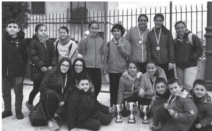
Integrantes del equipo de Orientación

En Marzo también se disputarán los torneos por edades de la federación, y este año irá el club con más participación que nunca, pues habrá chicos en sub-8; sub-10; sub-12; sub-14 y sub-16.