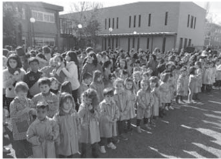
Alumnos de educación primaria y secundaria participaron en el Día de la Paz

Por su parte, la Escuela Trilema Sagrado Corazón ha trabajado en grupos verticales con los ingredientes para la paz. Esta mañana han formado una paloma en el patio y ha tenido lugar una suelta de globos.