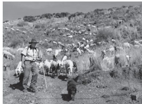
Rebaño de ganado por una vía pecuaria

La legislación vigente sobre vías pecuarias está contenida en el Reglamento de 23 de