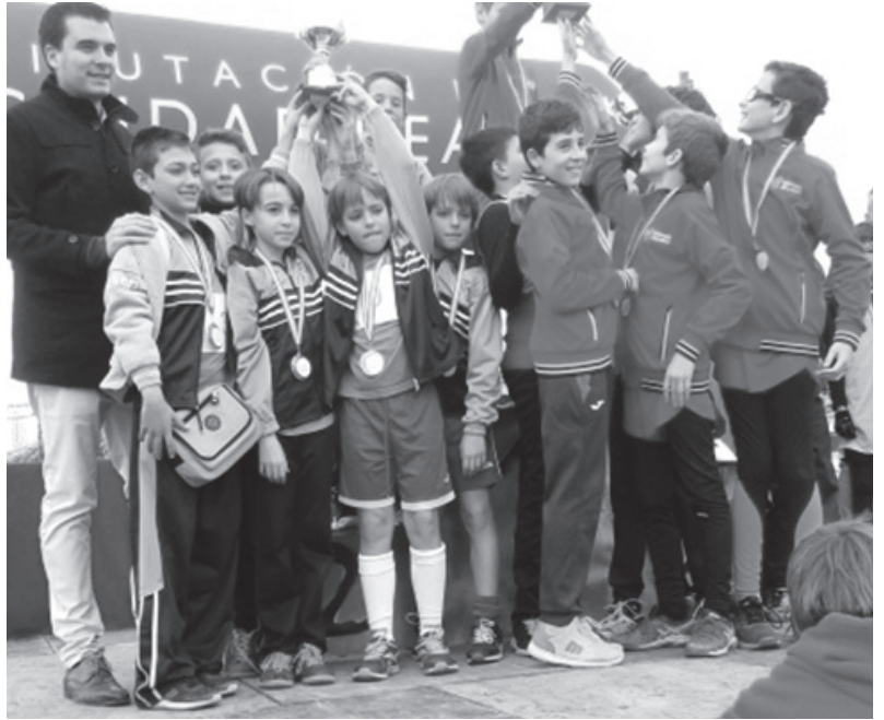
Alumnos del García Bellido recogiendo el trofeo