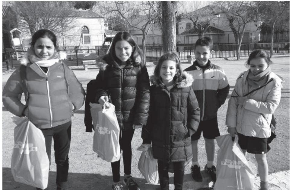
Colegio Trilema Sagrado Corazón

Con su participación, los alumnos del Colegio Trilema de Infantes evidencian su preocupación por la vida sana y los buenos hábitos, dos de los puntos centrales de uno de los proyectos en los que han trabajado este curso.