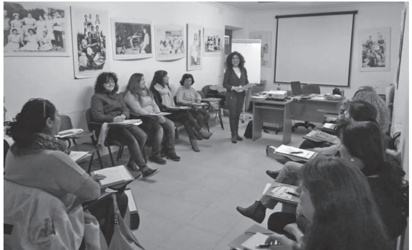
Alumnas presentes en el Curso de Creación y Gestión de Empresas

Esta iniciativa está organizada por el Centro de la Mujer local e impartido por Fademur CLM, en colaboración de la Universidad Popular.