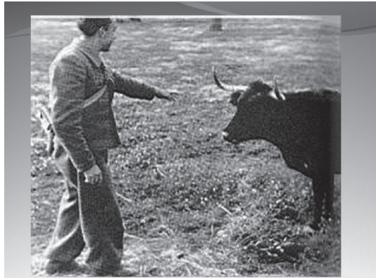
Como el toro he nacido para el luto. Tú eres fatal ante la muerte, yo soy fatal ante la vida.

Quince días pasó Miguel por tierras de Ciudad Real en marzo de 1936 dejando rastro epistolar de los sitios por los que an-