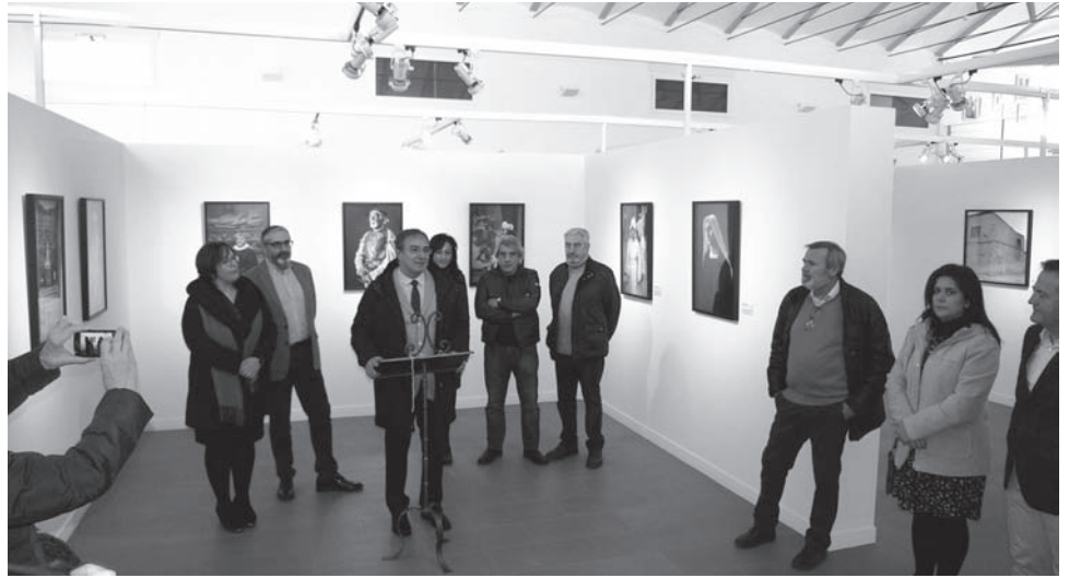
Acto de inauguración de la exposición "El Alma de Cervantes"