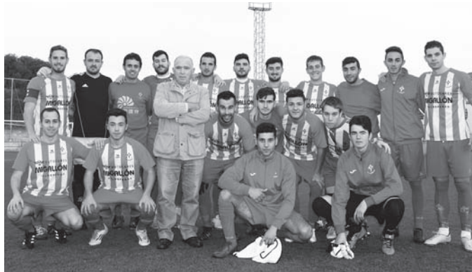
Plantilla 2016-17 del C.F. Infantes

en peligro la imbatibilidad infanteña en la tarde de domingo. Pero las tentativas de la "UD", como coreaban sus aficionados, quedaron frenadas en seco por la firme zaga rojiblanca. El partido concluyó con el 0-3 y tras la expulsión del capitán por doble amonestación, quien se marchó ovacionado del campo local. Tras esta victoria y el reparto de puntos entre Sporting Alcázar y Sport Windows Villarrubia, el C.F. Infantes afronta una nueva semana como líder a cuatro puntos de diferencia del segundo clasificado y a ocho del tercero.