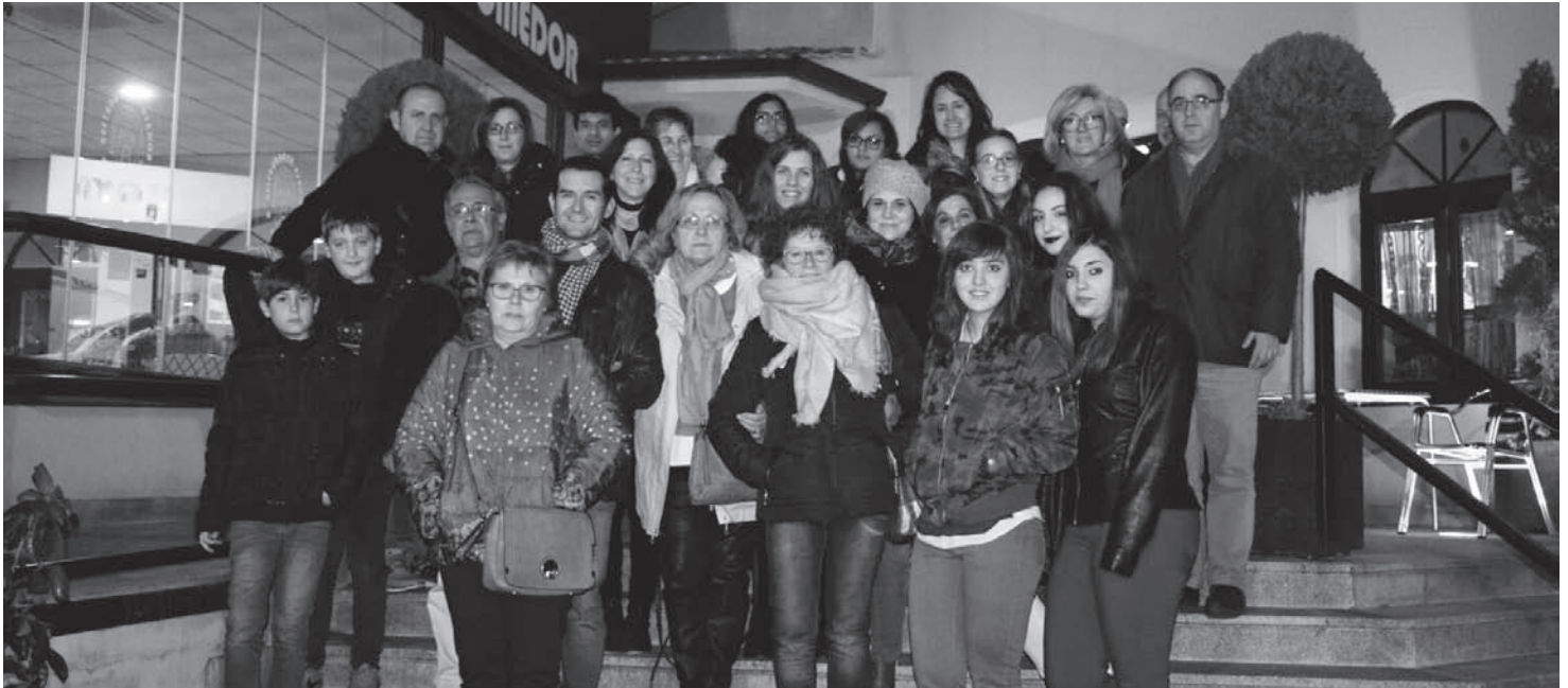
Miembros de "Arteaga Alfaro" de visita en la exposición sobre el Fauvismo

Además de las exposiciones temporales que la Asociación organiza en el espacio que gestiona dentro del Museo de Arte Contemporáneo El Mercado, la siguiente actividad prevista es el Día de Pintura al Aire Libre, que como viene siendo habitual, tendrá lugar en primavera en el Santuario de la Virgen de la Antigua.