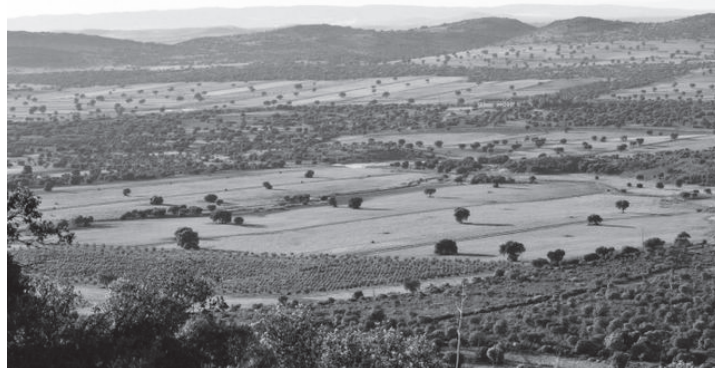
Paisaje del Campo de Montiel

de la zona, en crecimiento en la actualidad, dejaría de ser atractivo, con el correspondiente impacto negativo para la hostelería. Todo ello no haría sino aumentar la despoblación de la zona con el correlativo impacto negativo para el comercio, que a su vez despoblaría aún más la comarca, lo que llevaría aparejada una disminución de los servicios públicos, en particular los sanitarios, con especial influencia para los más necesitados de ellos, las personas de la tercera edad, tan abundantes en nuestro pueblo y comarca; y los educativos, con menos oferta académica para nuestros jóvenes; lo que a su vez incidiría en una mayor despoblación, con la consiguiente rebaja de los precios de los inmuebles urbanos.