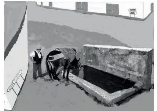
Composición aproximada del Pilancón