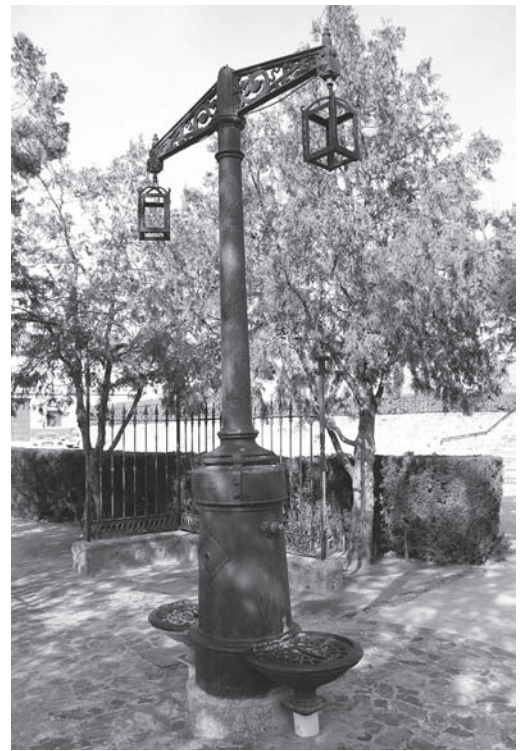
Antigua fuente de la Glorieta, hoy próxima al Cuartel

estaba cerca de nuestro "campo de fútbol"- la era del "trago de vino"- a la que íbamos en "bici", unos conduciendo sentados en el sillín, otros en la barra o en el transportín, dando saltos entre baches y piedras, con caídas y "culadas", que es una forma de expresar que, debido al mal estado del terreno, a veces, conductor y "bulto" dábamos con nuestros huesos en tierra.