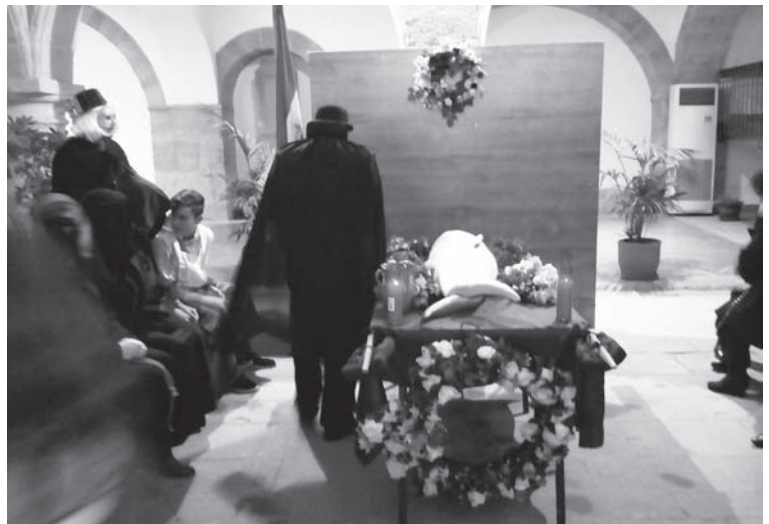
Entierro de la Sardina, con el que concluyó el Carnaval