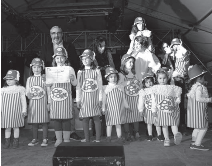
1º Premio Infantil, Grupo Palomitas

La Concejalía de Festejos y Juventud quiere agradecer la participación de las numerosas peñas carnavalescas, así como la labor desempeñada por Policía Local y Protección Civil, que hizo posible que el desfile transcurriera sin incidentes.