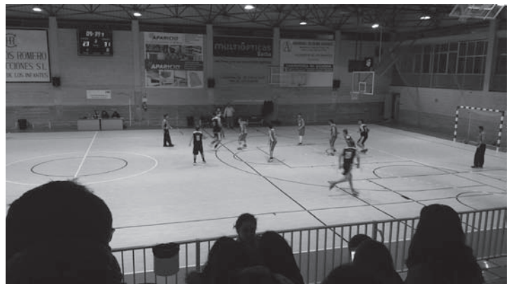
C.B Infantes en la presente temporada

En cuanto a los distintos equipos federados de Fútbol - Sala y Baloncesto, el equipo Panadería Ortiz Infantes F.S. de 2ª Nacional B nos ha brindado con todo tipo de resultados, victoria, empate y derrota, así como la suspensión del partido que le debía enfrentar con Lucena por incomparecencia del rival. Estos han sido los tanteadores del último mes.