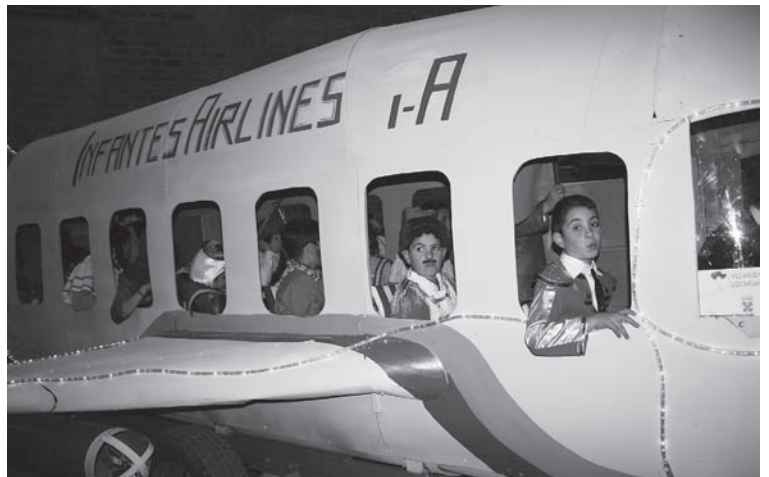
Infantes Airport (3º Clasificado en la modalidad de Carrozas)