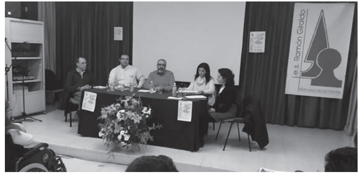
Mesa de la I Jornada de Formación

Para complementar las ponencias se presentaron los planes de negocio de varios Proyectos Empresariales; “Tokorroko”, “Dul-