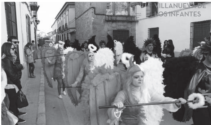
Ángeles y Demonios (4º Clasificado en la modalidad de Carrozas)