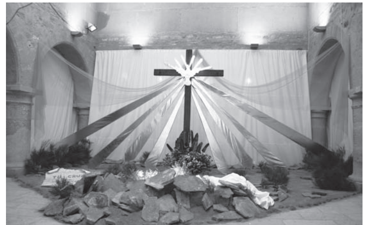
Imagen de la "Cruz del Pueblo" situada en la Alhóndiga

El plazo de presentación finalizará el 24 de Marzo del 2017. Con todas las fotografías recibidas se hará una selección de 30 fotografías con las que se montará una exposición en el Patio de la Casa de Cultura-Alhóndiga, del 15 de mayo al 2 de junio de 2017. Éstas quedarán en propiedad, a todos los efectos, del Ayuntamiento, reservándose éste el derecho de exponerlas públicamente y el de publicitarlas en los soportes y medios que estime oportuno.