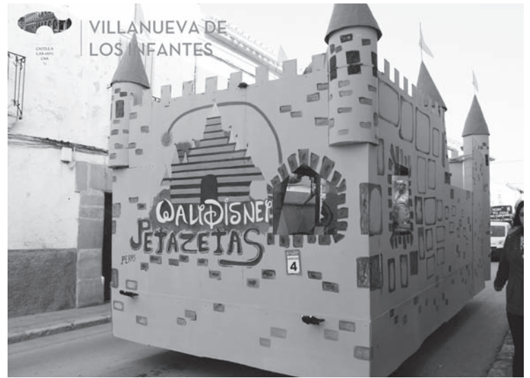
Los Peta Zetas (5º Clasificado modalidad de carrozas)