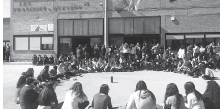
Aspecto del patio durante uno de los actos