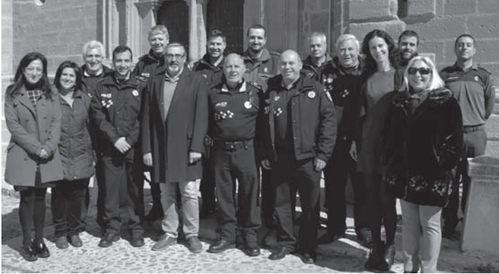
Foto de familia y autoridades con motivo de la celebración

La fiesta del Santo Ángel de la Guarda, patrón de la Policía Local, ha comenzado esta mañana en Villanueva de los Infantes con una Misa en la Iglesia Parroquial de San Andrés. La celebración ha continuado con un pequeño aperitivo que el cuerpo de Policía Local ha ofrecido para las autoridades, familiares y allegados en el Patio de la Alhóndiga.