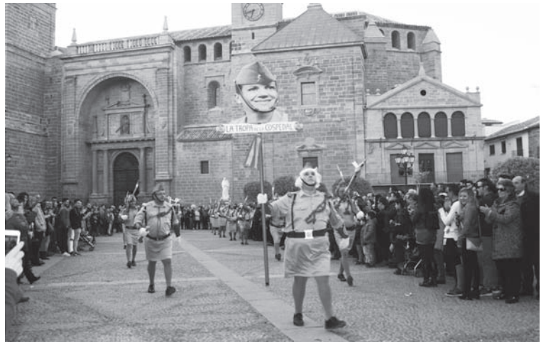
Los Tunos (3º Clasificado en grupo de Máscaras)