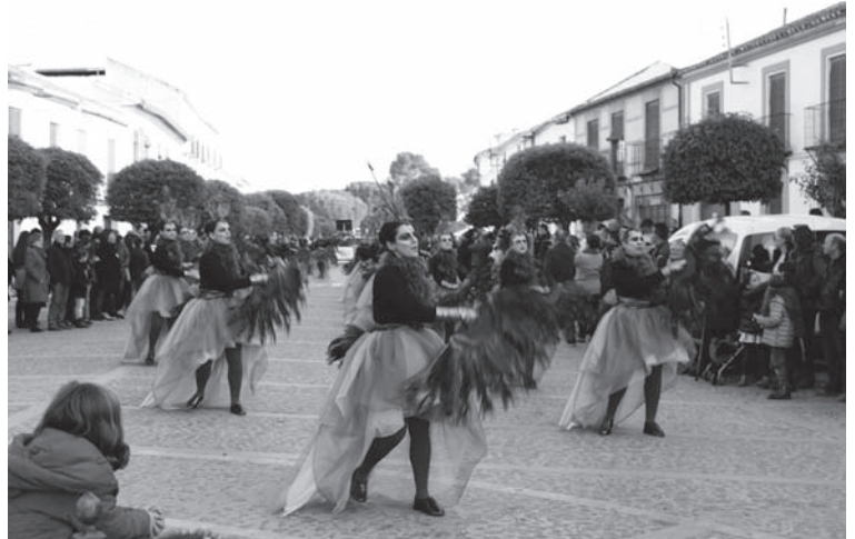
Los Danzantes (1º Clasificado en grupo de Máscaras)

El Miércoles de Ceniza, daba por concluidas las fiestas en honor a don Carnal con el entierro de la sardina, tras el desfile por la calle Cervantes y Plaza Mayor, acompañada de un desconsolado duelo vino a morir (nunca mejor dicho), en