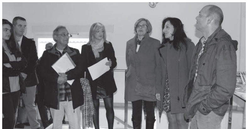
Un momento del acto de la Asociación Arteaga Alfaro

La exposición se podrá contemplar hasta el 23 de abril.