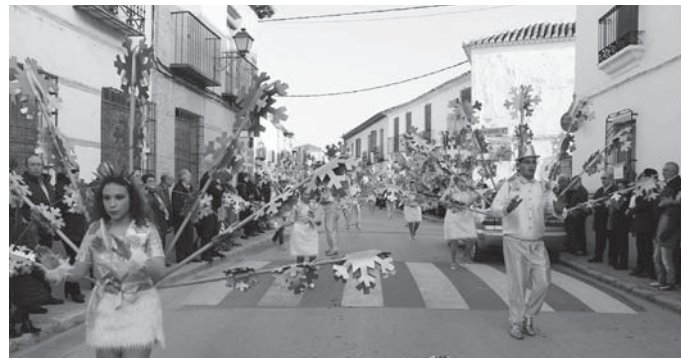
El Reino del Hielo (2º Clasificado en grupo de Máscaras)