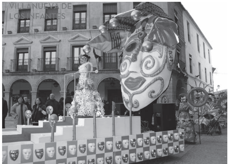
Asociación Cartón y Siliconas (1º Clasificado modalidad de Carrozas)