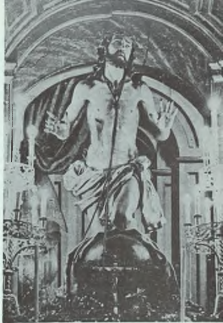
El Cristo del Perdón, de Salvador Carmona

A ésta dio gran impulso Alfonso VIII, el vencedor de los almohades en Las Navas. Estaba muy encariñado con Atienza desde que, siendo niño, fue confiada la seguridad de su persona al leal vecindario, y sitiada por Fernando II de León, que quería apoderarse del regio sobrinillo y su tutoría, resistió el cerco hasta que la escasez de provisiones hicieron inminente la rendición; entonces los arrieros y mercaderes ambulantes de Atienza, ya organizados en una especie de gremio, consiguieron liberarle mediante valerosa y hábil estratagema, conduciéndole hasta Segovia, tras caminar por senderos de cabras sin detenerse en ningún poblado, durante siete días. Para premiar ese gran servicio y otros muchos prestados por las milicias y arrieros de Atienza, tanto en la reconquista de Cuenca como en la luctuosa batalla de Alarcos y después, Alfonso VIII otorgó a la villa