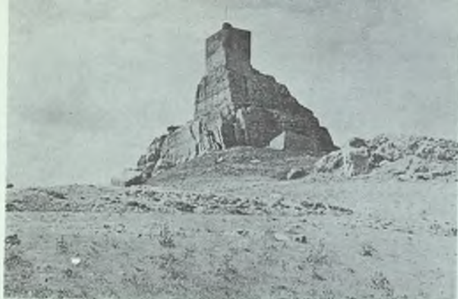
El castillo roquero, visto desde el sur

La antiquísima y tiempos atrás importante villa de Atienza está al norte de la provincia de Guadalajara, en una de las estribaciones de la cordillera que separa ambas Castillas, a 1.100 metros sobre el nivel del mar, con clima más bien seco, benigna y agradable la temperatura en verano, pero de largos y crudos inviernos; así es la gente, dura para el trabajo, sobria para todo, resistente y también honrada, leal y acogedora; por su bravío emplazamiento y situación estratégica, llave de los puertos serranos, desde tiempos remotos constituyó Atienza una fortaleza inexpugnable en los siglos del arma blanca. El caserío se agarra a las agrias laderas de empinado cerro al que corona largo y elevado peñón cortado a pico, con una plataforma sólo accesible por el norte, desde la que se contempla un panorama vastísimo, pues hacia el sur se columbran más allá del altiplano alcarreño los cerros gemelos de Viana asomados al Tajo a setenta o más kilómetros en línea recta.