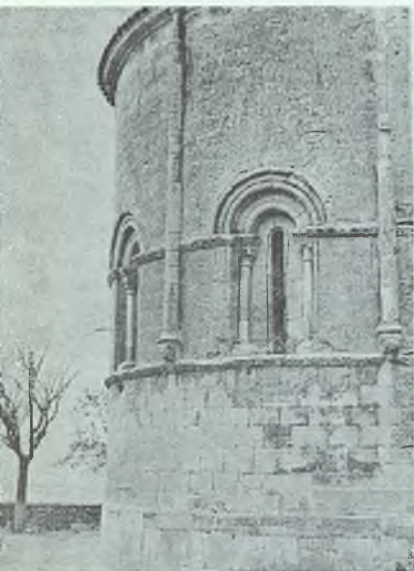
El ábside románico de la iglesia de La Trinidad

Cuanto antecede confiere a Atienza hartos méritos para aspirar a la protección del Estado y ser declarada por éste Conjunto Monumental Histórico-Artístico. A renglón seguido demostraré que con sobrada justificación ha obtenido esta categoría monumental, toda vez que en ella están digna y profusamente representados todos los estilos, desde el románico al barroco; procediendo con método, debiera ha-