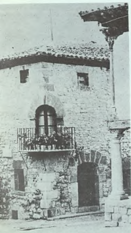
Un rincón de la Plaza del Trigo

siglo XV por don Alvaro de Luna y el alcaide navarro, sirviéndoles de barrera un tajado peñón. Dando marcha atrás, descendemos al vallejo para ver la curiosísima portada románica de Nuestra Señora del Val, surmontada por un ingenuo relieve que representa la Huída a Egipto; esa iglesia, nominalmente abierta al culto todavía, es lo único que resta del viejo arrabal cuya parroquia fue. Algo más acá,