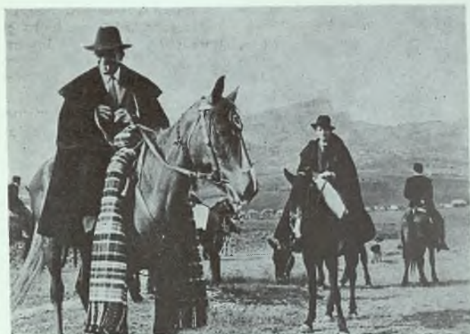
Los cofrades de "La Caballada", con su típico atuendo

cada año, sin interrupción, aun en tiempo de guerra, los cofrades a caballo, vestidos con típico atuendo y precedidos del abanderado, van en romería a la ermita de La Estrella, para conmemorar la liberación de Alfonso VIII por los antiguos arrieros de Atienza; después de solemne misa y devota procesión, se reúnen en fraternal comida, según rígido protocolo, y por la tarde regresan para cruzar en hueste montada la población, bajar a las inmediaciones del arrabal de Puerta Caballos, competir los más jóvenes en carreras de galopadas espectaculares y subir todos cuesta arriba hasta la iglesia de La Trinidad; dejan al abad en su casa, éste les obsequia con un vaso de limonada, que los cofrades, montados, beben al pasar, y acompañan finalmente, precedidos de abanderado y gaitero sobre pollinos emperijilados, al Prioste hasta su domicilio. La simpática fiesta no puede ser más castiza y atractiva.