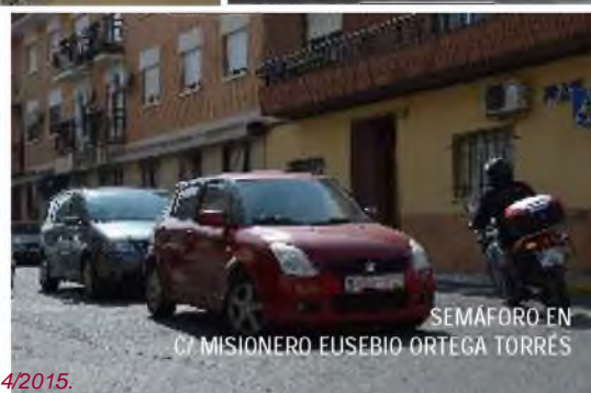
SEMAFORO EN C/ MISIONERO EUSEBIO ORTEGA TORRES