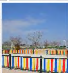
PARQUE ALBUERA Y TUELOS INFANTIL