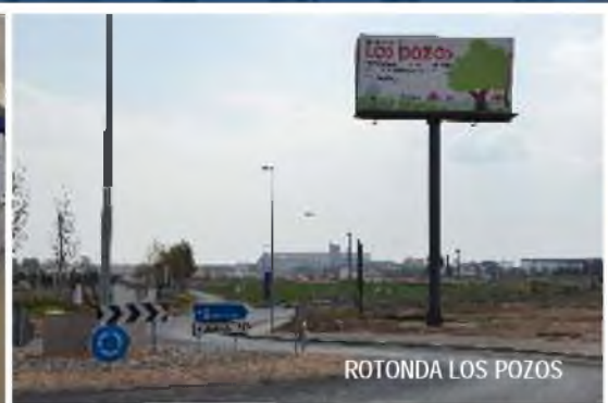
ROTONDA LOS POZOS