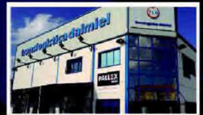
Servicio de Expedición

Polígono Industrial Daimiel Norte (SEPES) Calle Carreteros, Parcela 62 13250 DAIMIEL (Ciudad Real) Tfno.: 926 26 08 78 Fax: 926 85 42 43 info@translogisticadaimiel.com y www.translogisticadaimiel.com