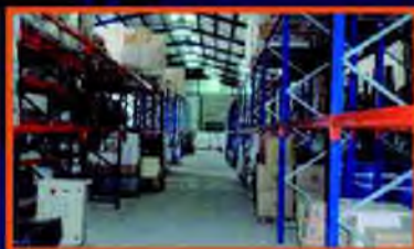
Servicio de Almacenaje