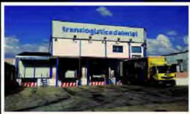
Servicio de Distribución