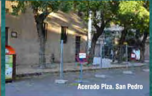
Acerado Plaza. San Pedro