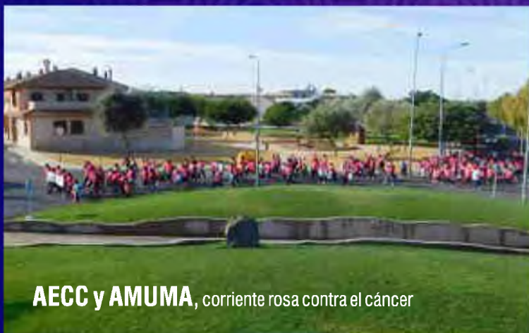
AEC y AMUMA , corriente rosa contra el cáncer

Se retoma el proyecto del colegio San Isidro. La JCCM manifiesta su intención de dotar de partida presupuestaria para 2017 la remodelación del colegio por 1,2 millones de euros. La noticia cuenta con el apoyo del AMPA. La primera fase contempla la construcción del nuevo edificio de Educación Infantil, aula de Educación Especial y aula de fisioterapia. Una vez trasladado el alumnado al nuevo edificio, la segunda fase consistirá en la reforma integral del edificio 2 como aulario de Primaria, ejecutando un nuevo núcleo exterior de escalera y ascensor, nuevo cuarto de instalaciones y porche. Por último, y una vez trasladado el alumnado de Primaria al edificio 2, se llevará a cabo la tercera fase consistente en la reforma integral del edificio 1 para albergar dependencias de administración, biblioteca, sala de usos múltiples, aulas de pequeño grupo de primaria, departamentos y sala de reuniones del AMPA. La obra se desarrollará en tres fases durante las anualidades 2017 y 2018.