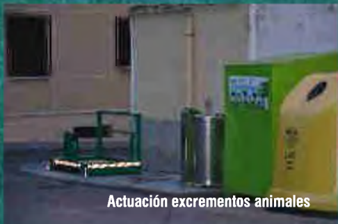
Actuación excrementos animales