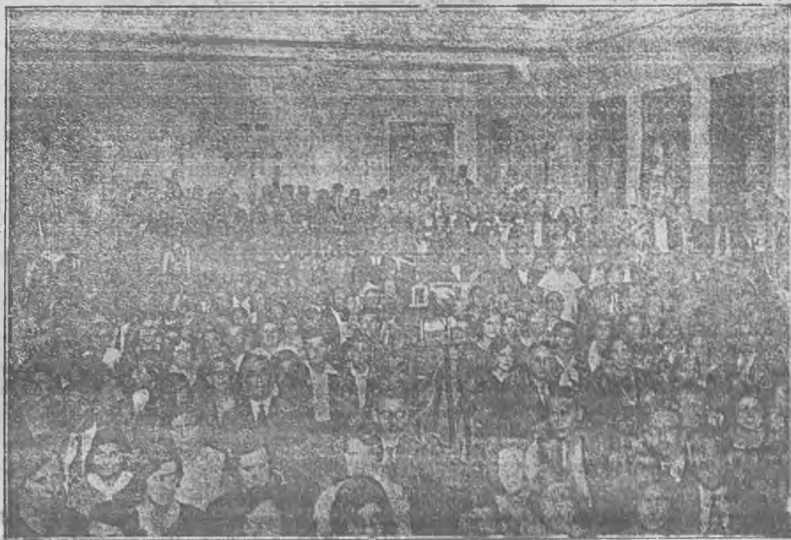
Aspecto de la sala de conferencias, el día de la clausura

la F. U. E. De ella son los clichés que reproducimos. La labor que en ella se desarrolló fué magnífica. Los Maestros tuvieron ocasión de recibir lecciones, que, a no ser por esta Semana Pedagógica, jamás hubieran podido escuchar. Profesores de Universidad, Normal, Instituto, Maestros colaboraron en ella.