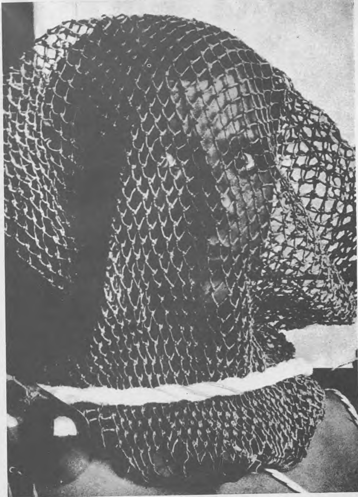
Retrato por Chebés