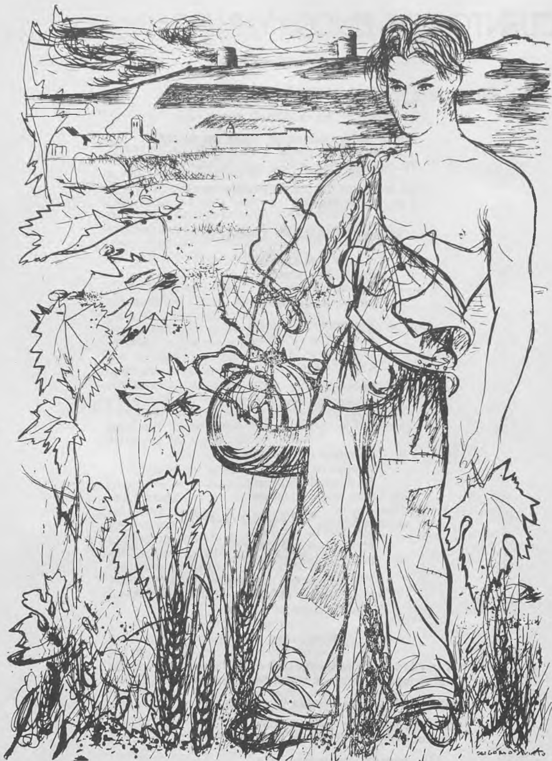
«La Mancha» por Gregorio Prieto