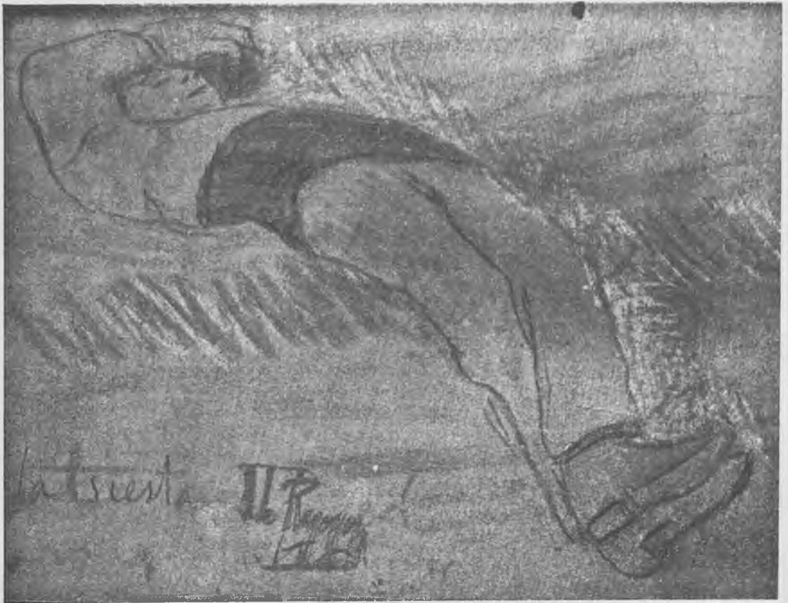
Dibujo de Darío Regoyos,