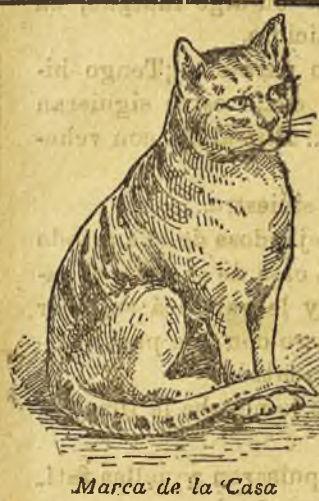
Marca de la Casa

Encarnación Ibáñez Da lecciones de planchado en su propia casa, ó á domicilio, á precios módicos. Vende útiles para obtener el brillo y enseña á usarlo. Valbuena, 5.-Valdepeñas