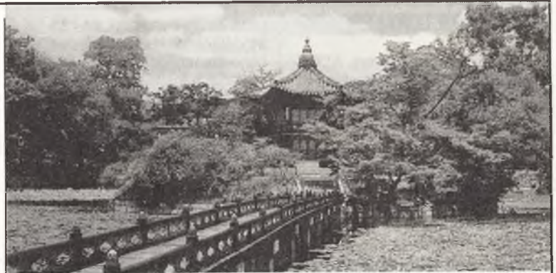
El pabellón Hyang-Wonjong en el Palacio Kyongbokkung

SEUL. La ciudad capital, está ubicada en el centro de la península coreana y hacia la costa occidental. Desde los tiempos remotos, este lugar ha sido poblado por