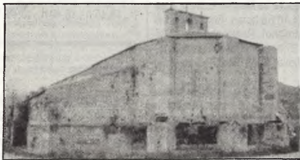
Cordillera del Himalaya al fondo

Villa de la provincia de Guadalajara situada en la margen izquierda del río Tajo, al sur de Cifuentes, en uno de los más pintorescos lugares de la provincia, rodeado de bosques y roquedales. Su actividad se ha visto impulsada por la creación de la Central Nuclear de Trillo. Allí se une el Cifuentes