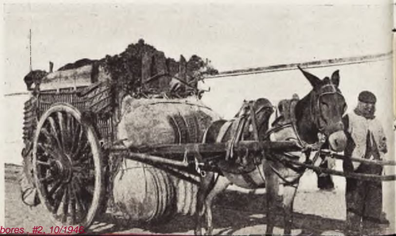
Así se cargan los carros en Tomelloso. El de la fotografía es un curioso ejemplar cuya carga en limpio es nada menos que de cuatro toneladas y media.