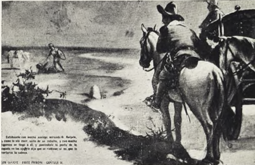
Enfascado con veinte años mirando D. Quijote, y como lo vio venir, salió de un caballo, y con mucha sorpresa se llegó a él, y preguntóle la causa de la caída en tan fuerte día que se caían: él se que le torturara la cabeza.

SON QUIJOTE. PARTE PRIMERA. CAPÍTULO 14.