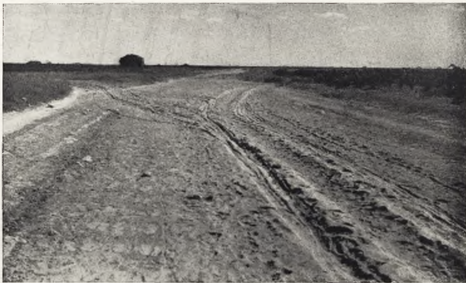
Vista de un camino real manchego, ruta quijotesca por excelencia. En el fondo, a la izquierda, la venta se yergue, abatida por los siglos, dando al paisaje un sabor de innegable evocación cervantina

Quien haya tenido la feliz idea de leer el Quijote y conozca concienzudamente el territorio manchego, habrá podido comprobar la precisión con que Cervantes nos describe, en los capítulos de este libro, los distintos parajes por donde su personaje fué haciendo ruta. Ningún detalle,