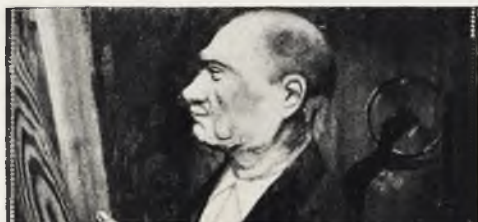
↓ Mi padre

Por nuestra parte nos resta decir que nos admiran estos trabajos escondidos en un pueblo. Y nos atrevemos a indicar que este arte se debía enseñar en las escuelas de Artes y Oficios, para darle impulso y que no se pierda, como ocurre con la cerámica, que debido a su enseñanza, se conservan y perfeccionan las experiencias de innumerables ceramistas.