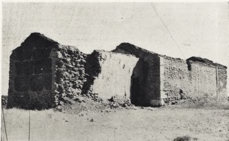
Ruinas de la Venta del Barón del Solar de Espinosa. Solo el cuerpo del edificio que aparece a la derecha pertenece a la venta primitiva. Lo de la izquierda, como puede observarse, es de época más reciente.

A pocos kilómetros del pueblo, y en el mismo camino real a que hemos aludido, se halla la venta del Barón del Solar de Espinosa, ligada a la tradición cervantina y de cuya presencia en la ruta del Quijote hemos hecho mención. Esta venta ha sido demolida en parte, y de su primitiva construcción aun queda una cuadra, cuyas esquinas, formadas por grandes bloques de piedra de sillería, nos recuerdan las de las construcciones antiguas. Al visitarla, penetramos por una puerta que amenaza hundirse y que conduce a una cocina de más reciente construcción. Pero lo que más llamó nuestra atención es el arco situado en la pared que hay entre la cocina y la cuadra. Este está hecho también por grandes bloques de piedra de sillería, los cuales aparecen colocados sin la más pequeña porción de argamasa o sustancia análoga que los una. Ya dentro de la venta, evocé todo cuanto la tradición refiere de ella y, como fascinado por el