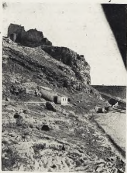
El Castillo de Peñarroya visto desde poniente.

a San Miguel y la muerte de la Virgen; son obras menos que medianas. El camarín, detrás del altar, también está recubierto de malas pinturas costeadas en 1887 por las villas de Argamasilla y La Solana, representándose en ellas escenas diversas de la vida de la Virgen o pasajes de las Sagradas Escrituras, así como en el techo la Coronación de Nuestra Señora, obra de un pintor tan adocenado como el que copió en uno de los paneles el cuadro de la Sagrada Familia, de Rafael.