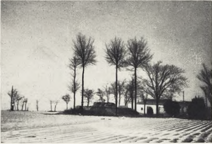
Oasis en la nieve.