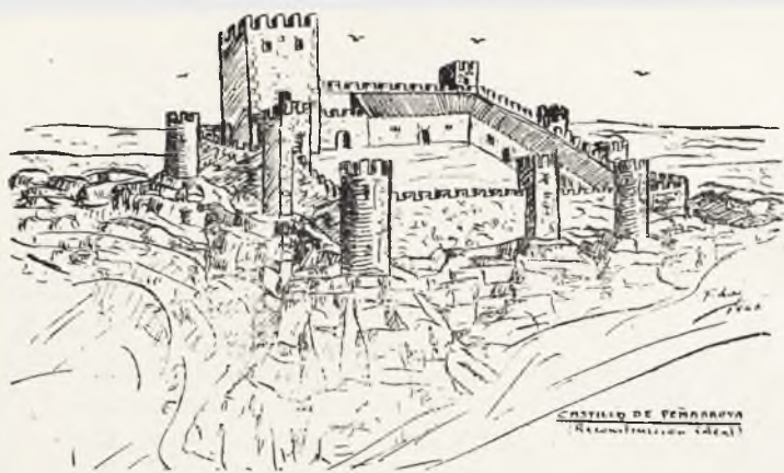
CASTILLO DE PEÑARROYA (Reconstrucción actual)

las fronteras a la orden militar de los templarios. La primera oleada de los almohades, venidos a España en socorro de las débiles monarquías morunas andaluzas, pronto irrumpió en la Mancha que, como consecuencia de