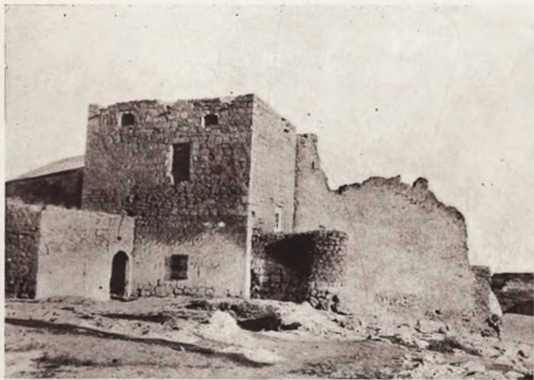
R UINAS del Castillo de Peñarroya.