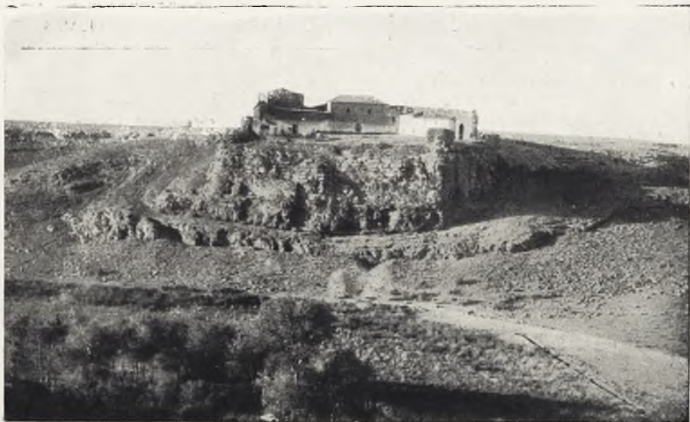
El Castillo de Peñarroya visto de frente. En primer término la vega del Guadiana, que en la actualidad presenta un aspecto completamente distinto por construirse en esta escotadura la presa del Pantano de Peñarroya.

muchos años junto al castillo de Alcázar de San Juan, por Portus Lapidum (Puerto Lápiche) y Consaburum (Consuegra), a Toletum (Toledo). Hasta que después de la reconquista fué acometida la repoblación del país manchego repartido a las órdenes militares de San Juan, Santiago y Calatrava, surgiendo nuevos pueblos en la extensa paramera y reconstruyéndose numerosos castillos para la defensa del territorio, las antiguas vías romanas continuaron desempeñando un importante papel, tanto para las comunicaciones entre poblaciones distantes, cuanto con el carácter de vías militares; de ahí que durante la dominación árabe y de manera especialísima cuando por el empuje continuado de los cristianos hacia el sur convino asegurar el tránsito, en lugar de las primitivas estaciones romanas fueran construidos castillos formando una cadena de puestos fortificados, a distancia conveniente y siempre en puntos