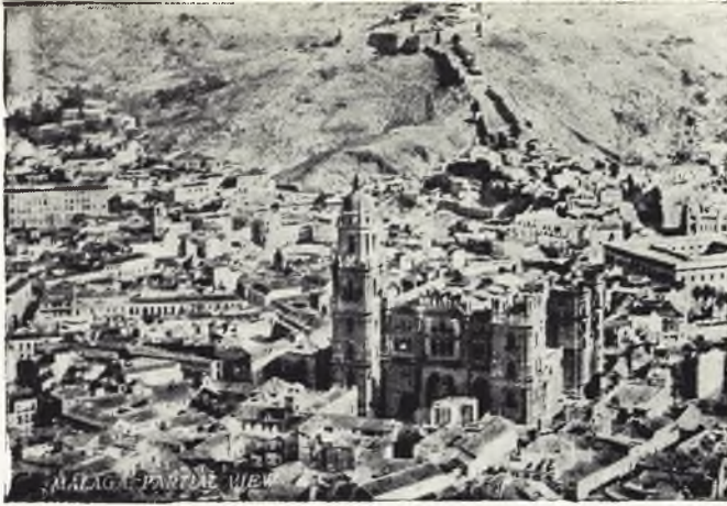
Vista parcial de Málaga.