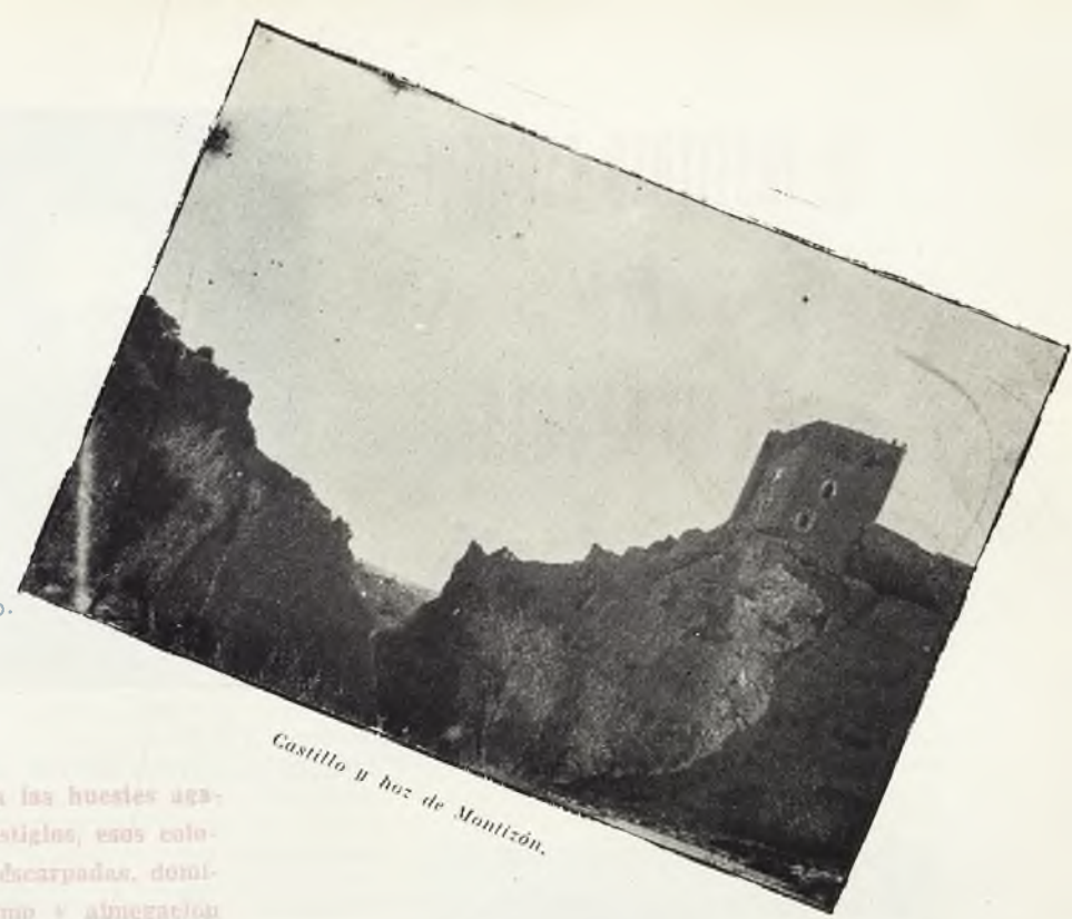
Castillo Hoz de Montizón.

L a lucha encarnizada mantenida por los cristianos contra las huestes agarradas a través de ocho siglos, dejando, entre otros vestigios, esos colosales de piedra que se alzan en el umbral de las sierras escarpadas, dominando valles y desfiladeros, como relicarios del heroísmo y abnegación de nuestra raza. Estos Castillos de la Mancha, esqueletos y abatidos, fueron escenario de gestas y acontecimientos, cuya noticia nos llega, unas veces con el irrefutable testimonio de la Historia, y otras por el cauce de la leyenda popular, en intrigantes narraciones o en conmovedores romancesillos. Hoy, sólo son fantasmas rosales que lanzan a la noche el quejido de sus piedras derruidas por el frío y que, durante el día, prestan al paisaje manchego un sello de magnificencia y austeridad incomparables.