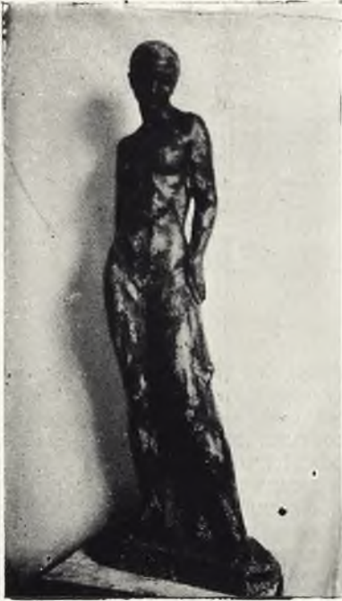
"Desnudo" (En piedra de Urda. 1935)

nobles aspiraciones. ¿Cuántos, con menos méritos, no triunfan por otras provincias o en otros países?