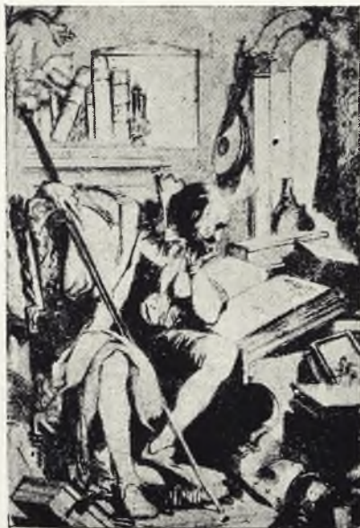
Ilustración de una edición inglesa del "Quijote"

Tus obras los rincones de la tierra, llevándolas en grupa "Rocinante", descubren, y a la envidia mueven guerra