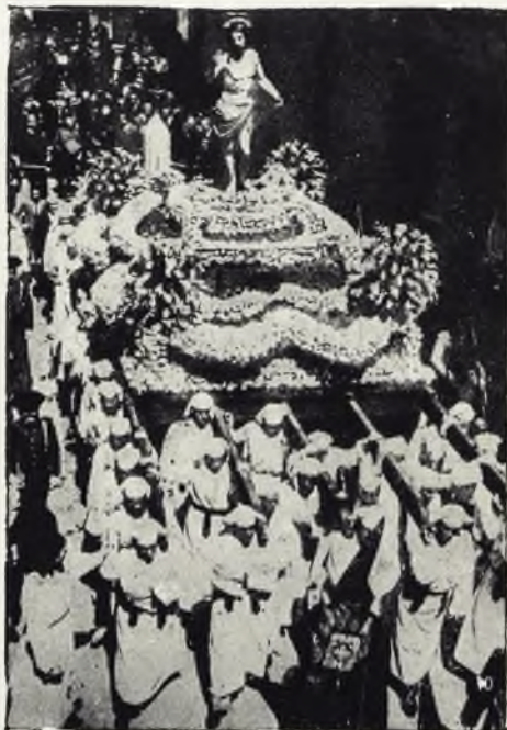
Una procesión malagueña.

Ya viene la Virgen de la Estrella, como un lucero que desde lejos se nos acerca hasta cegarnos con su brillo de sol; ahora pasa la Virgen de la Esperanza, que sabe de tantos fervores de las malagueñas; y esa expresión ab-