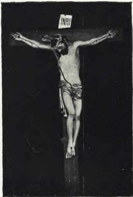
“Santísimo Cristo de la Piedad” (En madera de nogal policromada.—1941. Parroquia de la Merced, de Ciudad-Real.