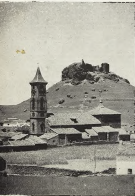
Montiel y su Castillo.