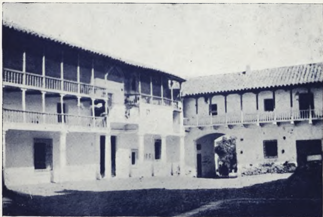
LA PLAZA DE SAN CARLOS DEL VALLE, con sus antiquísimos soportales, ofrece un modelo pintoresco de plazuela manchega.