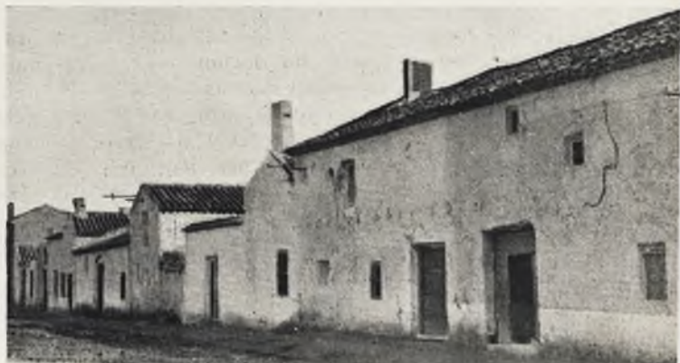
Una de las primeras edificaciones con planta alta.

A los diez y ocho... que es tierra pobre de leña porque no la alcanzan ni tienen sino es yendo por ella tres leguas, y que van por ella a los términos de Alhambra y la leña que se