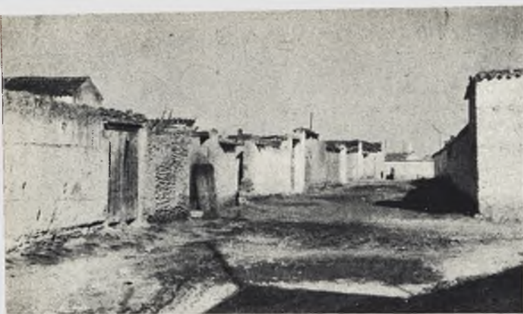
Una típica calle de aldea, que evoca los primeros años de vida de Tomelloso. (F. Muñoz.)

atrás por los reyes a personas de rancio abolengo y que los sucesores de éstas conservan cual preciadas joyas; la estirpe de estos villanos de Tomelloso nada tiene que envidiar a la de muchos duques y marqueses, pues si el ser noble significaba antaño figurar entre los mejores , en ese grupo selecto debe contar este vecindario.