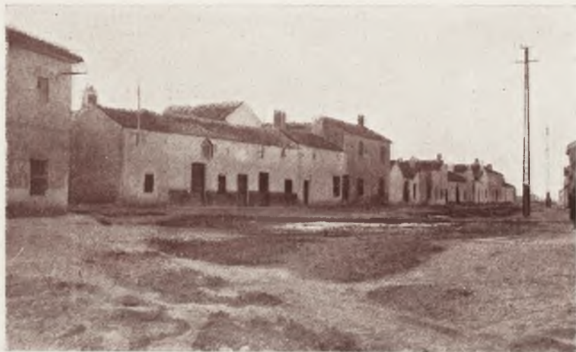
Plaza del ALTILLO y final de la calle del CHARCO donde se encuentran un grupo de casas de las más antiguas del pueblo.

A los treinta y ocho... que la Iglesia deste lugar es Parroquial y su advocación de Nuestra Señora de la Concepción, y que las prebendas se las lleva el marqués de Aguilar