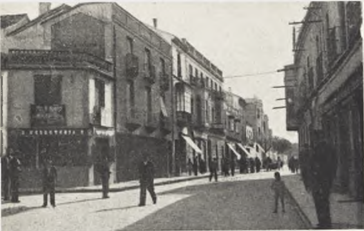
Una vista de la misma calle anterior, tomada en nuestros días. Por obra y gracia del trabajo y ejemplaridad de sus hijos. Tomelloso ha pasado, de su primitiva condición de aldea, a su actual estado de ciudad moderna.

de Socuéllamos, y al efecto logró separarse de esta jurisdicción y adquirirla propia con la categoría de villa el año 1764, mediante el pago de una fuerte suma; según la carta mencionada. un año de regular cosecha recolectábanse hasta 70.000 fanegas de cereales entre trigo, cebada y centeno, tan excelente la calidad de aquel por ser muy blanco y fino, y para Valencia, donde se estima mucho, tiene mucha saca ; ya hacía un siglo que la primitiva iglesia fué demolida para alzar la actual, hermosa en el lugarón vulgarote de entonces, pero que hoy resulta pequeña y pobre.