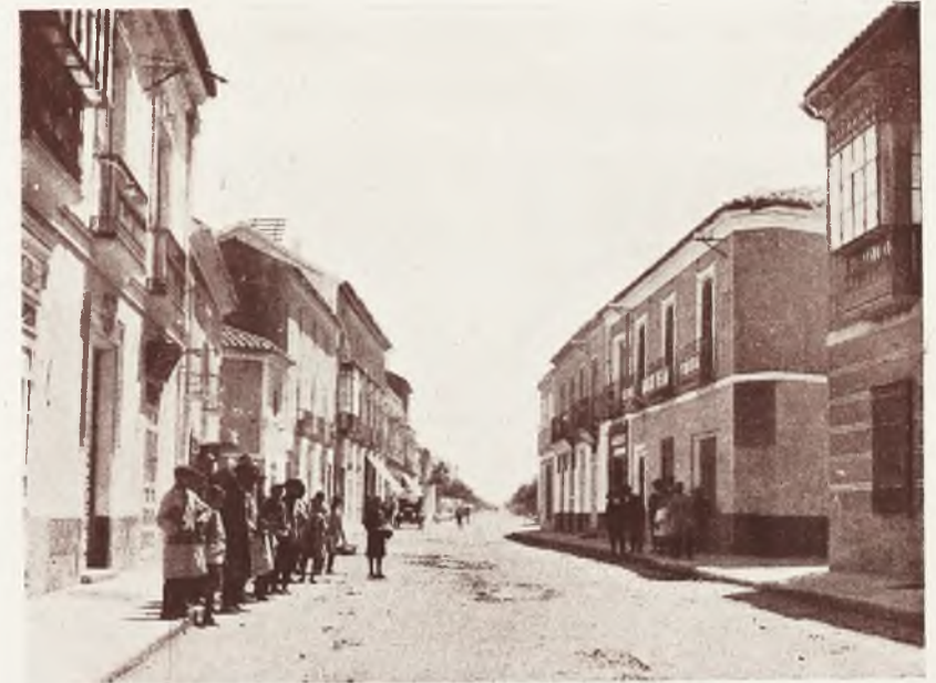
La arteria principal de Tomelloso, tal y como se encontraba a principios de siglo, cuando se denominaba CALLE DE LA FERIA.