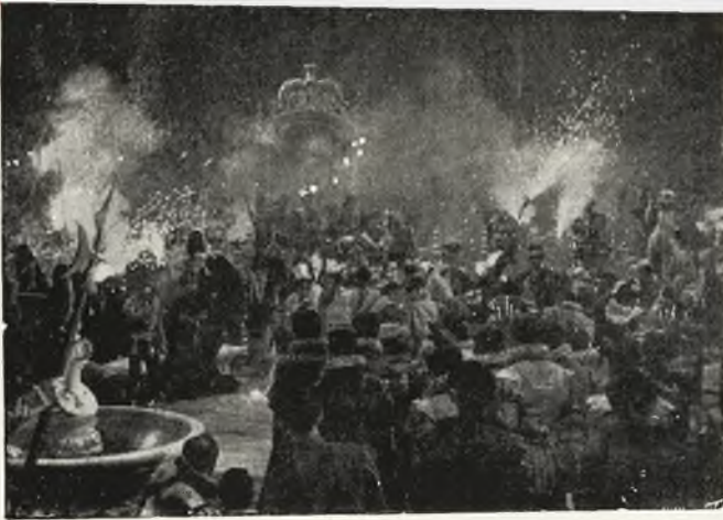
Don Quijote y Sancho en el caballo «Clavileño».

Y he aquí que, cuando menos se esperaba, un director español, un gran realizador: Rafael Gil, emprende la tarea codiciosa y difícil de querernos traer a la pantalla algo en lo que otros fracasaron o no intentaron por miedo a fracasar.