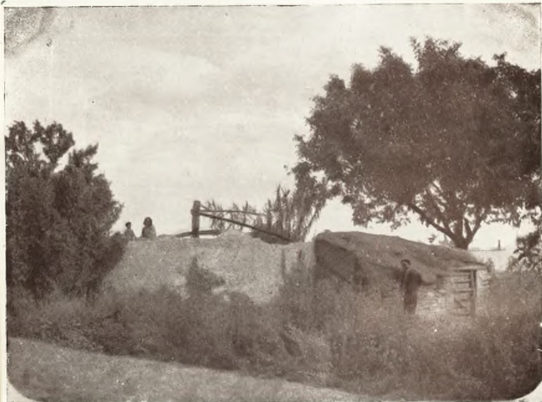
LA NORIA (Paisaje de otoño.)