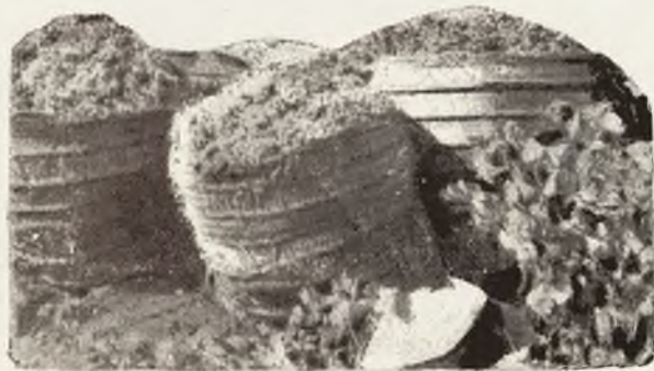
Una escena de la vendimia. (Apunte por Ramón Mira.)