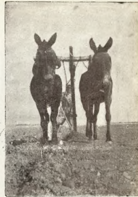
Haciendo barbecho.