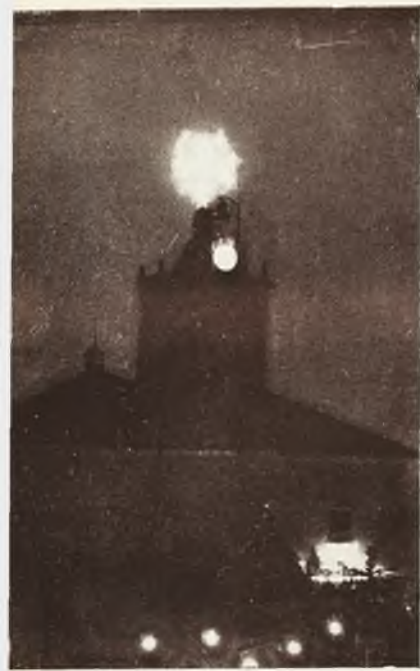
La torre de la iglesia de Tomelloso con la cruz iluminada durante la Feria.

CON la llegada del otoño se apagan los pueblos de Castilla el bullicio y el esplendor de las ferias septembrinas. Se vuelve a la vida de los quehaceres y las ocupaciones. Esperan los dorados granos de la vendimiadora y en los campos surge la áspera sonata de los que muelen la uva. Día y noche recorren las calles anchurosas de los manchegos las largas caravanas de carros que traen el fruto maduro. Noche a noche los pueblos manchegos estudian las cuadrillas de vendimiadores que vienen de los puntos más distintos de Castilla y Andalucía en demanda de trabajo. Nosotros hemos visto sus semblados y demacrados rostros y esos ojos febriles, cargados de melancolía, cuya expresión de aparente desocupación y miseria que les rodea nos recuerda al hombre nómada de otras épocas. Estos hombres las legiones del trabajo vieron desfilar bajo un sol «ruedas que cantó con su ternura de hombre. Con la cosecha del otoño las vides dejarán caer las perlas de esmeralda y las yuntas mirarán el arado sobre las tierras que se han de llevar, prodigándoles la caricia bien merecida de la barbechera.