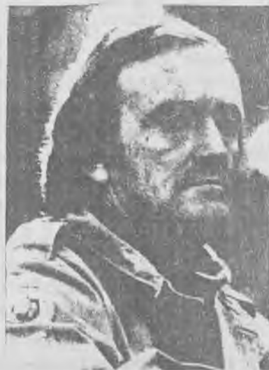
Félix Rodríguez de la Fuente