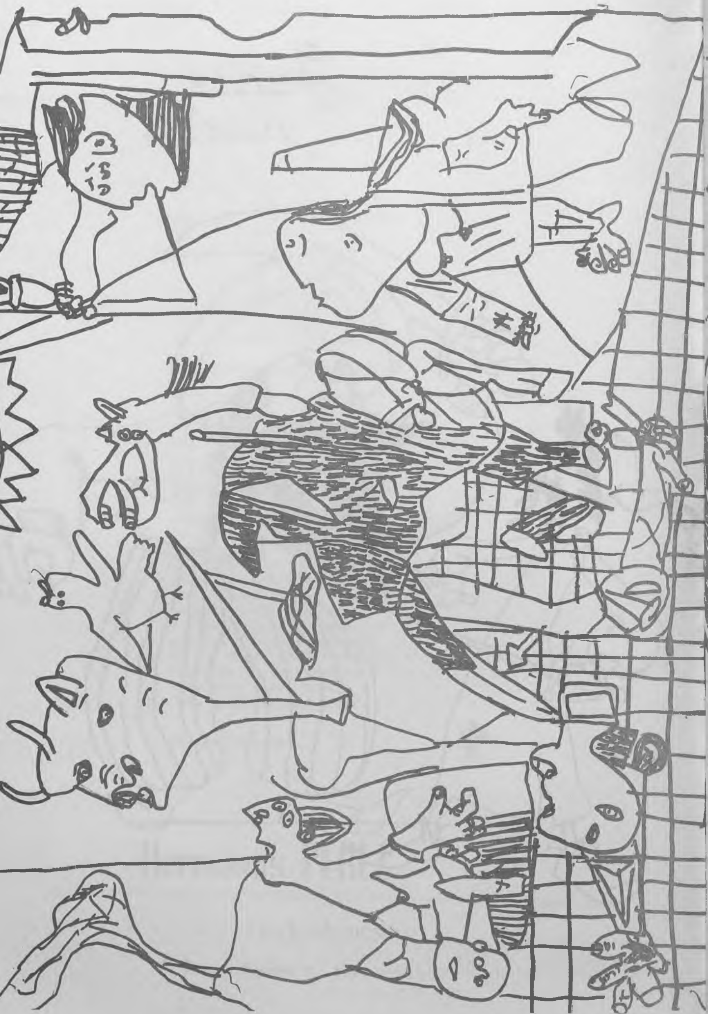
M a ISABEL MOYA PORTERO 10 años