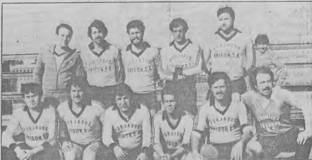
El B.M. Cosmos, al final, se tuvo que contentar con ser el Campeón de Invierno, cuando se había mantenido en cabeza mucho tiempo

No tuvieron tarjetas: Daniel, Jerónimo y Fernández.