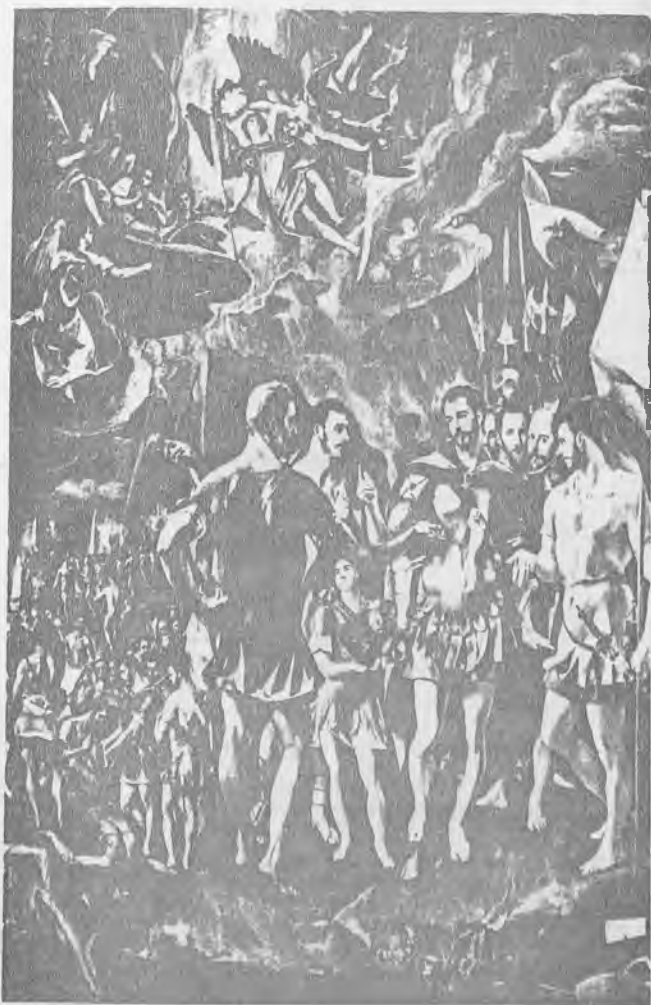
Martirio de San Mauricio, del Greco (Monasterio de El Escorial)

Comenzamos esta nueva sección que tratará sobre el comentario de algún cuadro famoso. Nos referiremos, más que nada, al cuadro en concreto, no al autor (vida, características etc.).