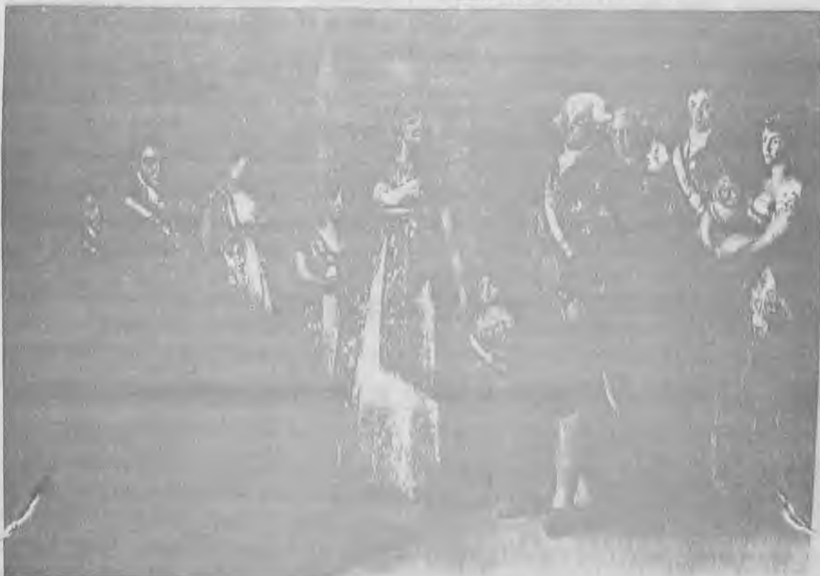
La familia de Carlos IV, por Goya (Museo del Prado)

Este mes traemos a esta sección un cuadro de otro gran pintor español, quizá uno de los mejores. El cuadro es "La familia de Carlos IV", y su pintor fue Francisco de Goya y Lucientes (1746-1828).