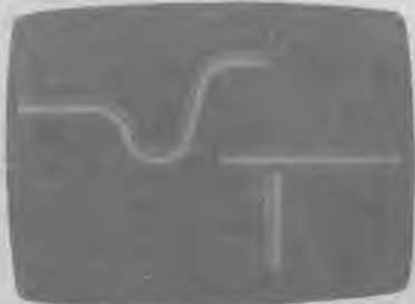
IMAGEN Y COMUNICACION

VIDEO INDUSTRIAL - PUBLICITARIO DIDACTICOS - CONGRESOS - REUNIONES REPORTAJES (BODAS, COMUNIONES, ETC.)