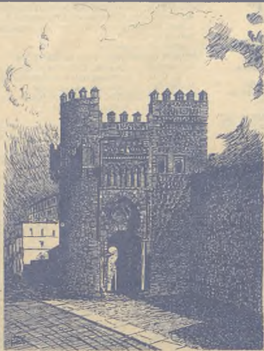
PUERTA DEL SOL - TOLEDO

Año II - N.º 44 - 16 de julio al 22 de julio