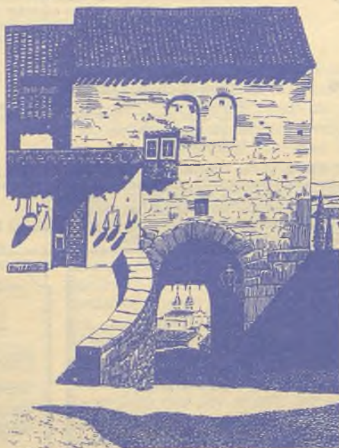
PUERTA DE VALMADRERA-TOLEDO

Año II - N.º 36 - 14 de mayo al 20 de mayo