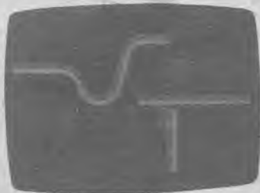
IMAGEN Y COMUNICACION

VIDEO INDUSTRIAL - PUBLICITARIO DIDACTICOS - CONGRESOS - REUNIONES REPORTAJES (BODAS, COMUNIONES, ETC.)