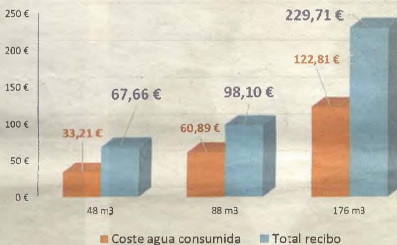
Diferencia entre el coste del agua y el recibo final según el consumo

Todas las tarifas del recibo del agua las pone el Ayuntamiento y las cobra la empresa adjudicataria.