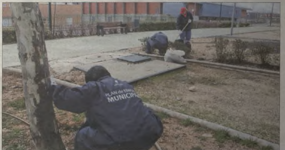
El Plan Social de Empleo se ampliará en 2015, comenzando la selección de personal en enero.

Un ejemplo es el acuerdo alcanzado con la empresa Farmavenix el pasado año, por el cual se recogieron cientos de currículums con el compromiso de