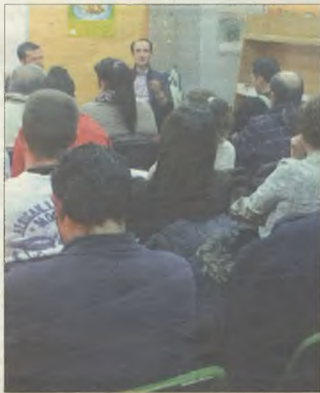
El servicio contra las cláusulas suelo comenzó a principios de año con sesiones informativas.

Ante esta situación de abuso de las entidades bancarias y la inacción del Gobierno de España, el Ayuntamiento de Azuqueca de Henares puso en marcha a principios de este año un servicio municipal mediante el cual, a través de un convenio con la organización de consumidores ADICAE, prestó apoyo jurídi-