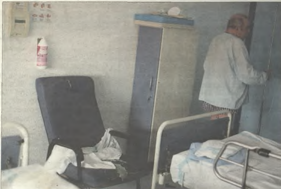
El mobiliario de las habitaciones no se renueva, la imagen de abandono es absoluta.