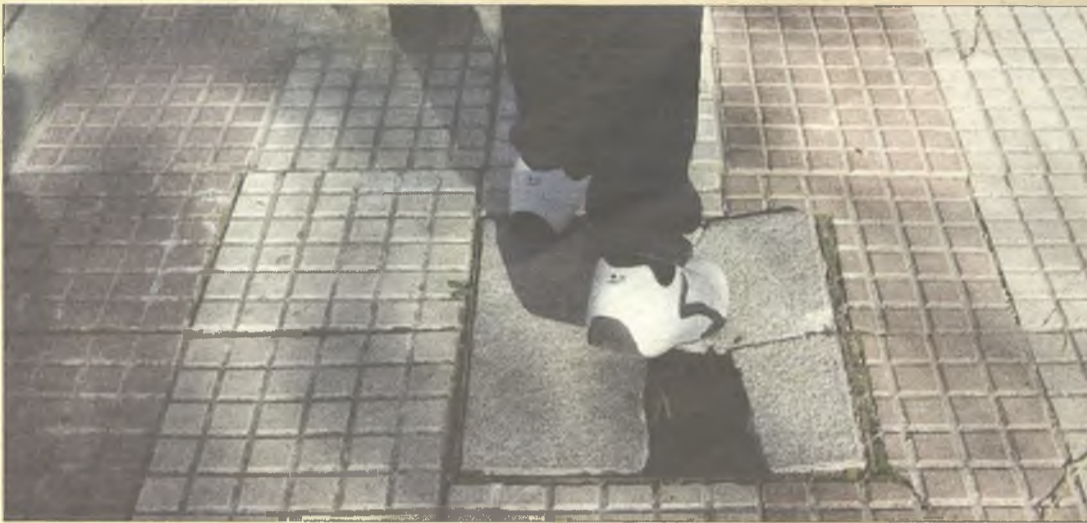
> En la calle Camilo José Cela, de la capital, existe este peligroso agujero en plena acera.

Haznos llegar imágenes de aquellas situaciones o cuestiones que quieras denunciar públicamente y nosotros intentaremos recogerlas en esta sección ( redaccion@lacalle.info ):