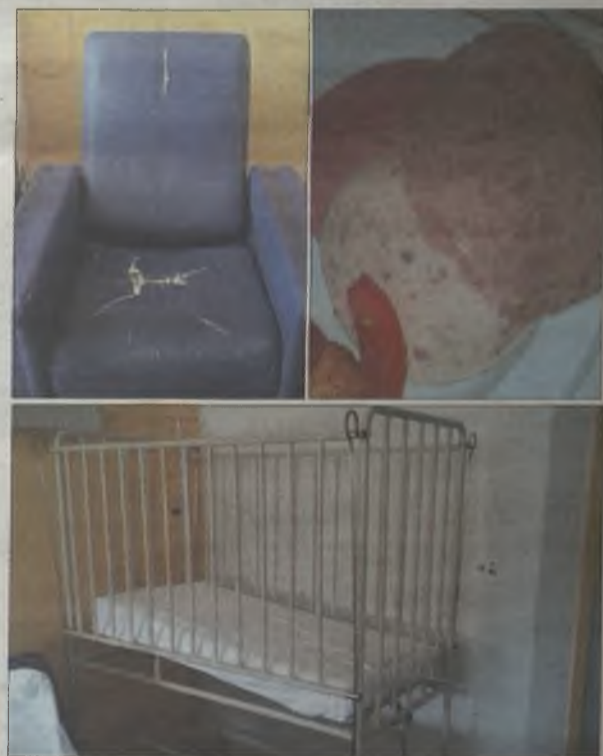
La planta de Pediatría debería reunir unas condiciones acordes con la edad de sus pacientes. Nada más lejos de la realidad.

El sillón en el que debía dormir el acompañante del bebé "parecía directamente sacado de la basura". Rajado en la tapicería y con el mecanismo estropeado, "no se podía reclinar para dormir". Un celador, avergonzado por el espectáculo, "trajo una sábana para taparlo y la sábana también estaba rota, tenía un 'siete' en todo el centro". Asumiendo la necesidad de ahorro que en estos tiempos impera, estos sufridores pacientes aseguran que no piden "un hotel de 5 estrellas, pero sí las condiciones mínimas para poder estar con un bebé de 9 meses".