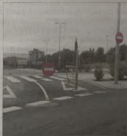
Acceso cerrado hacia la rotonda del GEO.

El Ayuntamiento podría haber recepcionado y abierto la infraestructura de oficio durante los cuatro años que Román ha estado prometiéndolo para antes de Ferias, pero esperó a las últimas antes de las próximas elecciones municipales.