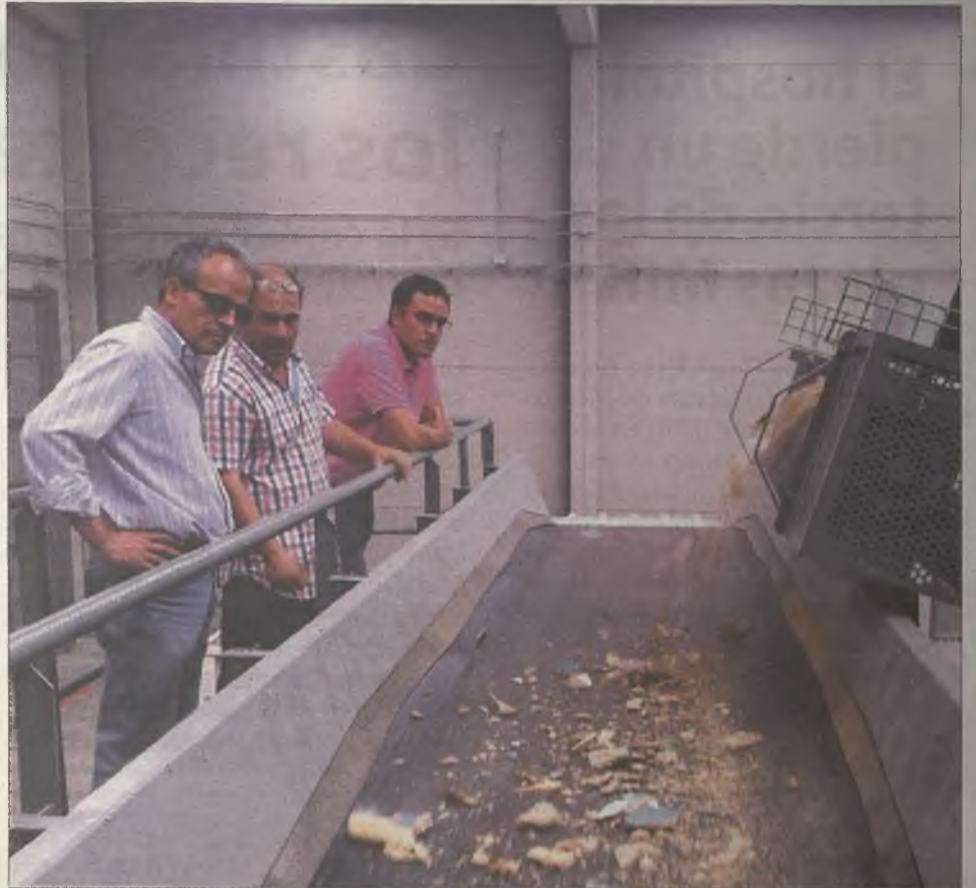
Una de las líneas que funcionan en la Planta de Voluminosos de la MVH en Yunquera.

"Esta medida supone un paso decisivo para superar la difícil situación en la que se encontraba la Mancomunidad en cuanto a su deuda y acercarnos a