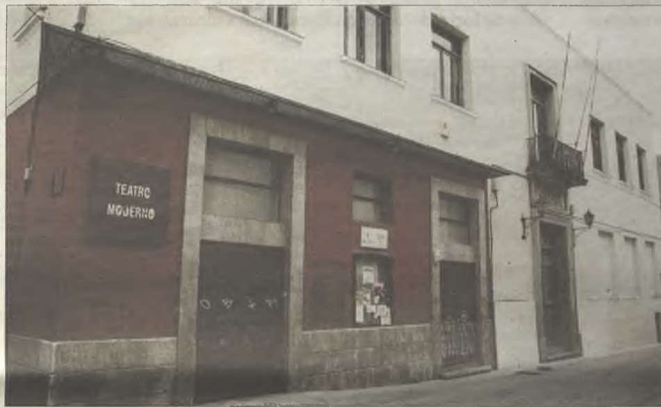
Teatro Moderno y Ateneo Municipal.

En realidad son simplemente obras de consolidación de las cubiertas y fachada del Ateneo Municipal, que forma un solo edificio junto al Teatro Moderno, obligadas porque el inmueble no