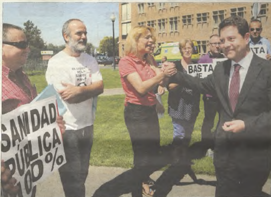
García-Page, apoyando las reivindicaciones a favor de una sanidad pública y sin recortes.

El anuncio de García-Page ha venido acompañado de varias propuestas que, a su juicio, son prioritarias en Castilla-La Mancha y que se ha comprometido a poner en marcha de manera inmediata de ser elegido presidente de la región en mayo de 2015. En concreto, el líder socialista ha enunciado la necesidad de llevar a cabo dos grandes pactos por el empleo y por la sanidad. "El desempleo y el deterioro de la sanidad son los dos grandes problemas de Castilla-La Mancha", ha afirmado García-Page, quien ha añadido que abordar estas cuestiones "no es sencillo, pero sí posible y financiable". Asimismo, ha expresado su compromiso de dedicar las próximas semanas y meses a "hablar con todo el mundo para que entre todos tiremos del carro y demos la respuesta que la ciudadanía de Castilla-La Mancha necesita y merece".