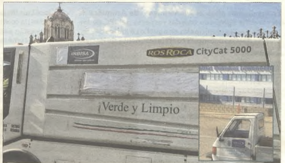
Vehículos de limpieza de Cabanillas en Guadalajara capital y Quer (imagen inferior).