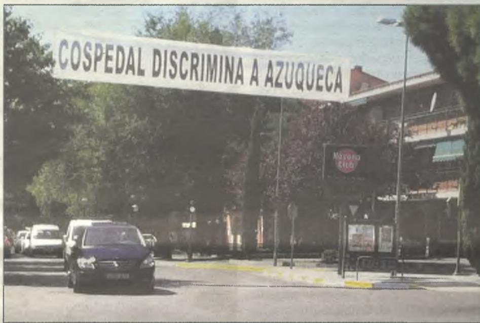
A pesar de la deuda millonaria que el Gobierno de Cospedal sigue manteniendo con Azuqueca, el Ayuntamiento ha mantenido una presión fiscal baja desde el comienzo de la crisis.