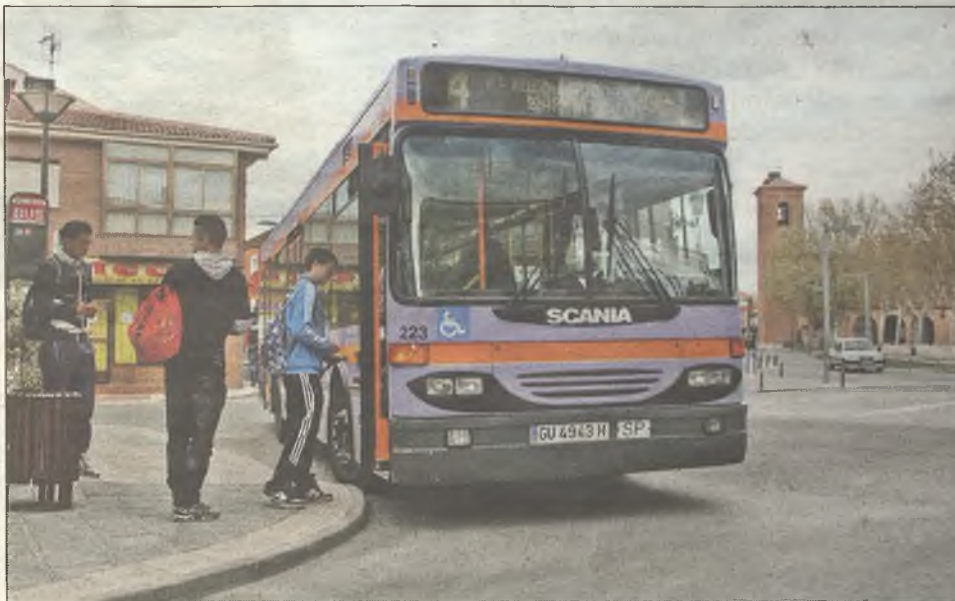
La antigua Línea 4 con parada en Marchamalo tenía cerca de 400.000 usuarios al año.