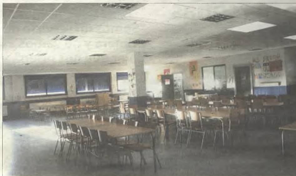
Sala polivalente del colegio La Muñeca, que se utiliza como comedor y como gimnasio.

En los últimos meses han recogido más de 3.000 firmas de apoyo a su reivindicación y, a dos meses y medio de las próximas elecciones, por fin el Gobierno de Cospedal les respondió. Pero