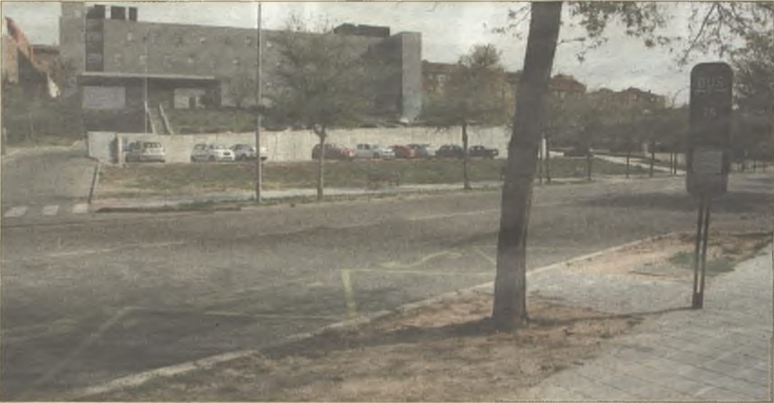
> La parada de autobús de la residencia de mayores "El Balconcillo" y el Instituto Oncológico no tiene marquesina. Además de las largas esperas, sus usuarios tienen que aguantar a pleno sol o bajo la lluvia.