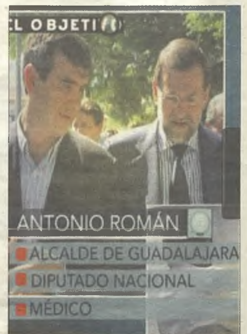
Imagen del reportaje de La Sexta sobre las múltiples actividades de Román.

declaración de bienes publicada en el Congreso de los Diputados (año 2011), al sueldo político de unos 70.000 euros anuales sumaba unos ingresos cercanos a los 30.000 euros por su consulta médica privada y más de 2.000 euros en dietas como consejero de Ibercaja. A ello hay que añadir los aproximadamente 2.400 euros que cobra cada año en dietas al Ayuntamiento. En total, unos 110.000 euros al año. Y así, 12 años ya.