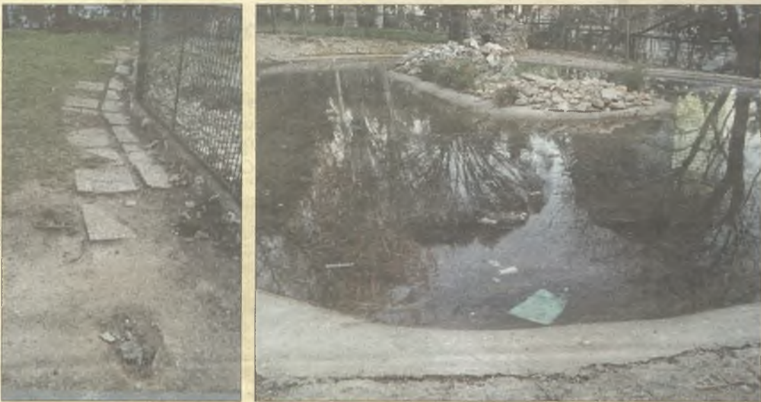
> Así está el estanque de los patos del parque de La Amistad - Esperanza. Patos no hay, pero sí mucha porquería en el agua y en los alrededores.

Haznos llegar imágenes de aquellas situaciones o cuestiones que quieras denunciar públicamente y nosotros intentaremos recogerlas en esta sección ( redaccion@lacalle.info )