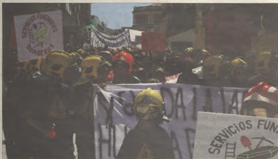
Los vecinos de la capital respaldaron las reivindicaciones de los bomberos.