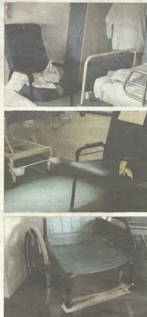
A la izquierda, techo caído en la octava planta del hospital. A la derecha, estado del mobiliario que utilizan los pacientes.