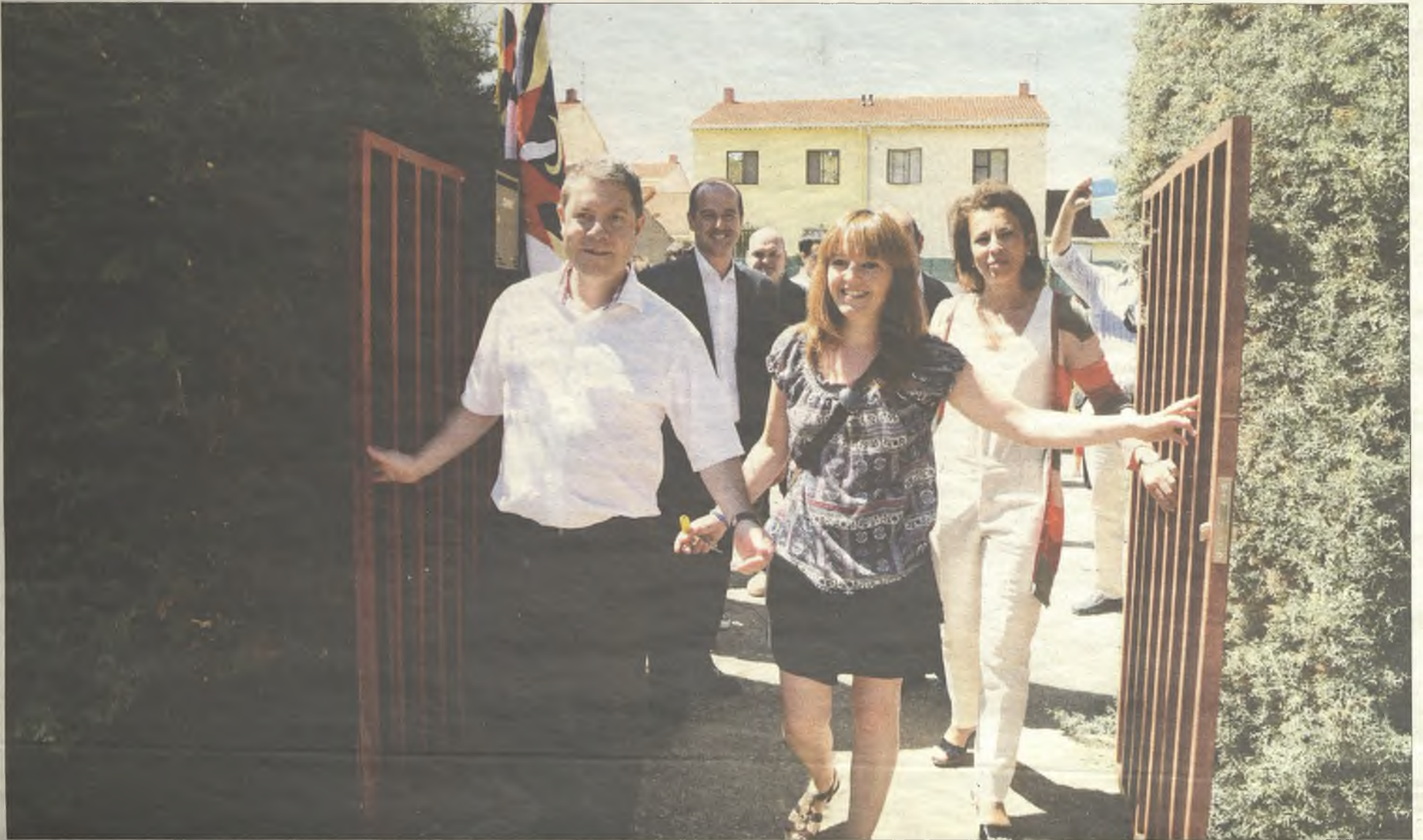
Emiliano García-Page con la alcaldesa de Alcoroches, reabriendo la escuela de la localidad poco después de tomar posesión como presidente.