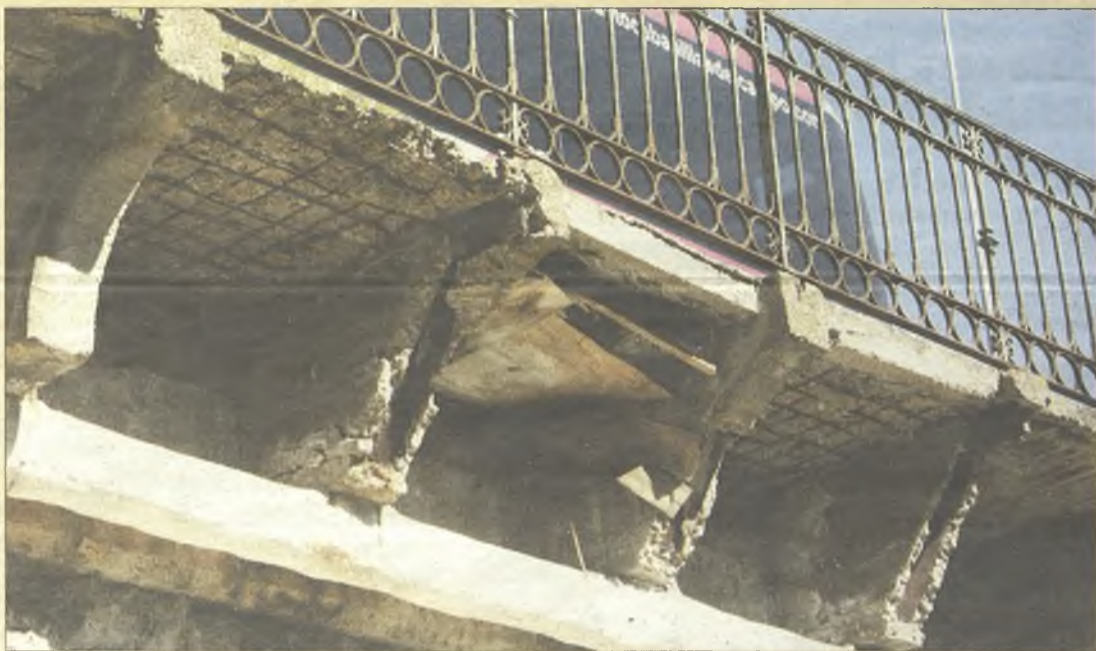
> Así está el Puente Árabe, ejemplo de cómo cuidan nuestro patrimonio histórico quienes gobiernan el Ayuntamiento de Guadalajara. A alguien que "presumía de ciudad" debería caérsele la cara de vergüenza.

Haznos llegar imágenes de aquellas situaciones o cuestiones que quieras denunciar públicamente y nosotros intentaremos recogerlas en esta sección ( redaccion@lacalle.info )