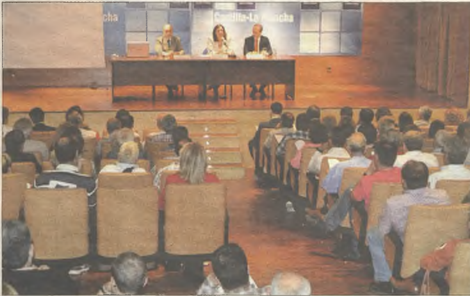
La consejera de Empleo presentando el plan a los alcaldes de la provincia de Guadalajara.

Sin embargo, sólo un día después de que la consejera de Economía, Empresas y Empleo presentase el plan a los alcaldes de la provincia de Guadala-