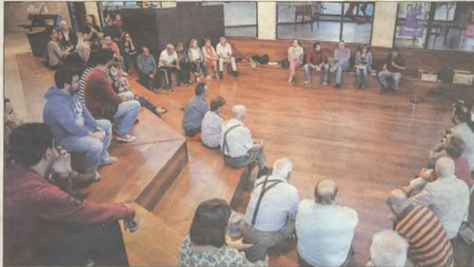
Asamblea Vecinal de la semana pasada en el Espacio Joven de Marchamalo.

Las quejas de los vecinos volvieron a centrarse en problemas cotidianos de convivencia cívica relacionada animales, ruidos y tráfico, mientras que