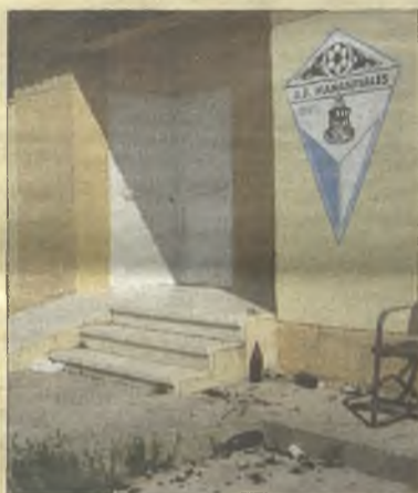
> En las zonas deportivas no lo hacen mejor. ¿Cuánto llevan sin limpiar esto?