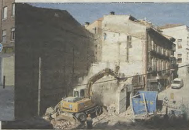
Derribo en la Cuesta del Reloj.