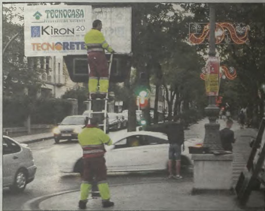
Cambio de anuncio en un reloj-termómetro de la ciudad, durante las últimas Ferias.

Con el objetivo de agilizar estas ayudas, muy necesarias para muchas familias de Guadalajara, el Grupo Socialista incluso se ocupó de dar al equipo de Gobierno un borrador de convocatoria cuatro días después de aprobarse la moción. Sin embargo, Román sigue sin convocarlas.