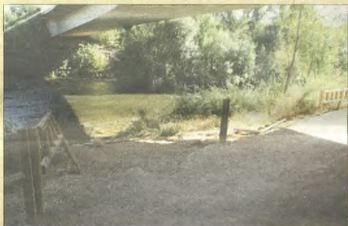
> Y así cuidan la zona de paseo en la ribera del Henares. Muchos meses hace que esto está así y nadie hace nada por remediarlo.