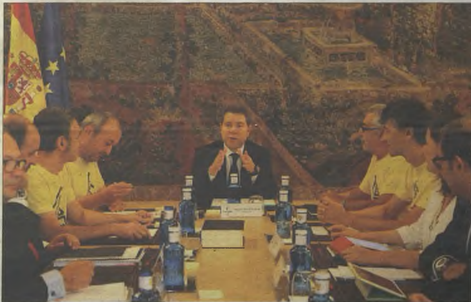
La Plataforma contra el Fracking se ha sentado en el Consejo de Gobierno de Castilla-La Mancha.

La revisión del convenio sanitario con Madrid, del que ya se ha hablado en páginas anteriores y la reclamación ante el Gobierno central de la universalidad de la Sanidad como un derecho básico del ciudadano, han sido otros de los gestos que han marcado sin duda estos primeros cien días de gobierno. Cien días en los que se ha creado una Dirección General de Planificación Territorial y Sostenibilidad para ordenar el territorio con criterios de Sostenibilidad, que impedirá, entre otras medidas, que la práctica del fracking pueda realizarse en la región y que hará que se revise el Plan de Ordenación de Villar de Cañas para impedir la instalación en Castilla la Mancha del basurero nuclear. También se ha desbloqueado el convenio de transportes con la Comunidad de Madrid, que llevaba sin firmarse dos años y que ahora permite a los jóvenes de la región el abono transporte de la capital por 20 euros al mes. En definitiva, cien días después de Cospedal, Castilla la Mancha empieza a ver la luz.