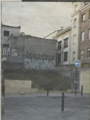
Plaza de Moreno.