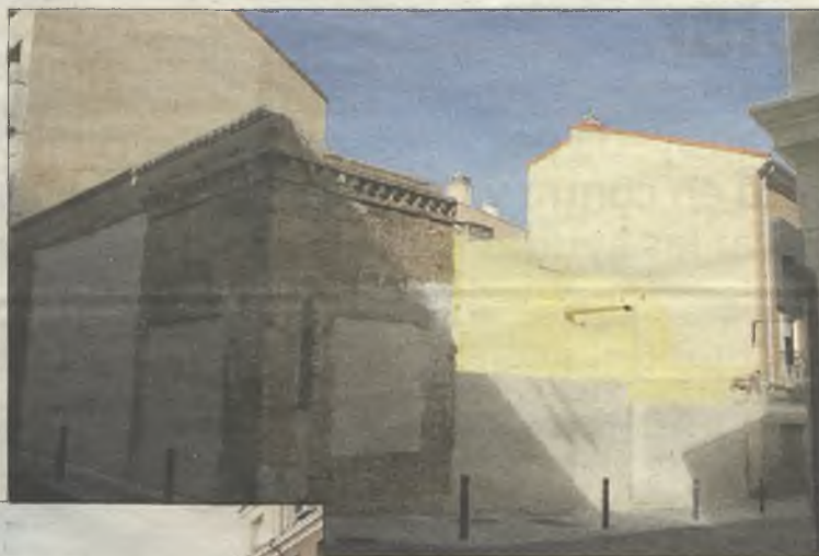
Último edificio derribado, por el momento, en el casco.

El PSOE ya advirtió de que Román había paralizado unos 30 expedientes de derribo hasta que pasaran las elecciones municipales. Desde las elecciones, los derribos han continuado. El último, por el momento, ha sido el de un edificio centenario frente al Liceo Caracense. Pero hay más esperando a la piqueta, en ese mismo entorno y en la Calle Mayor, que pueden acabar muy pronto reducidos a escombros.