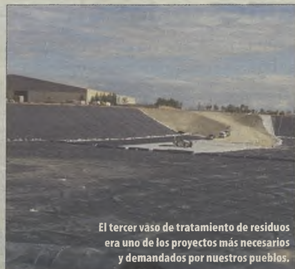
El tercer vaso de tratamiento de residuos era uno de los proyectos más necesarios y demandados por nuestros pueblos.

El Plan de Carreteras también ha avanzado gracias a la gestión del Partido Popular, y a pesar de las zancadillas del PSOE que intentó frenar su ejecución en los tribunales. En la mejora de la red provincial de carreteras se han invertido en los últimos años casi 48 millones de euros, consiguiendo poner al día un plan que estaba al 'ralentí'.