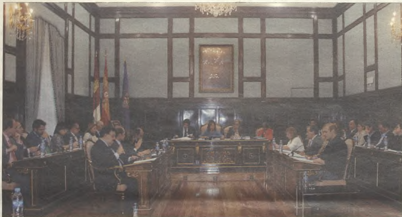
El equipo de Gobierno de Ana Guarinos ha realizado un importante esfuerzo para reducir la deuda y aumentar la inversión.

Frente al despilfarro del PSOE, el PP dedica todo su esfuerzo a incrementar la inversión para mejorar las infraestructuras y los servicios de los municipios