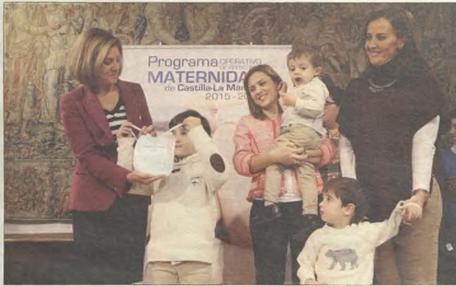
Este programa defiende y protege a la familia, a las mujeres y la maternidad.

según subraya la presidenta Cospedal "aglutina de forma eficaz las políticas de apoyo a las familias y a las madres en nuestra región", ha empezado a desarrollarse el 1 de enero y prevé una inversión de 43 millones de euros hasta 2016, destinándose 6 millones de euros a ayudas directas a