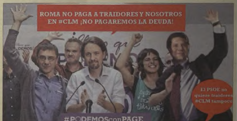
Imagen que ha dado la vuelta por las redes sociales tras salir a la luz la reunión secreta de Page.