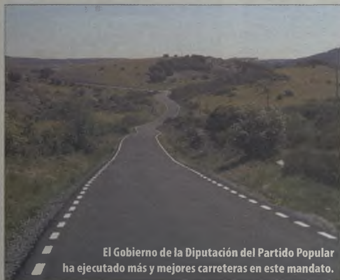
El Gobierno de la Diputación del Partido Popular ha ejecutado más y mejores carreteras en este mandato.