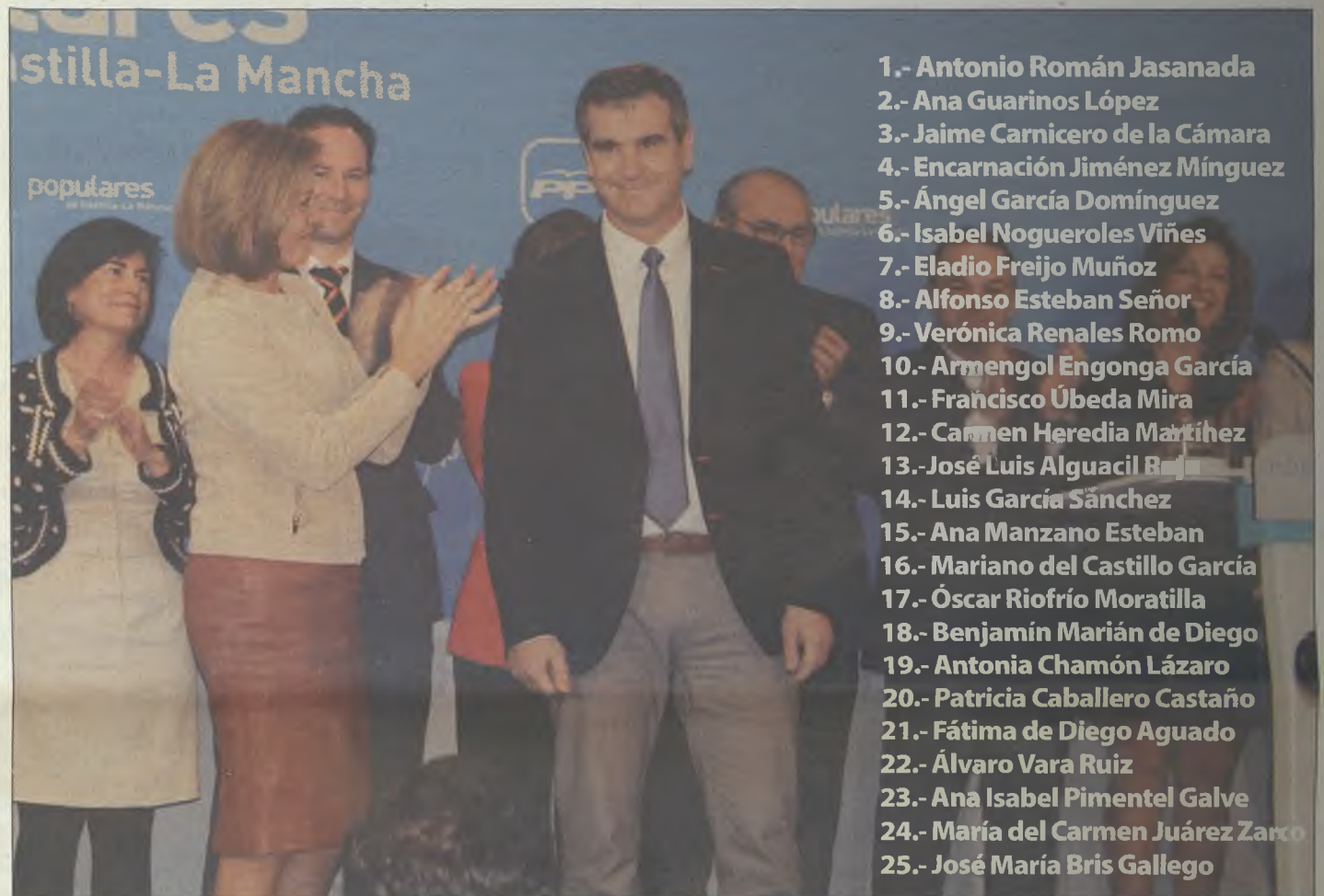
Cospedal destacó de Román su vocación de servicio a los demás, su honestidad y su sentido de la responsabilidad.

convicción de que el 24 de mayo volverá a obtener el respaldo suficiente para gobernar, ha repasado los logros más destacados obtenidos en sus años de gobierno en diferentes ámbitos: el económico, el social y el deportivo, entre ellos.