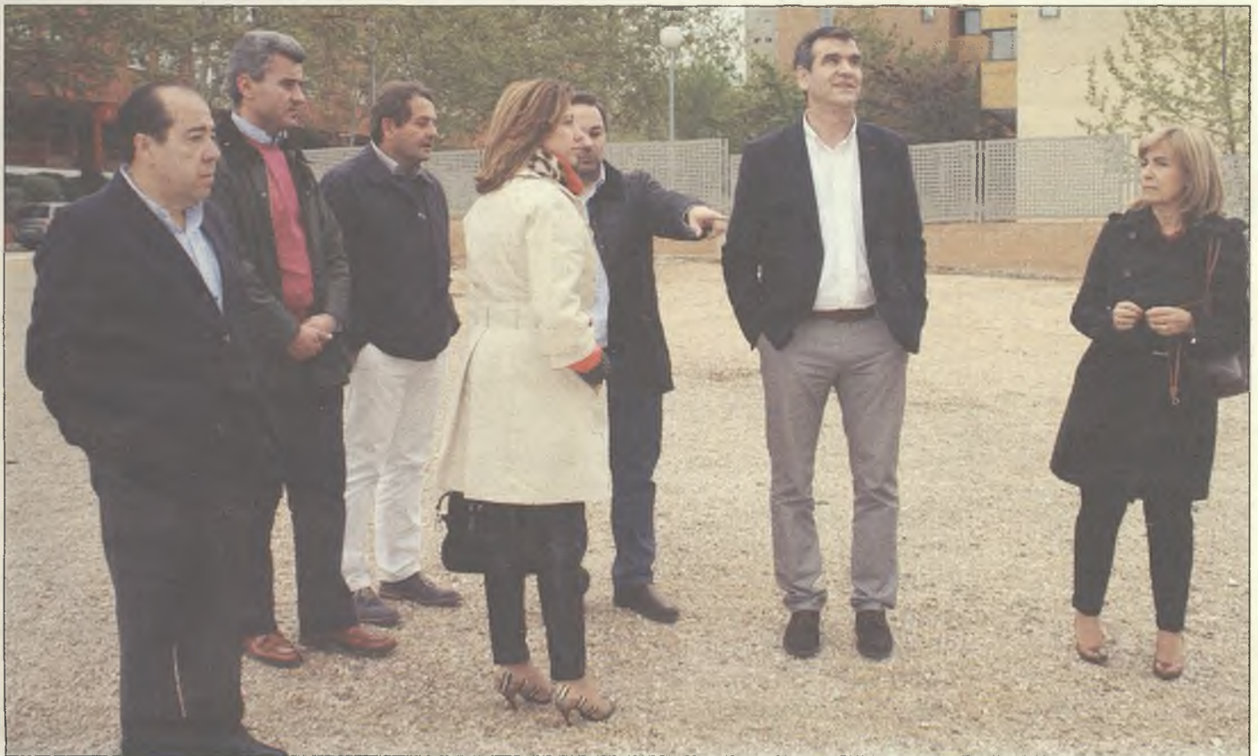
El candidato anunció la creación de una nueva zona estancial y de juegos demandada por los vecinos.

Su puesta en marcha ha permitido transformar espacios como el recién inaugurado parque de Las Torres, las escaleras de acceso desde la avenida del Atance a la calle Redondel o del final de la calle Francisco Arizmendi, la mejora de la zona estancial del Paseo de Alaminillas, así como las mejoras de las zonas verdes en la avenida del