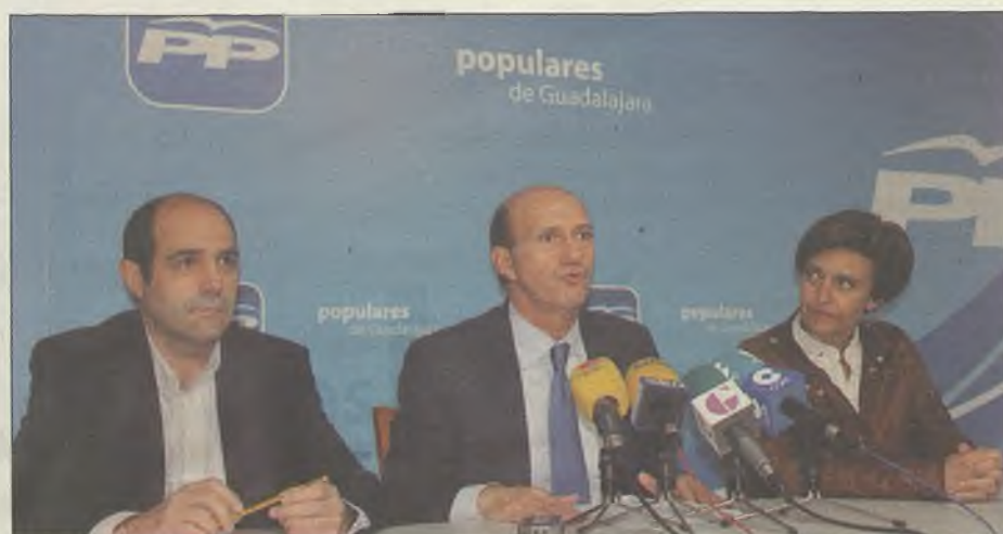
El secretario general (c) junto a la coordinadora de Campaña Electoral y el coordinador de Acción Electoral.

Está comprobado que el Partido Popular tiene el aval de haber sabido gestionar en los momentos más difíciles y duros para Castilla-La Mancha frente a otras formaciones políticas para las que el Partido Popular advierte que "una cosa es hablar en los platós de televisión y otra, muy diferente, gobernar". Esos partidos políticos que están apareciendo "solo pueden ofrecernos palabras pero no resultados ni avales de una gestión porque nunca han gestionado".