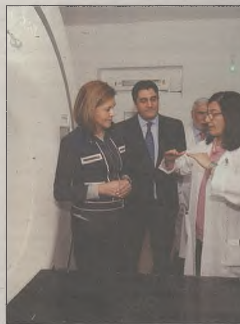
Cospedal ha puesto al día la Sanidad de la región, con más y mejores medios.

El Gobierno de Cospedal da respuesta a las necesidades asistenciales, atendiendo a poblaciones que suman más de 34.000 habitantes