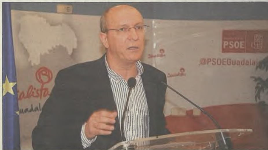
El senador socialista, Jesús Alique, no dirige las culpas de la falta de ejecución del proyecto de conexión Sorbe-Bornova al Gobierno de Zapatero

El proyecto para la conexión de las reservas del río Sorbe y el Bornova se quedó en un cajón. Y allí ha permanecido