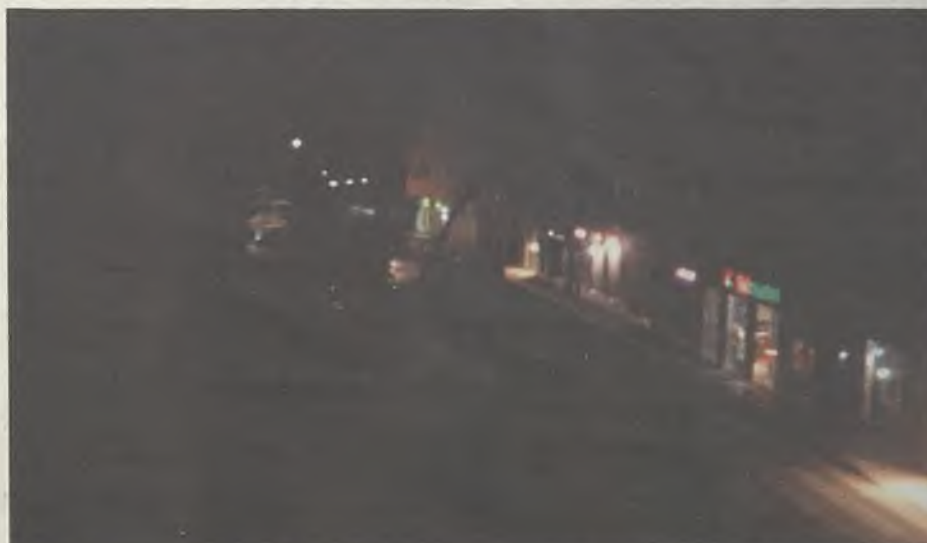
El socialista Pablo Bellido deja un balance de gestión con más sombras que luces.

Desde el Grupo Popular se han hecho eco en varias ocasiones de la decep-