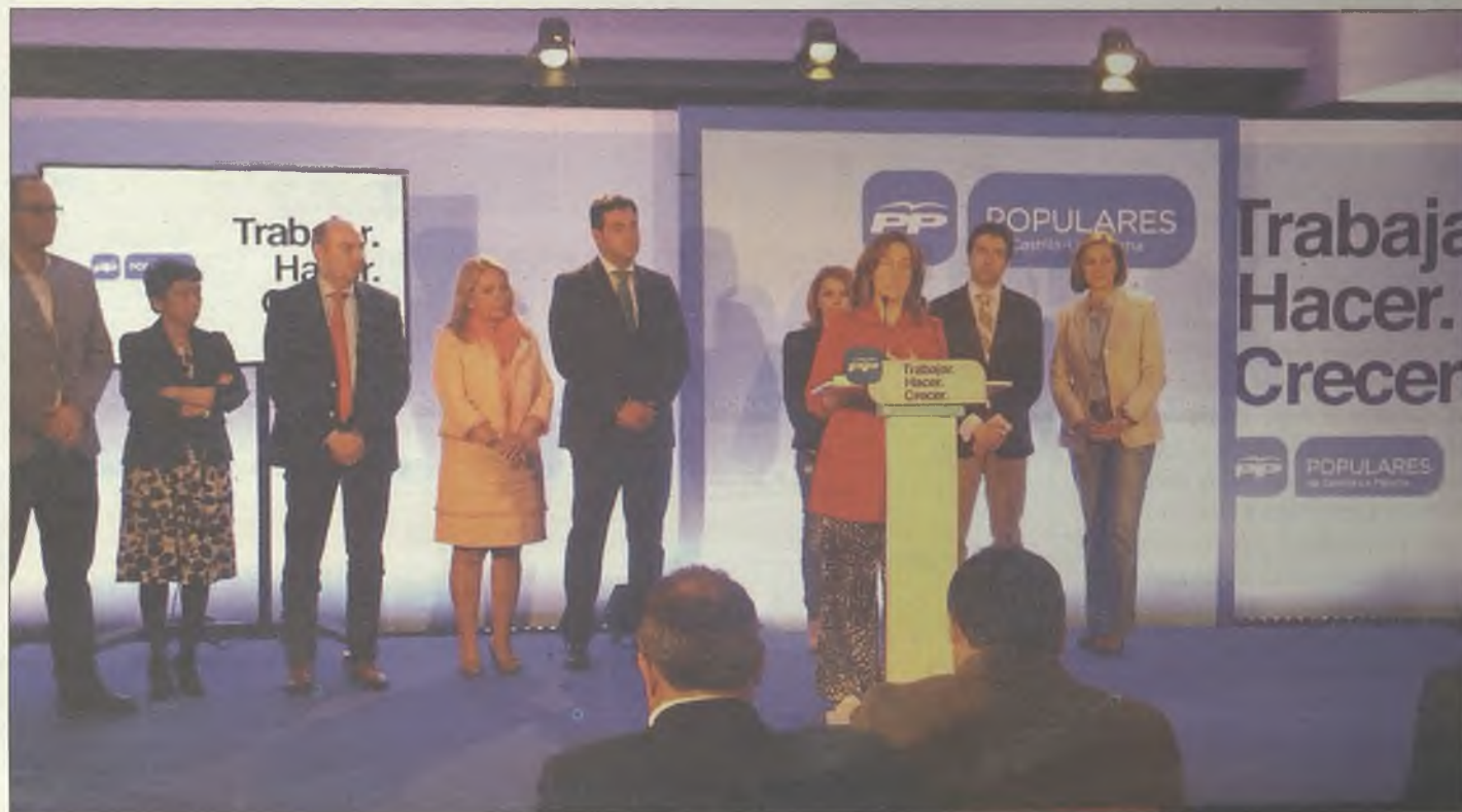
Guarinos interviene en presencia de la presidenta Cospedal y del resto de personas que forman la candidatura regional por Guadalajara.

Por ello, Cospedal ha afirmado que “no todos somos iguales” porque “hay algunos que solo representan los grandes pactos contra el PP, contra la recuperación de España y contra la creación de empleo”. Y ha criticado a “los que ahora niegan la recuperación, igual que antes negaron la crisis”. “No estuvieron cuando les correspondía estar, cuando dejaron la sanidad en quiebra con 16.000 millones de deuda”, ha criticado. Con respecto a la candidatura autonómica, Cospedal ha asegurado que las personas que la integran “estamos orgullosos y emocionados por representar a nuestra tierra y estamos dispuestos a luchar por Castilla-La Mancha y España”. En este sentido, la número 1 por Guadalajara, Ana Guarinos, ha afirmado que “Castilla-La Mancha necesita un proyecto estable como el PP y una presidenta responsable como María Dolores Cospedal”. “No