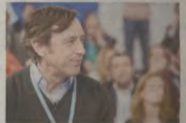
Rafael Hernando, portavoz del PP.

E l guadalajareño Rafael Hernando se ha convertido en el nuevo portavoz del Grupo Popular en el Congreso de los Diputados, sustituyendo a Alfonso Alonso, quien dejara el cargo para ser ministro de Sanidad. ▶ PÁGINA 6