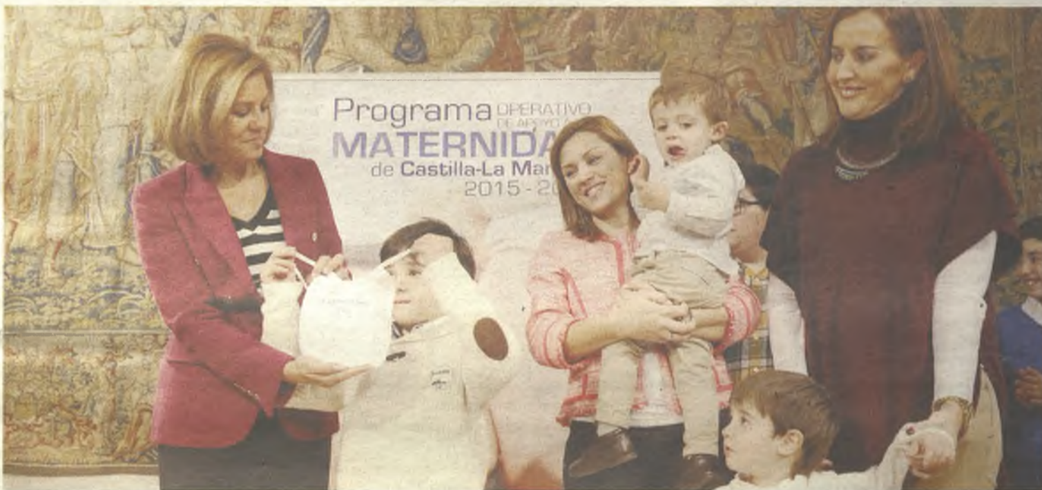
María Dolores Cospedal, junto a madres e hijos, durante la presentación del Programa de Apoyo a la Maternidad.

L a presidenta de Castilla-La Mancha, María Dolores Cospedal, ha destinado un presupuesto total de 43 millones de euros a