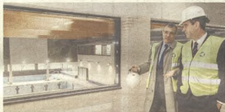
El futuro Centro Acuático de Guadalajara pronto estará operativo.