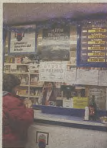
Aquí se vendió el premio.

Dos décimos de un quinto premio vendidos en Marchamalo