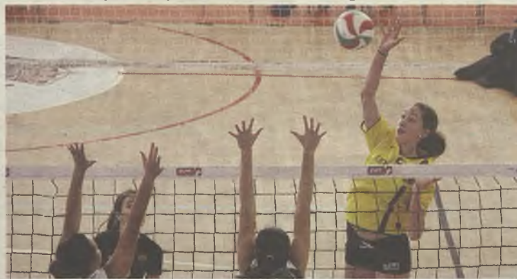
Campeonato de Voleibol solidario en Guadalajara para acabar el año.

Alvar Fáñez y Río Tajo. La Copa de España de Voleibol tiene un carácter solidario, de modo que se donará a Cáritas un kilo de alimento por cada set. ◆