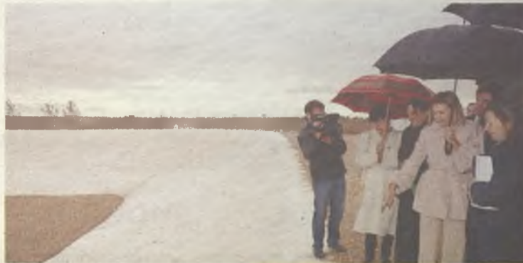
El Tercer Vaso de la Planta de Residuos de Torija ya está en funcionamiento.

La presidenta regional, María Dolores Cospedal, presentó este año medidas como la bajada del IRPF, las ayudas a la dependencia y discapacidad o el reciente Programa Operativo de Apoyo a la Maternidad.