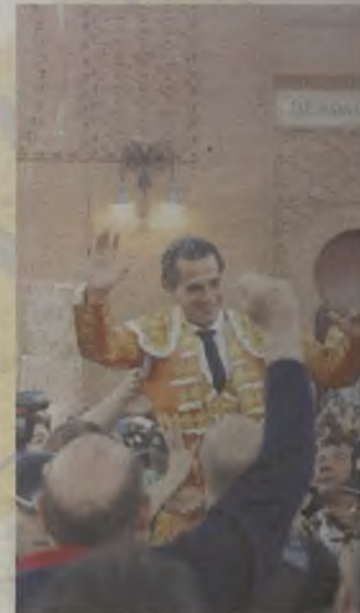
Iván Fandiño saliendo por la puerta grande.

La Diputación de Guadalajara continúa realizando grandes inversiones en toda la provincia, como el esperado Tercer Vaso de la Planta de Residuos de Torija, inaugurado hace unos meses.