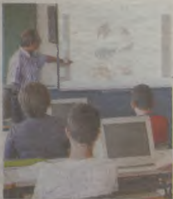
La región busca profesores.

Tal y como ha detallado el director general, de las 330 plazas de la convocatoria, 232 corresponden a los Cuerpos de Profesores de Secundaria, Profesores Técnicos de Formación Profesional, Profesores de Música y Artes escénicas y Profesores de Artes plásticas y Diseño, a las que se unen las 98 plazas correspondientes a la oferta de empleo público de 2014.