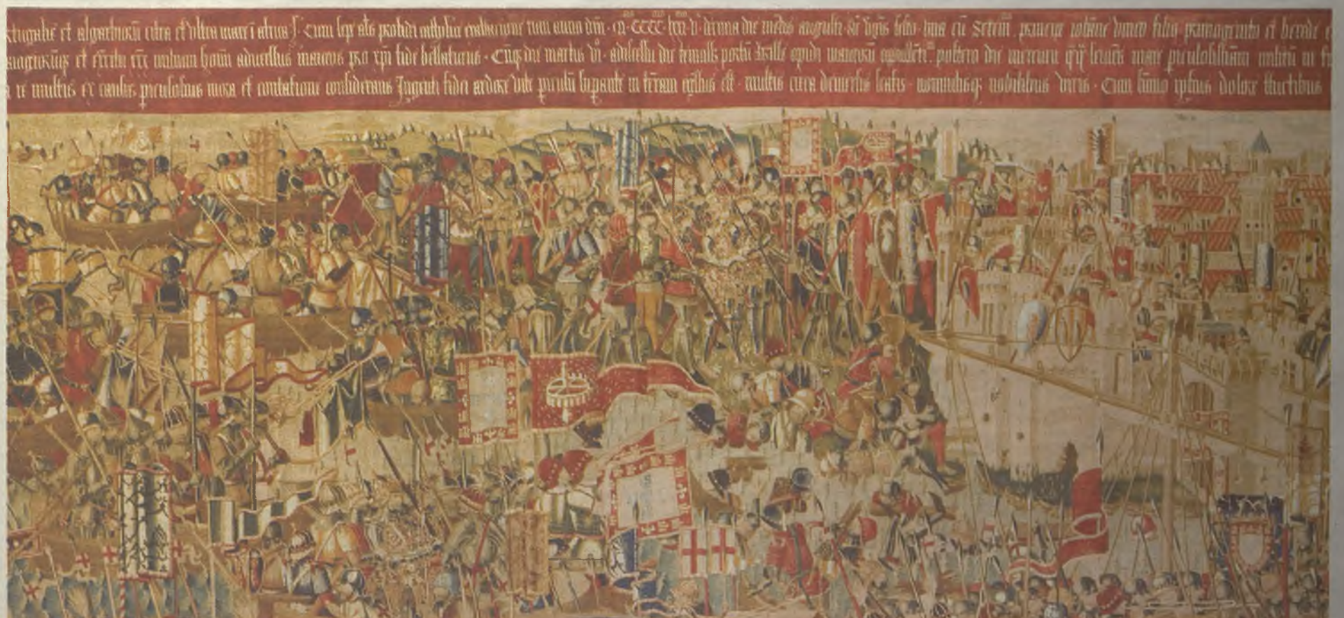
El gran tamaño de estos tapices barrocos flamencos es una de las principales características que los convierten en únicos.

el equivalente en nuestros días, a un reportaje fotográfico; nos describen fantásticas crónicas de guerra, pobladas de personajes, acción y curiosos detalles.