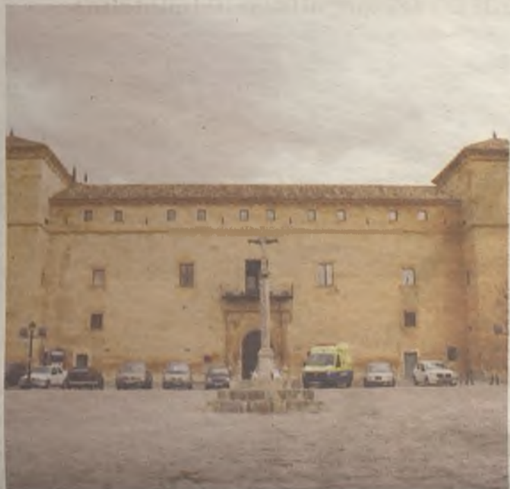
El Palacio Ducal en la Plaza de la Hora, gran emblema arquitectónico de Pastrana.

Pastrana une sus ancestrales tradiciones a su espectacular patrimonio histórico artístico