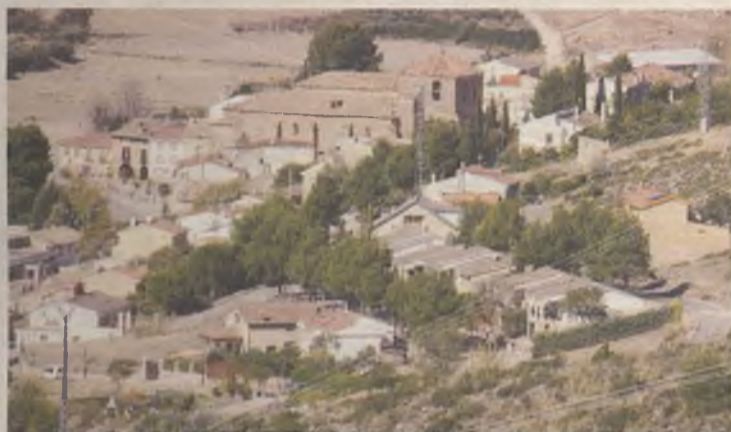
El TSJ confirma que la Diputación actuó bien en la subvención a Albalate.

Por un convenio aprobado de forma precipitada por el equipo de Gobierno de PSOE-IU después de las elecciones