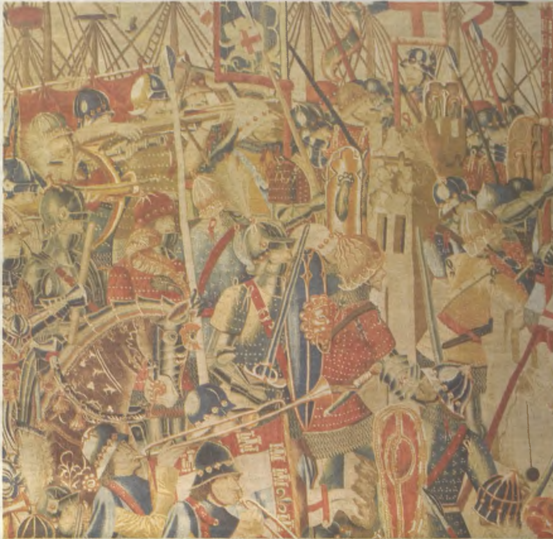
Detalle del tapiz 'El cerco de Arcilla' que se muestra en el Museo de la Colegiata de Pastrana.

Los cinco tapices flamencos expuestos en el Museo Parroquial de la Colegiata de Pastrana, pertenecen a dos series distintas: la serie de cuatro tapices sobre la Conquista de Arcila y Tánger por las tropas de Alfonso V de Portugal - El Desembarco de Arcila, El Cerco de Arcila, El Asalto de Arcila, La Toma de Tánger - y la de dos tapices sobre la toma de Alcázar Seguer, también por Alfonso V -de esta serie se expone de momento un solo tapiz, La Entrada en Alcázar Seguer , puesto que el otro, Cerco de Alcázar Seguer , continúa en fase de restauración.