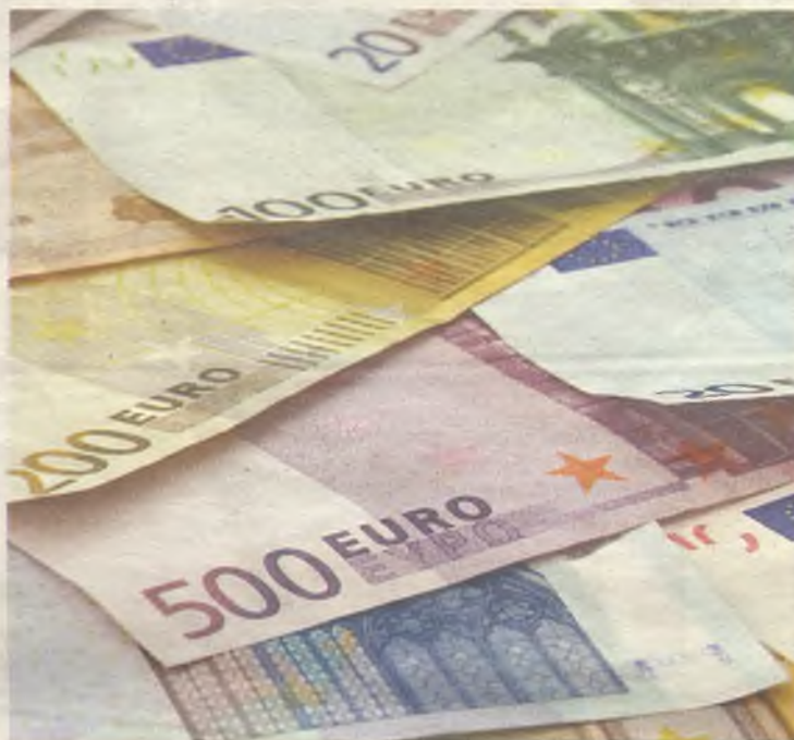
El gobierno empieza a devolver el esfuerzo a los ciudadanos en forma de dinero.

El diputado nacional asegura que los efectos positivos de la reforma también se extenderán a