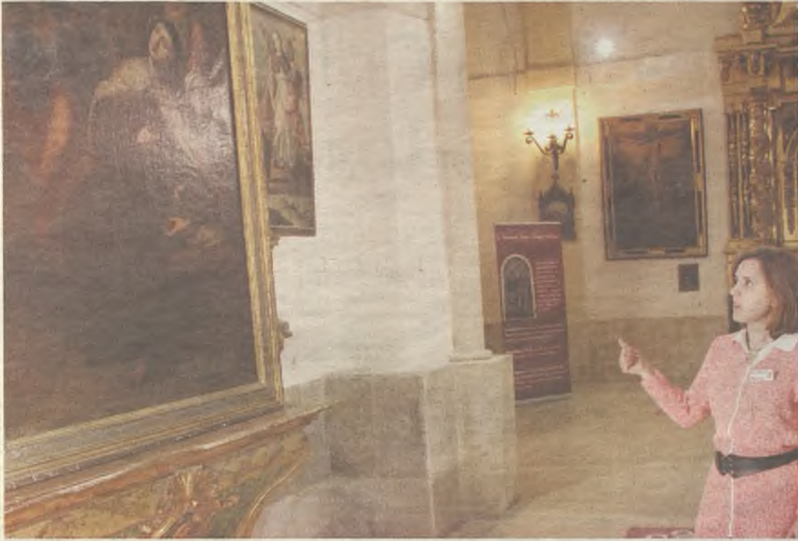
En la muestra se encuentran todo tipo de objetos que recuerdan el paso de Santa Teresa por Pastrana.

La exposición repasa todos los aspectos que engrandecieron la figura de Santa Teresa