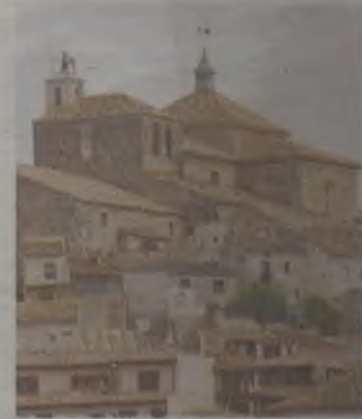
Pastrana, un orgullo para Guadalajara.

Pastrana espera al visitante con todo su patrimonio histórico-artístico como arma turística. Su impresionante Plaza de la Hora, con el Palacio Ducal presidiéndola, compite en protagonismo con la Colegiata y su magnífico Museo de Tapices, albergando la colección de Alfonso V de Portugal. Los conventos del Carmen, San José y San Francisco, las casonas señoriales, las ermitas...; todo el municipio parece diseñado para dejar al turista con la boca abierta. ◆