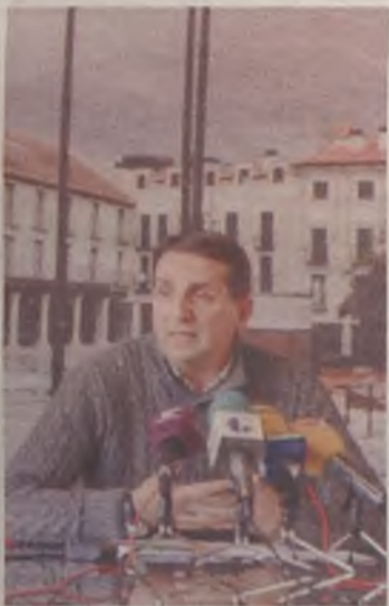
El concejal de deportes hizo balance

Más de un millón de usos, concretamente 1.033.532, han tenido las instalaciones deportivas municipales contando la temporada hasta agosto de 2014. Si a esta cifra, se añaden los usos de los distintos polideportivos de los colegios, los del polideportivo San José o las instalaciones del complejo de Salesianos, la cifra "supera el millón y medio", según el concejal de deportes. Estos da-