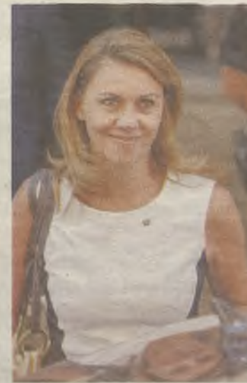
Cospedal sale reforzada.

rara su derecho al honor, a raíz de los papeles sobre la supuesta contabilidad B en el PP.