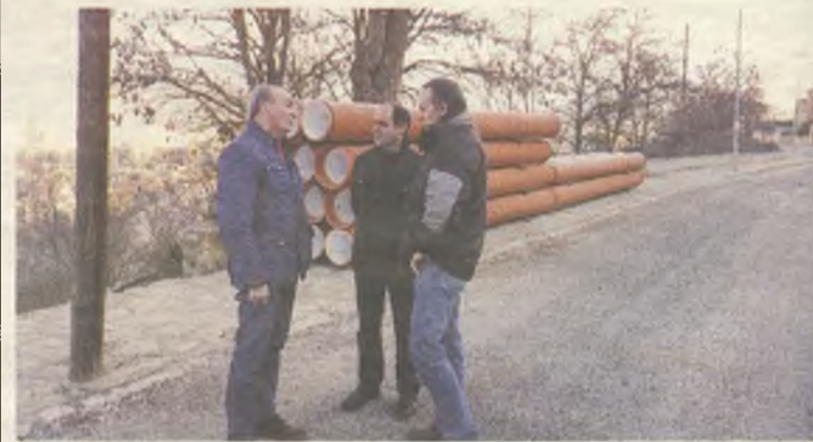
El Diputado de Infraestructuras ha visitado las obras del entorno de Sigüenza.