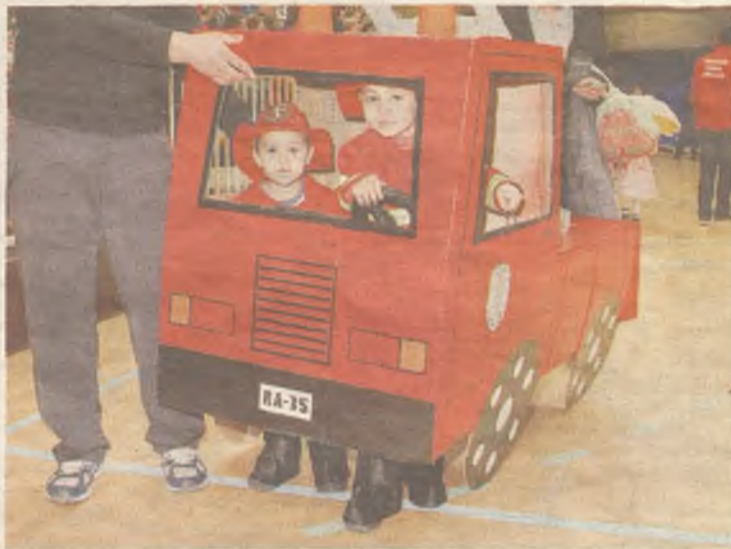
La ciudad de Guadalajara vivirá un Carnaval en el que conviven los disfraces más tradicionales con los más creativos.