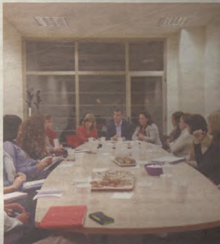
El Equipo de Gobierno ha presentado el plan a las asociaciones de mujeres.