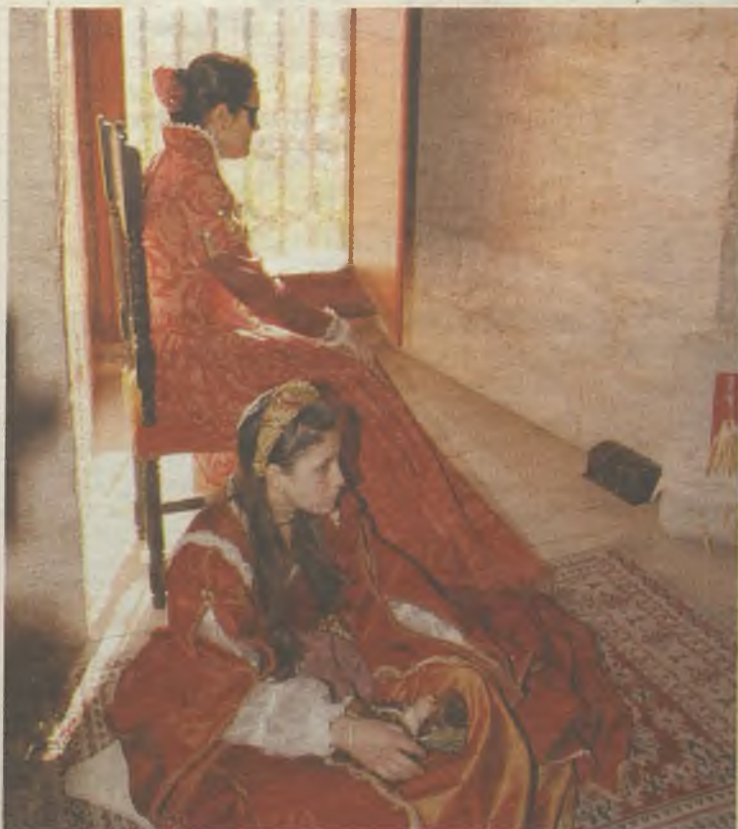
La princesa de Éboli, reducida en su habitación tras su condena.

Antes de terminar la visita, la Asociación muestra el momento en el que Santa Teresa descubre cómo la corte de la princesa lee su libro, y se lo arrebató. El acto final es un resumen de la historia del palacio y sus personajes.