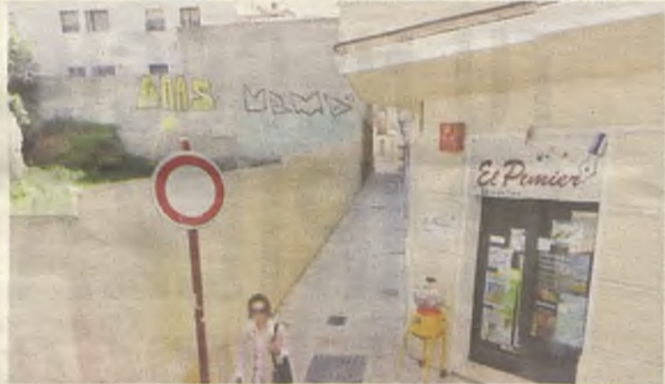
Este es el lugar donde tuvo lugar el crimen juzgado.

Según la sentencia, queda probado el delito de intento de asesinato al entender que se dio el factor sorpresa, algo que no comparte el letrado del condenado. ◆