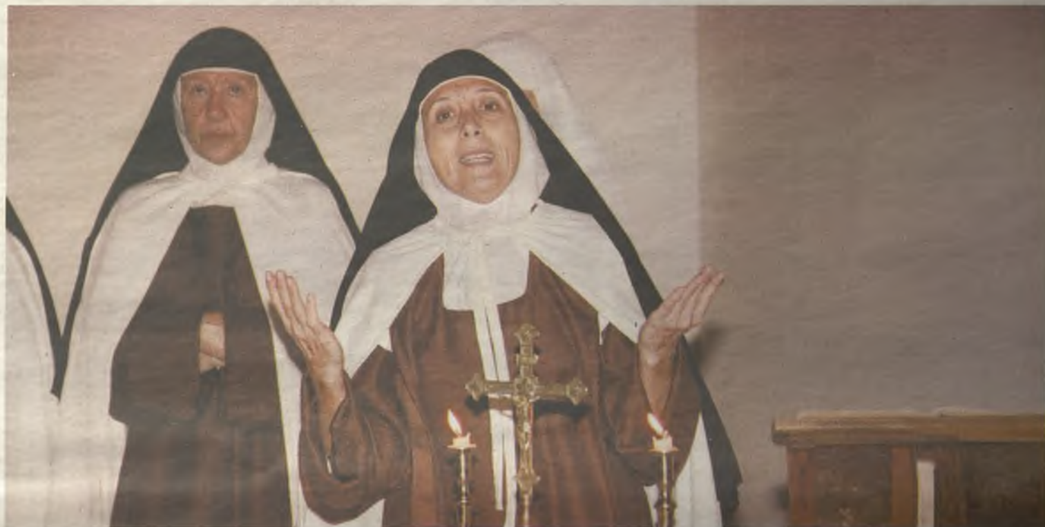
Santa Teresa de Jesús, representada durante su estancia en Pastrana desde el año 1569.

Las visitas teatralizadas tuvieron su origen en el Festival Ducal del año 2013. El éxito cosechado por la Asociación entonces, hizo que se institucionalizara la iniciativa, también como manera de engrandecer aún más los actos del V Centenario del nacimiento de Santa Teresa de Jesús. Los trajes que visten son dignos de ver. Todos están confeccionados a mano