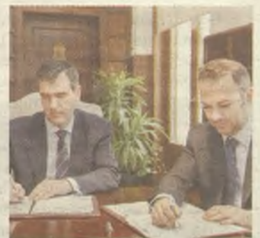
Ayuntamiento y MAS, firman un convenio.

El Ayuntamiento de Guadalajara tiene como plazo máximo para desarrollar y justificar estas obras, hasta el 31 de marzo de 2015. ◆