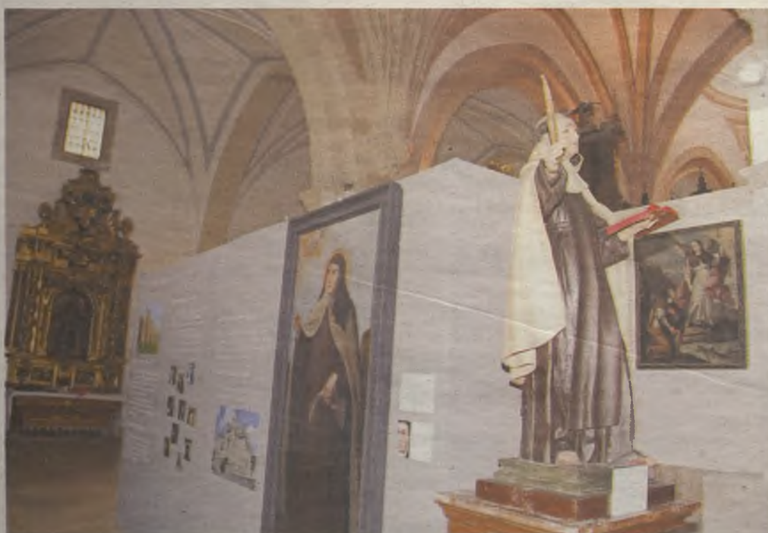
'La mirada de la fe' repasa en la Colegiata de Pastrana el viaje espiritual de la Santa.

En la Tercera huella , la muestra hace alusión a sus diecisiete fundaciones. En Pastrana, en la misma Colegiata, hay una reliquia de Santa Teresa , certificada por la Iglesia por un documento que se llama preci-