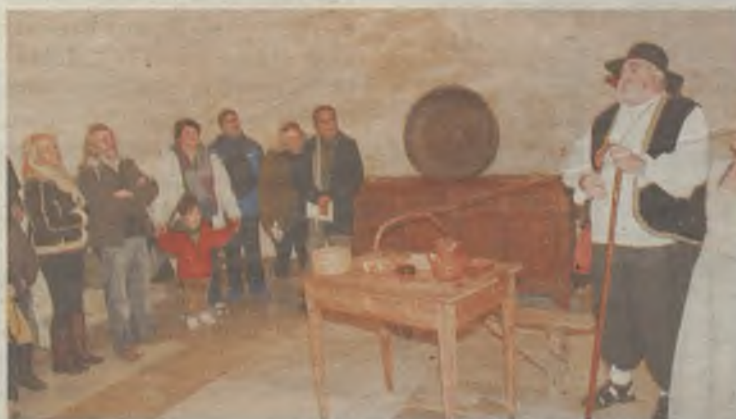
Una de las visitas teatralizadas en el Palacio Ducal.

La influencia de la figura de Santa Teresa de Jesús en la historia de Pastrana fue de gran importancia. Por ello, en la celebración del V Centenario de su nacimiento, son muchos los actos que están teniendo lugar en la localidad alcarreña. Mientras que la Colegiata alberga una intensa exposición sobre sus Huellas, se perfilan los detalles para el futuro Museo del V Centenario en el Convento del Carmen. Además, se puede ver a la abulense 'en vivo' en el Palacio Ducal. ◆