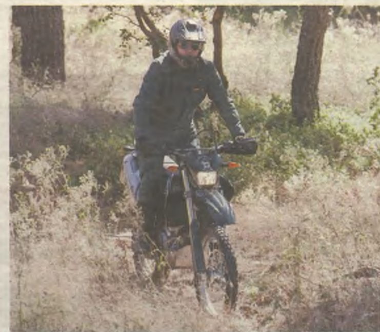
La Guardia Civil ha evitado y esclarecido decenas de robos en nuestros pueblos.

En Guadalajara, las infracciones penales por cada mil habitantes se sitúan en un 36,7 en 2014, reduciéndose un 0,3% con