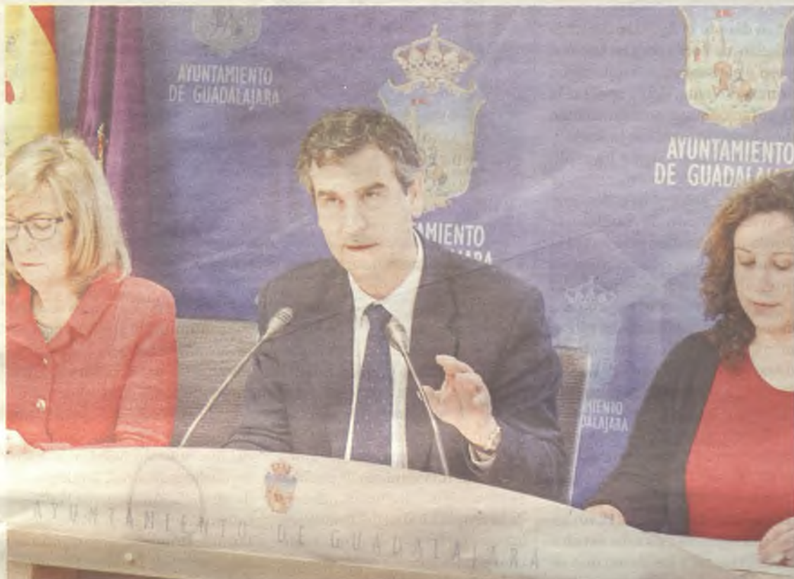
El alcalde junto a la concejalas de Familia y la de Bienestar Social ha presentado el Plan de Apoyo a la Maternidad

El plan se compone de cuatro ejes de actuación, catorce objetivos específicos y veintiuna acciones concretas