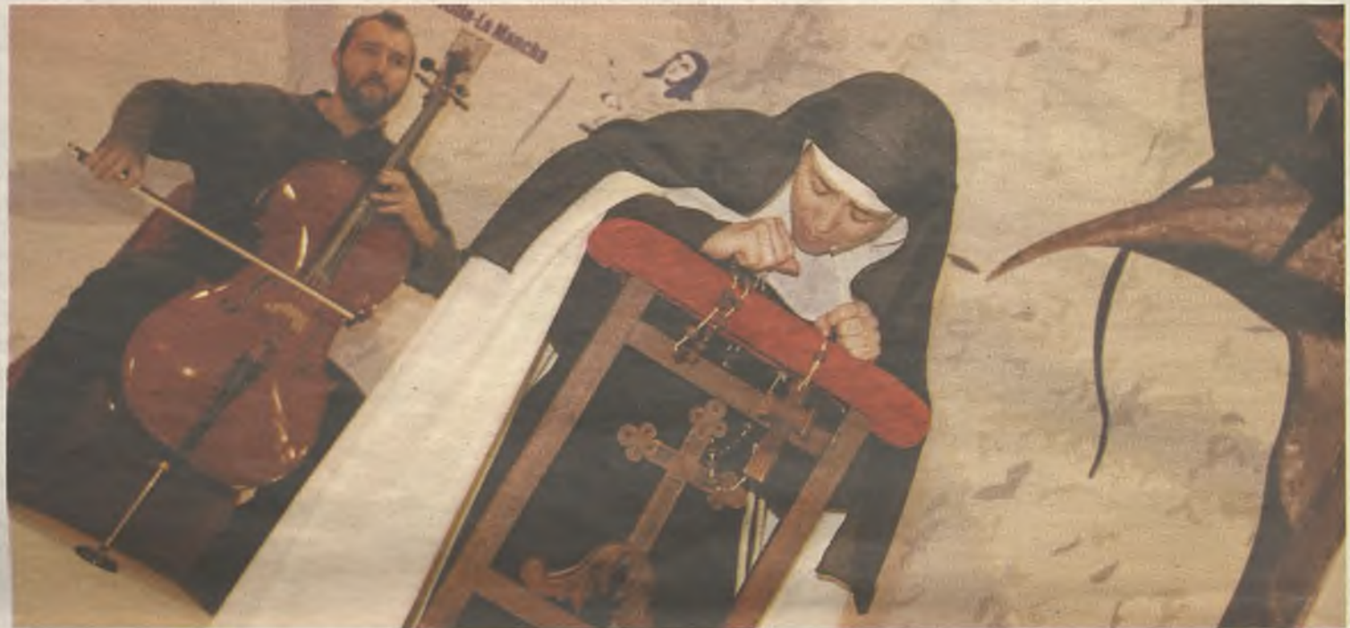
La figura de Santa Teresa será una de las principales protagonistas en 2015 en cuatro localidades castellano-manchegas.

Además de la reliquia de Santa Teresa, Pastrana conserva utensilios que fueron utilizados por la abulense, e incluso una carta suya, que recoge su experiencia espiritual. Y es que la Santa, dejó en la capital de la Alcarria una honda y extraordinaria memoria fundacional. En el verano de 1569, llegó atendiendo una invitación de la Princesa de Éboli. En la villa, fundó a un