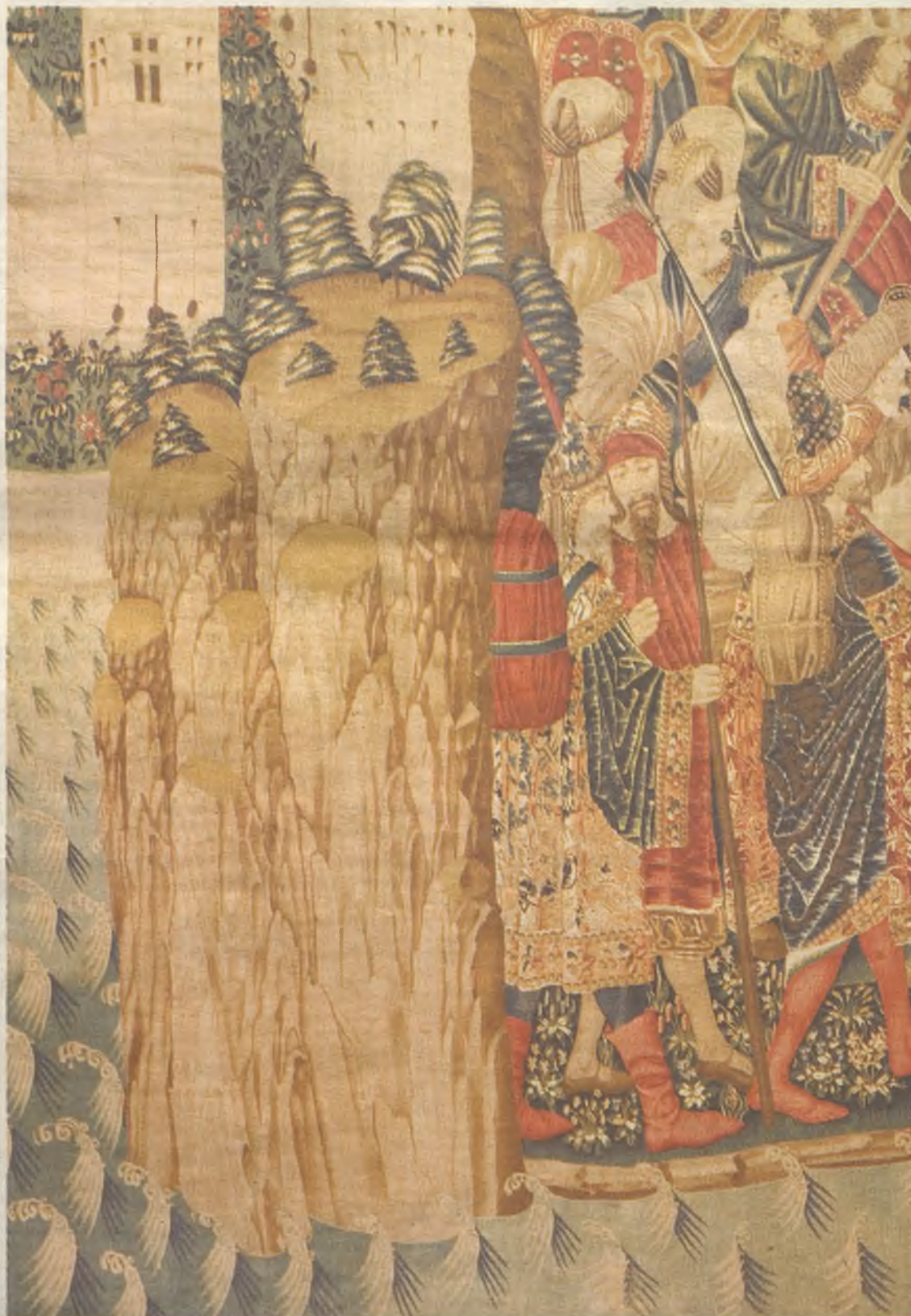
Un detalle del tapiz 'La toma de Tánger', recientemente restaurado.

Restaurados magistralmente por la Fundación Carlos Amberes, los tapices de Pastrana constituyen un ejemplo único dentro de esta disciplina artística y un claro exponente del periodismo de la época, ya que son contemporáneos al rey Alfonso V de Portugal y narran las batallas de la conquista de las plazas del norte de África de