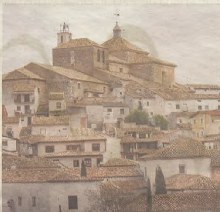
La Colegiata, elevándose sobre el resto de construcciones pastraneras.