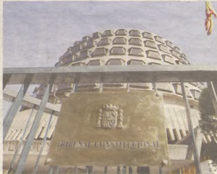
El Tribunal Constitucional ha vuelto a dar la razón al Gobierno Regional.

El portavoz del Gobierno considera que "quien ha ganado con esta sentencia son los ciudadanos y la estabilidad política". Asimismo, ha pedido a Page y a los socialistas que rectifiquen sus palabras: "Page ha hablado de pucherazo en relación con esta sentencia y esto es atentar contra el TC. Por tanto, los que