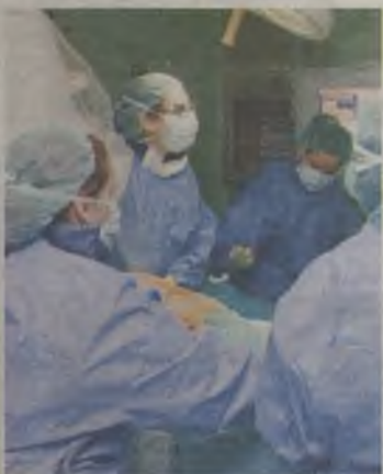
Éxito de los profesionales sanitarios.

1.900 pacientes quirúrgicos menos desde mediados del 2011