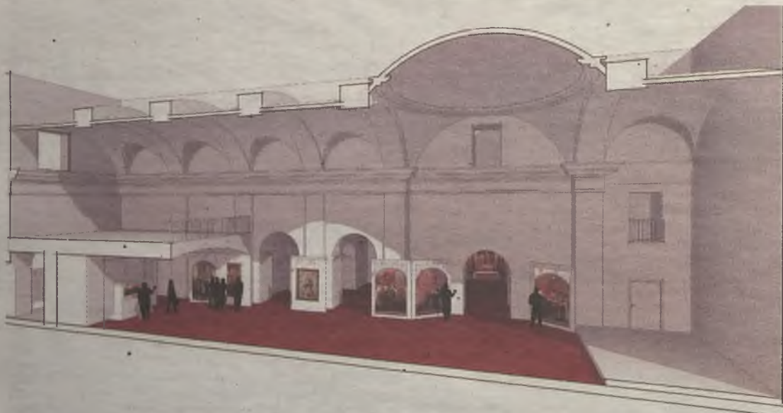
Esta futura infraestructura es una apuesta clara por el futuro turístico de Pastrana.

Por último , la musealización del conjunto lo dotará de modernos paneles expositivos y un sistema audiovisual que ubicará al visitante en el contexto histórico del lugar y le permitirá conocer en profundidad las fundaciones de Santa Teresa en Pastrana. ◆