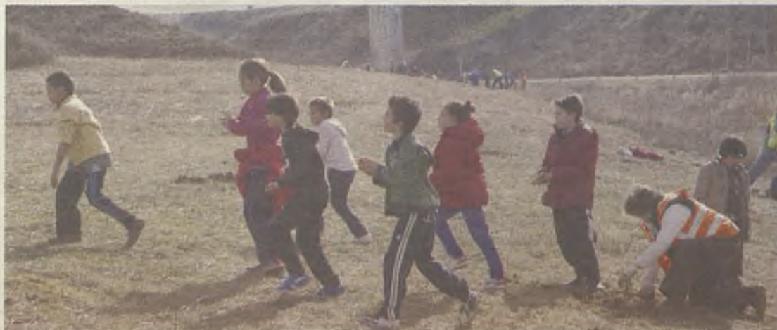
El Barranco de las Monjas cuenta ya con 800 nuevos árboles.

Concejalía de Parques y Jardines, contó con la colaboración de WWF y la Asociación de Jardicultura, quien donó los 800 quercus que fueron plantados.