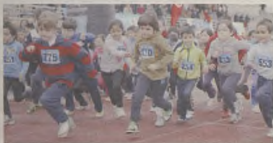
Nueva carrera solidaria por Níger/E.B.

El 30 de marzo tendrá lugar la sexta edición de la Carrera del Agua Gotas para Níger, organizada por la Mancomunidad de Aguas del Sorbe, Unicef y el Ayuntamiento de Guadalajara. Como cada año, todo lo que se recaude con la venta de dorsales irá destinado a un proyecto en el país africano para acercar el agua a la población. En la edición del año pasado, fueron alrededor de 700 las personas que participaron en la prueba.