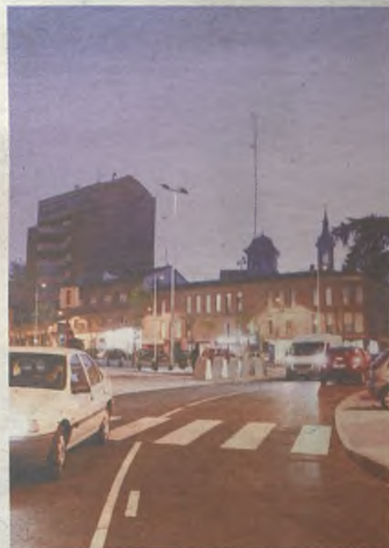
Prolongación de Pedro Pascual.

Las calles Cuesta de Calderón y Travesía de San Miguel han cambiado de sentido de la circulación, pasando ahora a ser ascendentes, para mejorar así la comunicación entre el entorno de la Diputación Provincial, el Eje Cultural y la plaza de Bejanque. También se ha abierto al tráfico la prolongación de Pedro Pascual.