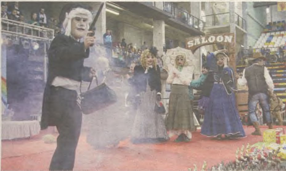
Uno de los grupos ganadores.

Multiusos, donde se concentraron cientos de personas. Por su parte, los pensionistas y jubilados también tuvieron su concurso, el lunes en el Centro Social de la calle Cifuentes. La quema de la sardina en el parque de la Concordia, durante el Miércoles de Ceniza, cerró el programa de actos.