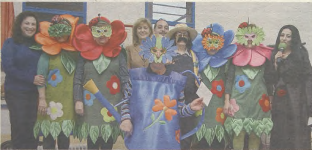
Concurso de disfraces de pensionistas y jubilados.