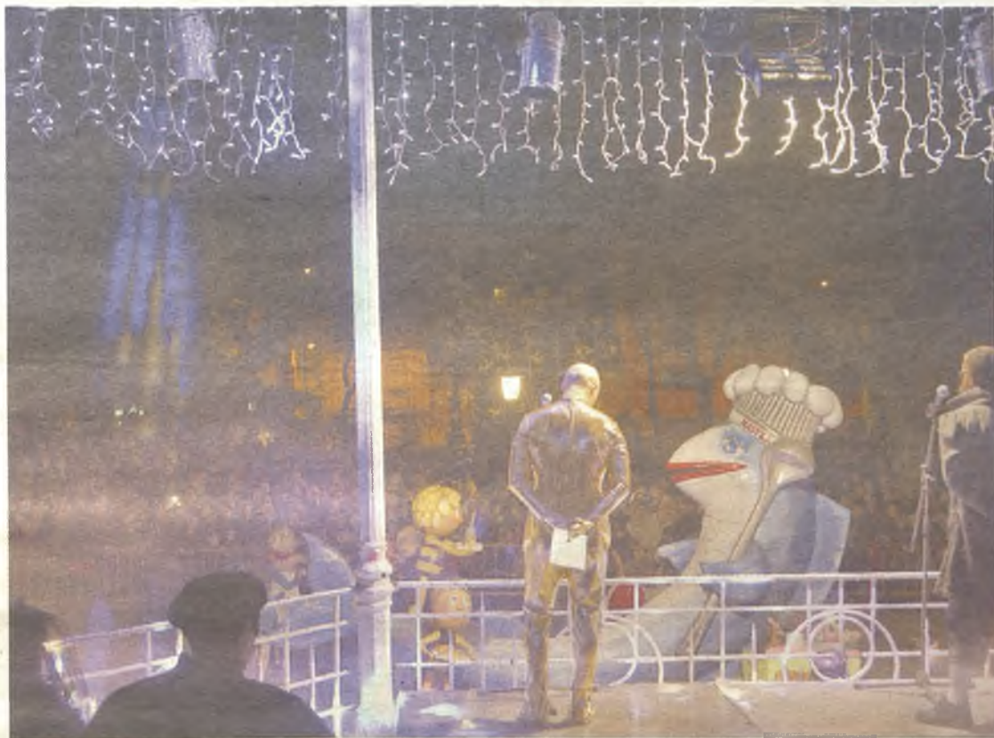
El Parque de la Concordia volvió a ser el lugar elegido para la quema de la sardina.