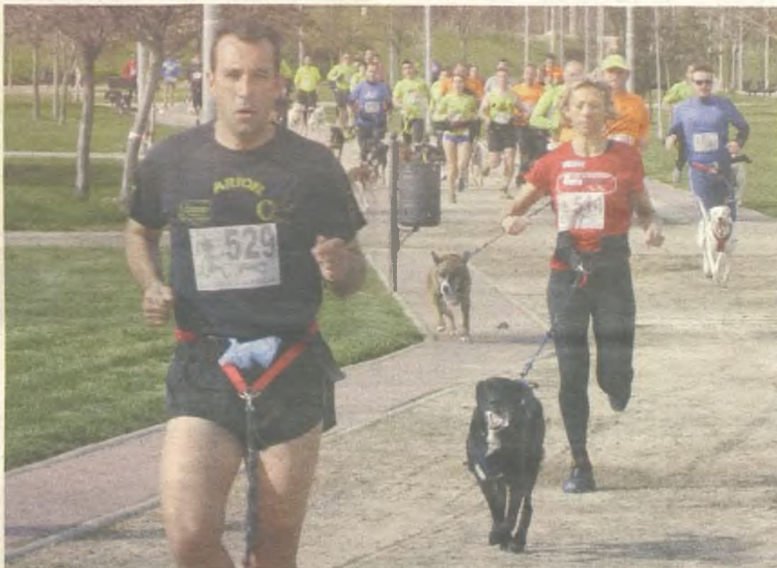
El canicross está cada vez más extendido en Guadalajara.

De esta manera, a Guadalajara acudirán algunos de los deportistas más destacados de esta disciplina. Así, en total, los organizadores esperan que participen alrededor de 200 personas, lo que supondría un hito a nivel nacional para este joven deporte.