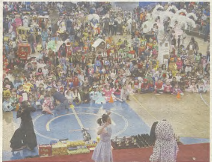
Concursos de disfraces adulto e infantil.