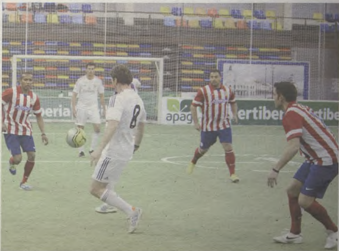
Veteranos del Real Madrid y el Atleti disputaron un entretenido encuentro.

Apenas unos minutos fueron suficientes para que la pista central del multiusos pasara de ser de fútbol indoor a ser de balonmano. Como colofón comenzaba el intenso encuentro que enfrentó al Balonmano Guadalajara y al Cuenca Ciudad Encantada. Un último derbi que concluyó con un empate a 22.