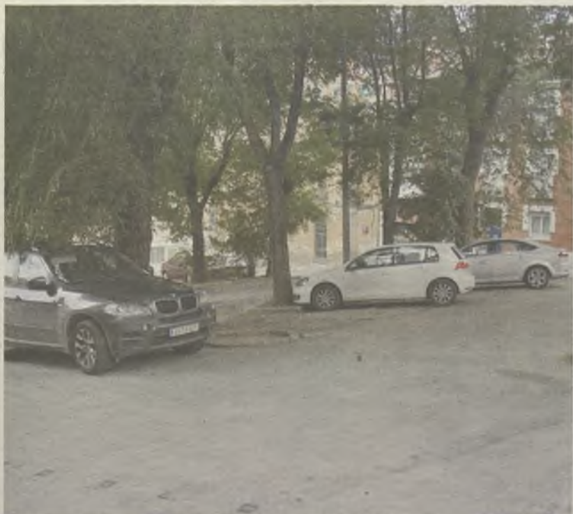
La Plaza de Dávalos pronto será remodelada.