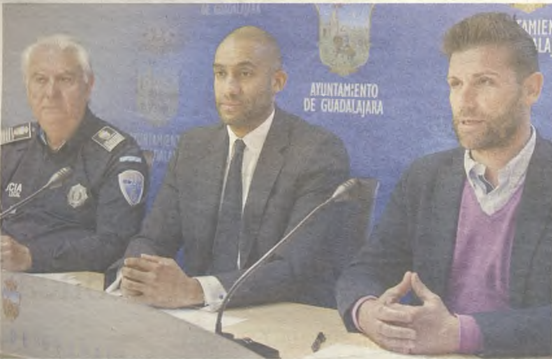
La Policía Local se está formando en mediación.

A través de este procedimiento será posible resolver de un modo rápido problemas de convivencia tales como los derivados de las molestias provocadas por animales, ruidos en vecindades, uso de zonas comunes para fines no definidos o incidentes de tráfico, entre muchos otros.