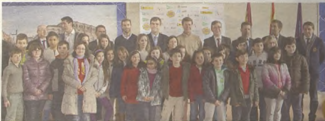
Los niños de la ciudad aprenderán los valores del deporte.