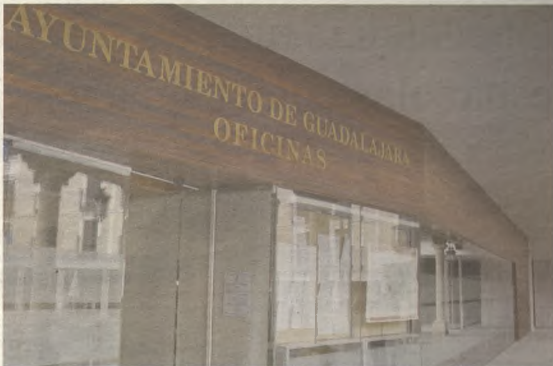
La bajada de los impuestos, la primera desde 1997.

Estas actuaciones son compatibles con la garantía de unos servicios públicos de calidad y con el desarrollo de programas tendentes a la