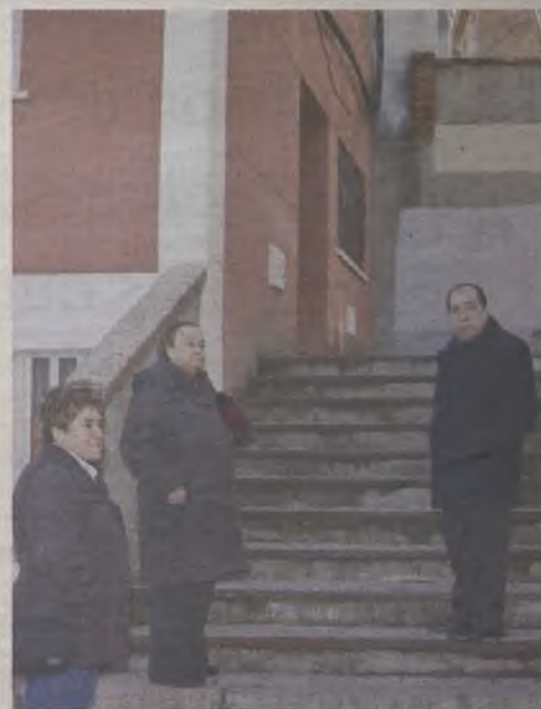
El edil de Servicios Públicos visitó la Era del Canario.

Junto a estas actuaciones, a lo largo del año se acometerán también los habituales trabajos de reparación y mejora de pavimentos de las aceras y de las calzadas de la zona.