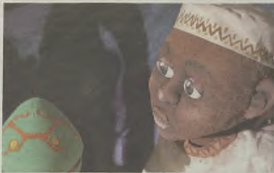
Un momento de la actuación.

La recaudación irá destinada a Cáritas Guadalajara