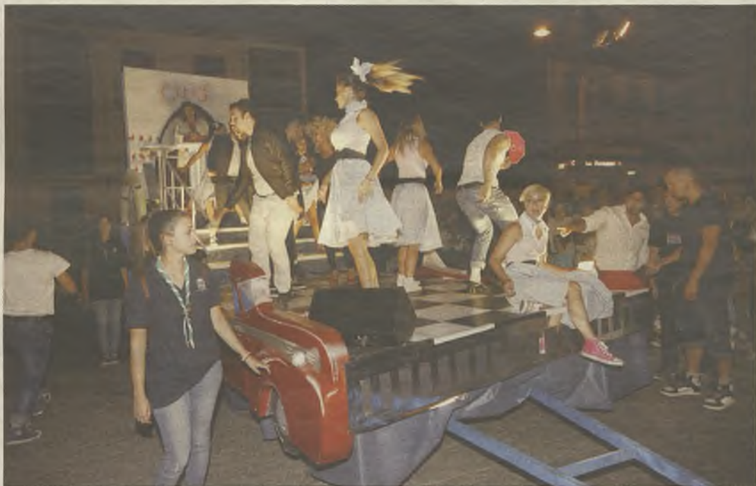
No pudieron faltar los clásicos de la música en la televisión.

Fueron muchas las personas de la ciudad, y también de otras poblaciones cercanas, las que se dieron cita en las calles de Guadalajara para presenciar un desfile lleno de detalles y con una acertada contextualización, que sembró la expectación suficiente para que se espere con entusiasmo el desfile de carrozas del próximo año.