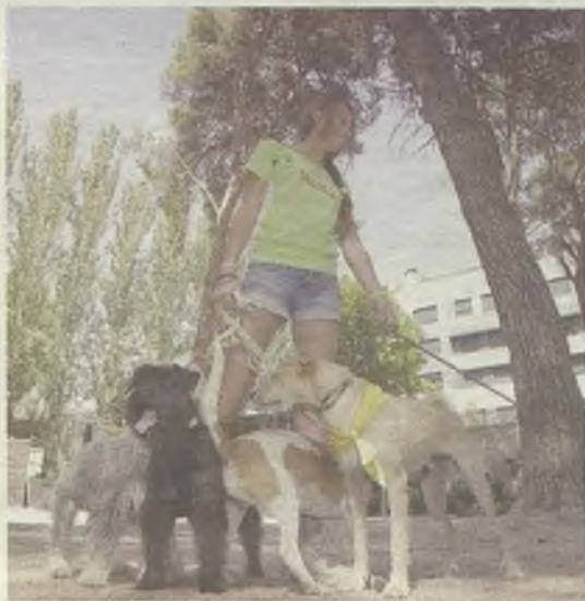
Los niños aprendieron con los perros.

Pudieron conocer de primera mano cómo tratar a los perros y los secretos del canicross