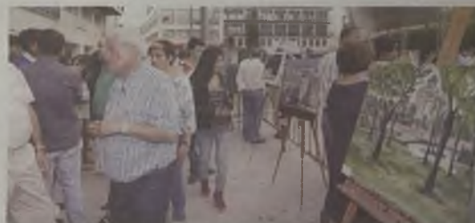
Los artistas inmortalizaron la ciudad.

La compañía Sol y Tierra será la encargada de amenizar la velada con su espectáculo 'Sueños de piedra', en el que unos niños africanos necesitarán la ayuda del público para resolver los fantásticos enigmas que sus sueños les plantean, despertando la solidaridad con los países empobrecidos.