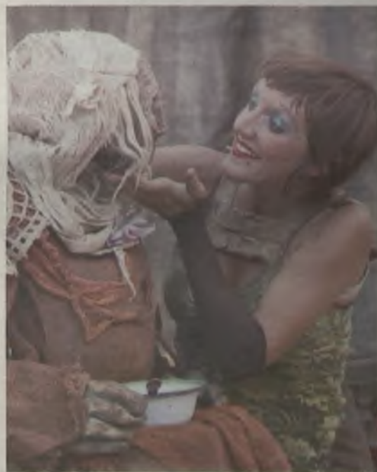
Títeres para los más pequeños./J.R. Velasco.

Domingo 15 de septiembre de 11,00 a 14,30. También en los Jardines del Palacio del Infantado, Plaza de Los Caídos y Plaza del Jardinillo.