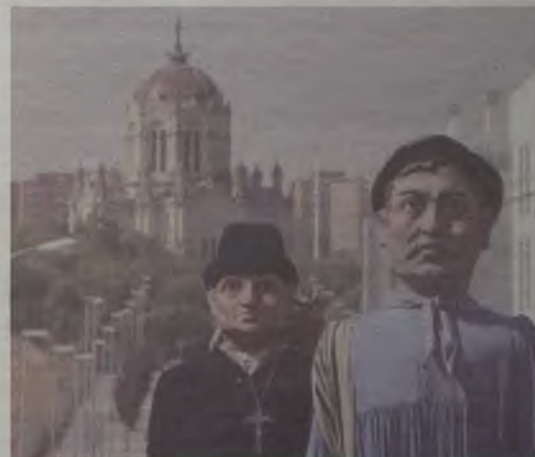
Estos personajes no pueden faltar en Ferias.