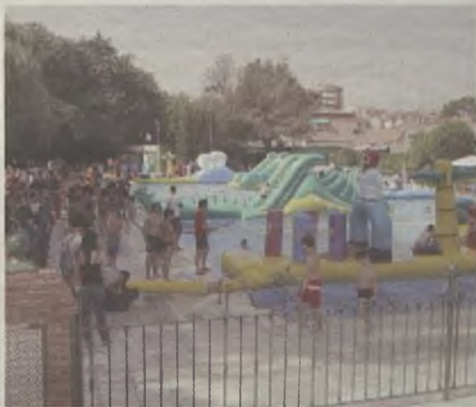
Los pequeños disfrutaron de las atracciones.

De la seguridad de todas estas actividades estuvieron pendientes en todo momento los socorristas de las piscinas, así como miembros de Cruz Roja, Protección Civil o de la empresa Ecoaventura.