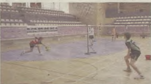
El Badminton, nuevamente protagonista.

La XIX Edición del Torneo de Badminton Ferias y Fiestas de Guadalajara resultó un éxito deportivo y de participantes