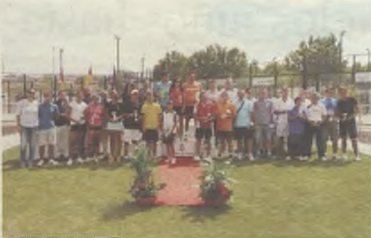
El tenis ha vuelto a ser protagonista.