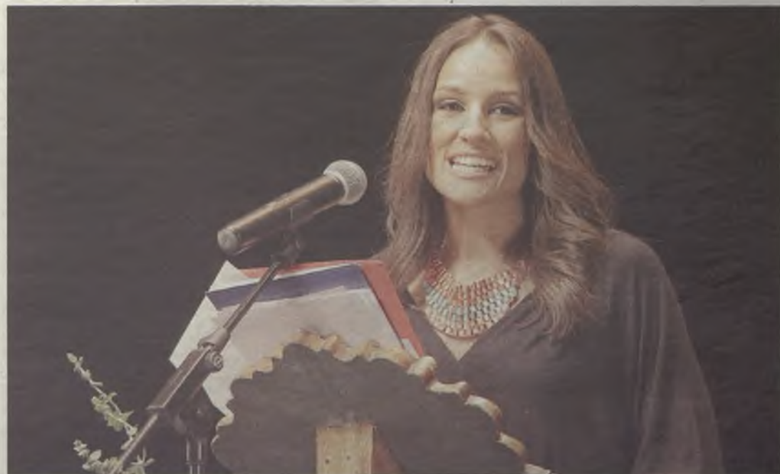
La periodista durante el pregón oficial.

La actuación del Gran Ballet de Rusia fue el encargado de poner el broche de oro al acto.