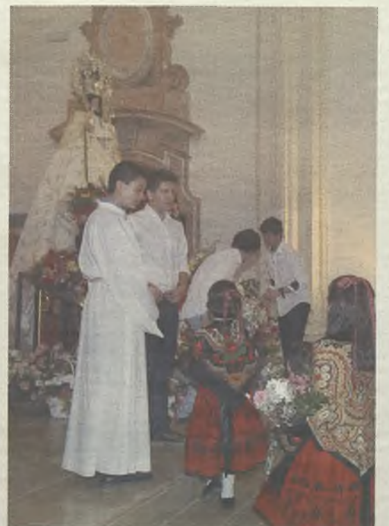
La Virgen recibió las flores de sus fieles./E.B.