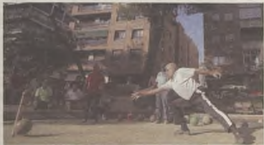
El día 1 estuvo dedicado al deporte rural.

El deporte rural ha tenido protagonismo en las Ferias y Fiestas de 2013. Más de 500 aficionados a los juegos de siempre pudieron disfrutar el domingo 1 de septiembre de diferentes modalidades. La primera prueba fue la de petanca, los ganadores fueron Jesús y Cotilla, Cristino y Jesús y Divi y Gabi. Justo después tuvo lugar la de bolos castellanos con ocho pueblos, Montarrón fue el primer clasificado, seguido de Archina, Utande y Valfermoso.