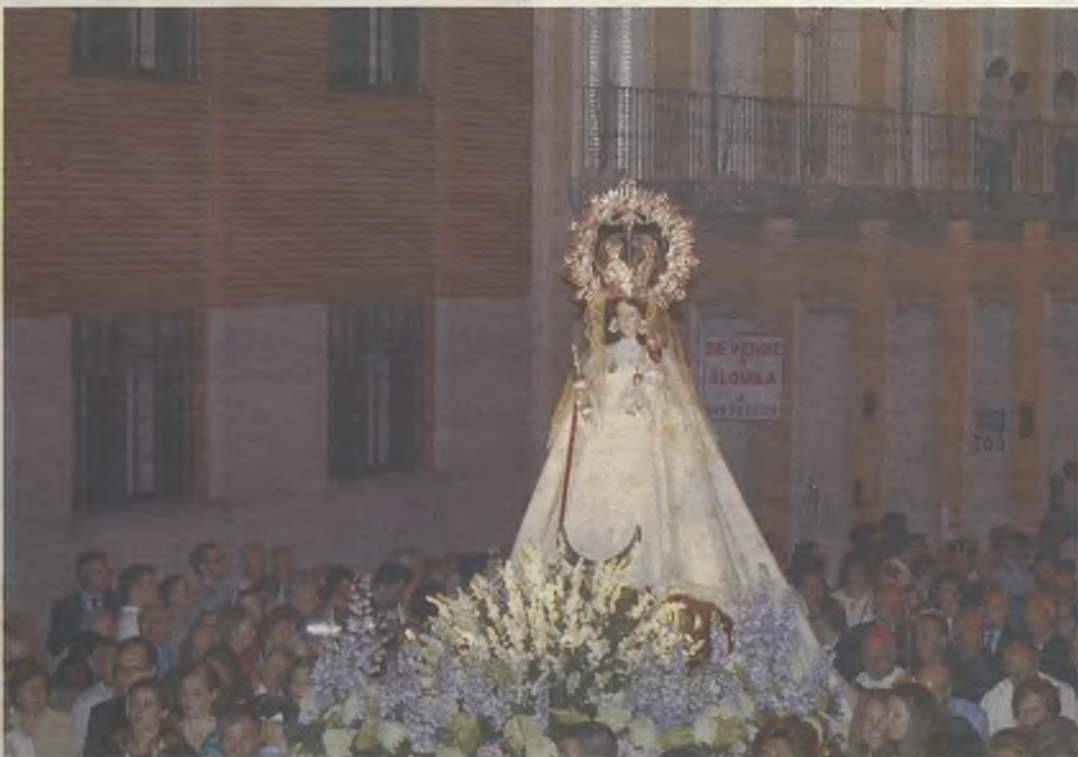
La procesión recorrió algunas de las calles principales de la ciudad.

Todos ellos entregaron bonitos ramos de flores a la Virgen, que sirvieron para confeccionar un hermoso manto. El acto concluyó con la Salve Solemne que ofreció el Orfeón Santa Teresa.