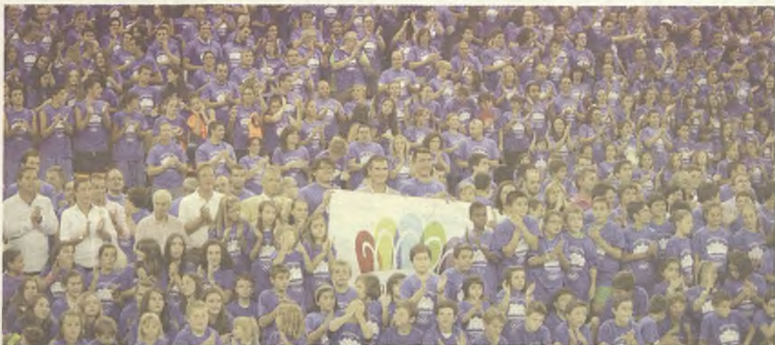
Más de un millar de guadalajareños apoyaron la candidatura de Madrid 2020.ñ

La candidatura olímpica de Madrid tuvo un acto de apoyo en Aguas Vivas con un millar de deportistas de la capital