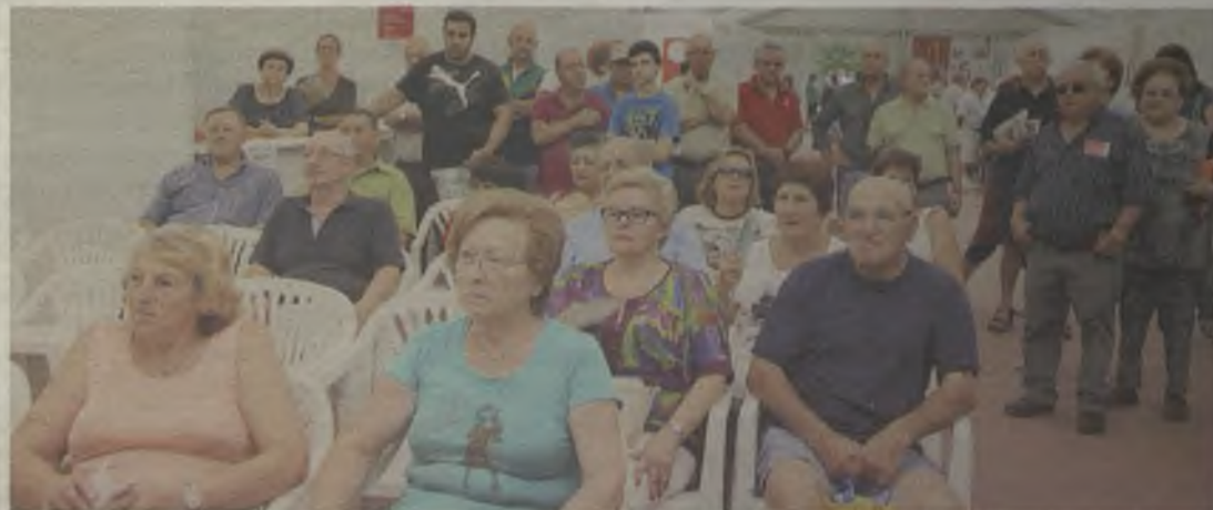
Numeroso público acudió a la carpa.

El sábado se pudieron degustar los famosos Judiones de La Granja, mientras que el domingo fue el momento de las tortillas y la cata de vinos.