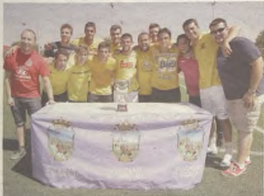
Los integrantes del BO2 con el trofeo.

La peña BO2 se coronó como vencedora del XI Torneo Interpeñas de Fútbol 7, que tuvo lugar en el Jerónimo de la Morena el domingo 1 de septiembre, tras imponerse en la final a la organizadora del evento, La Carioquita. Para ello tuvieron que esperar a la tanda de penaltis.