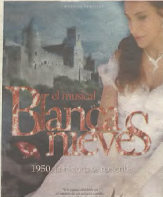
Cartel del espectáculo.