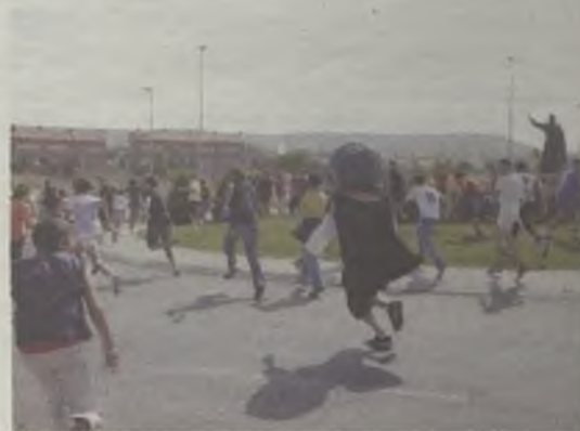
Los cabezudos provocaron más de una carrera.

De nuevo la tradición volvió a las calles de la ciudad con los gigantes y cabezudos. Ayer domingo, en los momentos previos a la misa solemne, pudieron desfilan en un pintoresco pasacalles por el barrio de San Francisco y la colonia Sanz Vázquez. Además, una vez finalizado el acto religioso, realizaron sus particulares bailes en la zona del Fuerte.