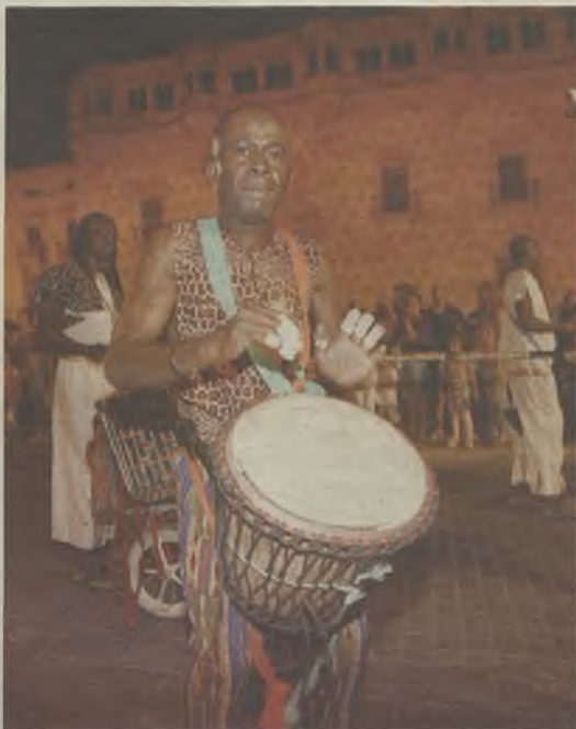
Nos e olvidaron de la música más ancestral.