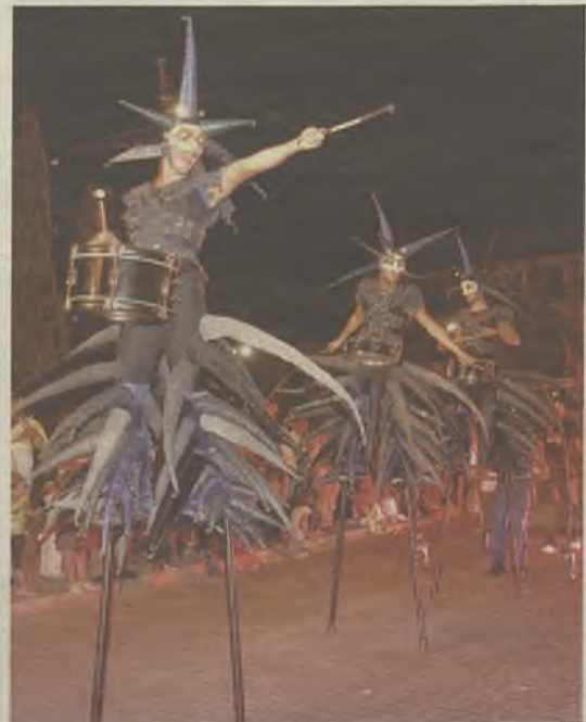
La fantasía también tuvo su lugar.