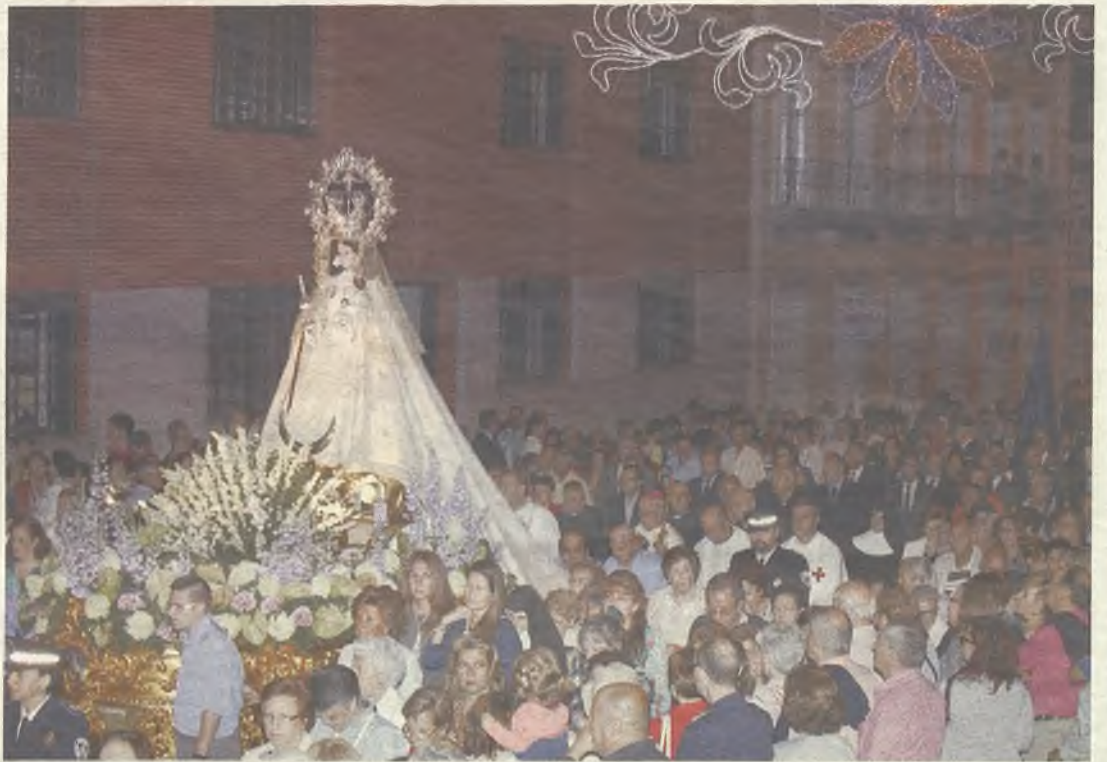
Miles de guadalajareños se echaron a la calle para honrar a su patrona.

Uno de ellos fue la tradicional ofrenda floral que se le hizo a La Antigua en la Iglesia de San Francisco el pasado viernes, 6 de septiembre. Un acto que hizo que el templo rebosara de fieles y que contó con la presencia del Alcalde de Guadalajara y la corporación municipal y miembros de la Hermandad de Nuestra Señora de la Antigua. También participaron la Presidenta de la Diputa-