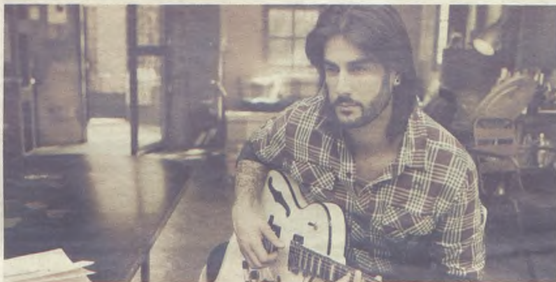
Melendi colgó hace días el cartel de 'no hay billetes'.