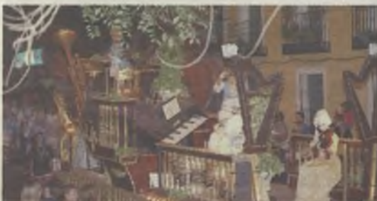
Una de las espectaculares carrozas.

Un año más las Fiestas contaron con su tradicional desfile de carrozas por las calles de la capital. En esta ocasión la Historia de la Música fue la protagonista de un evento que destacó por su espectacularidad. El desfile tuvo que variar su recorrido habitual de los últimos años para evitar las obras del Eje Cultural y resultó un éxito de público. Durante horas la comitiva musical recorrió las calles alcarreñas llenando de magia los primeros días de fiestas.