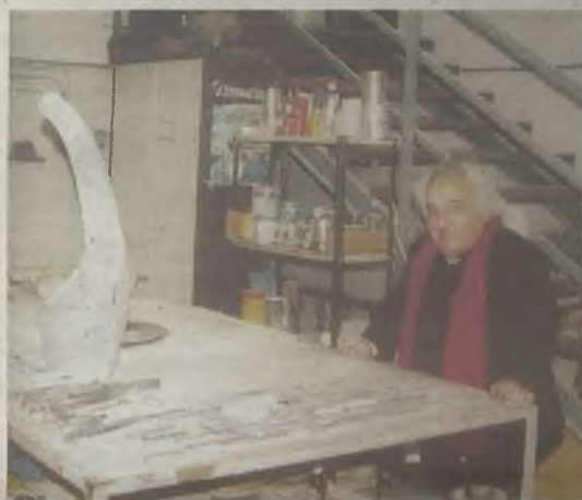
Un repaso a toda la obra de Carrera.

de octubre, en horario de 10.00 a 14.00 y de 16.00 a 19.00 de martes a sábado; de 10.00 a 14.00 horas los domingos y festivos.