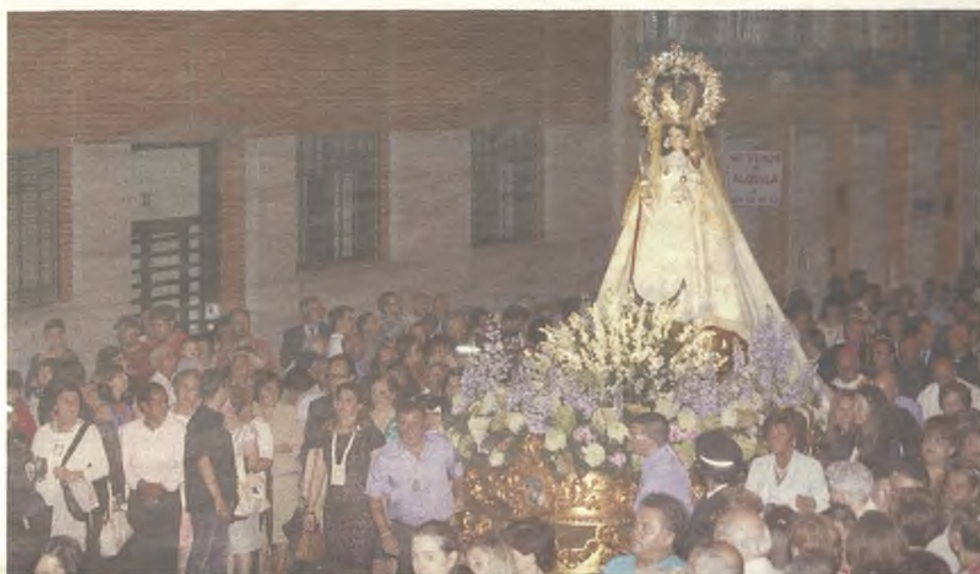
La procesión del día de la patrona llenó las calles de la capital./Eduardo Bonilla