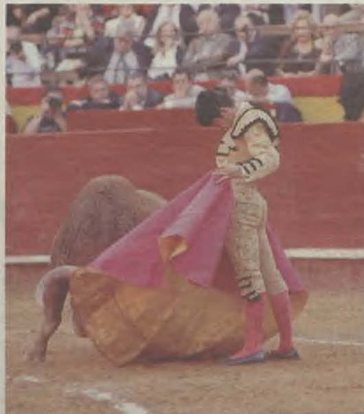
Morante de la Puebla pisará la arena de Las Cruces.

La feria se cerrará el domingo a las 18.00 horas con una corrida de Manolo González cuyas reses también serán corridas en el encierro matinal. La terna la componen Juan Serrano Finito de Córdoba, Manuel Díaz El Cordobés y David Fandila El Fandi. Se trata de un cartel festivo que se espera sea del gusto del aficionado.