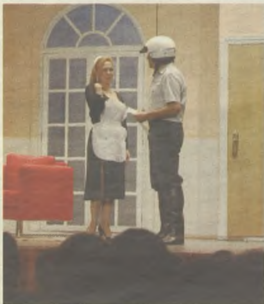
Obras por la Compañía Teatro Benavente.