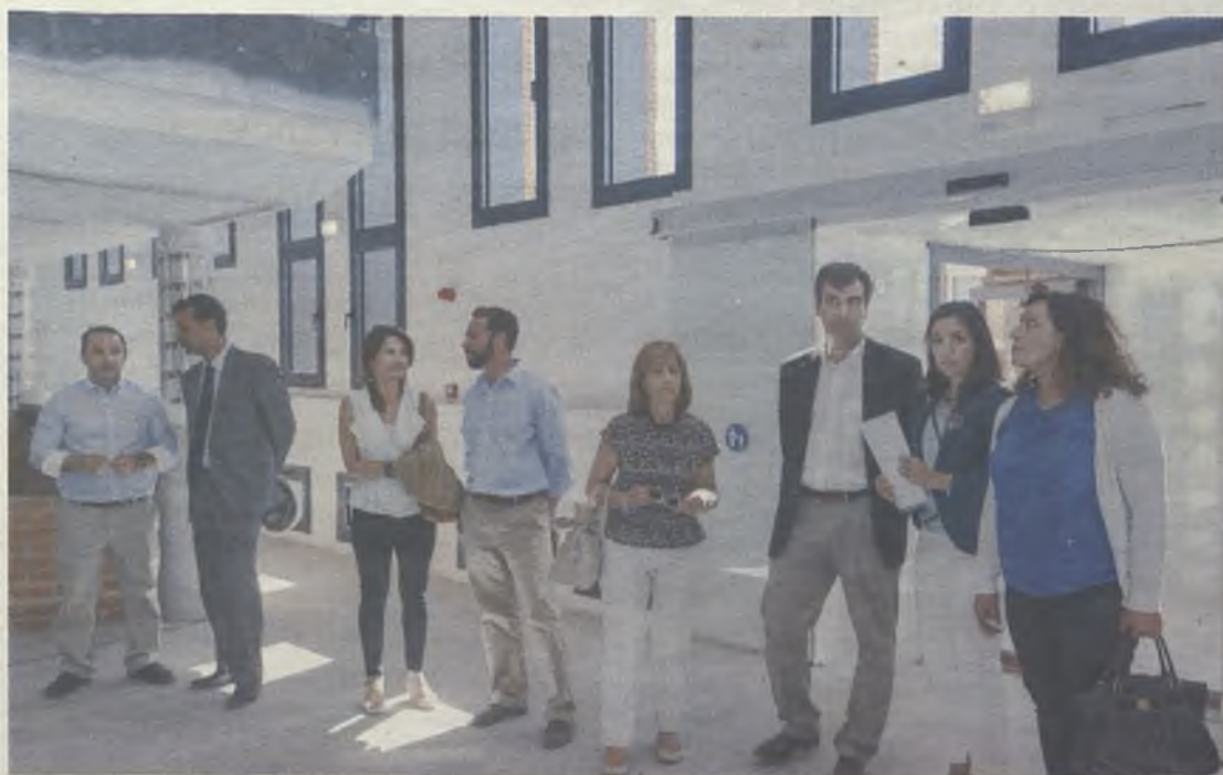
Miembros del Equipo de Gobierno visitaron el interior del edificio.

Este mes finalizarán los trabajos de recuperación del antiguo Cuartel del Henares para convertirlo en un Centro de la Familia para la ciudad de Guadalajara y en el centro social del barrio de Manantiales. Cumpliendo con el plazo establecido de 20 meses, el Ayuntamiento espera recepcionar las obras en julio.