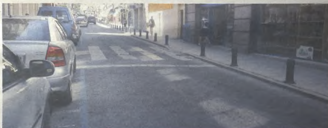
El Ayuntamiento da un paso más en la reforma del Centro Histórico./Gu30D