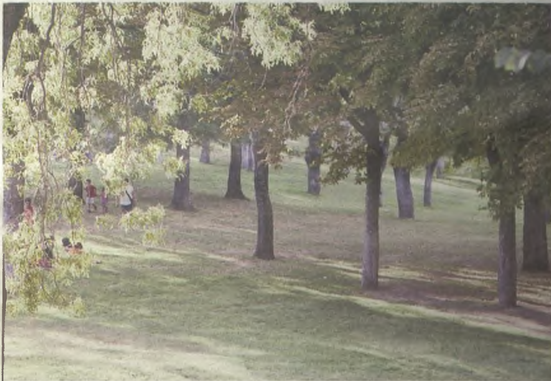
El consistorio pretende reducir la suciedad que provocan las aves.

Dentro de las medidas preventivas, el Ayuntamiento será más estricto con el cum-