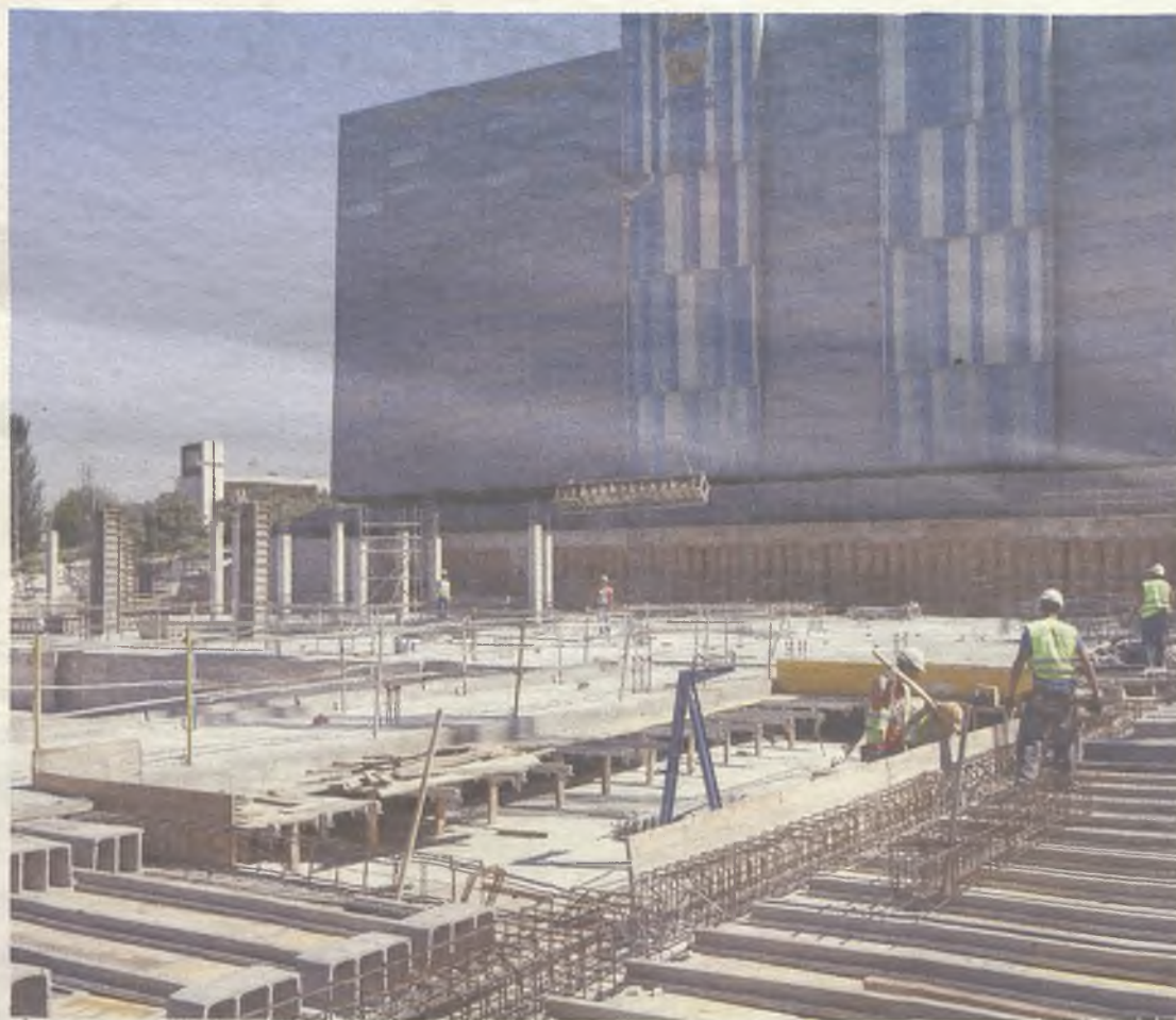
Ya se ha completado la fase de cimentación.

El Centro Acuático es uno de los proyectos más ambiciosos que se han acometido en la ciudad en los últimos años.