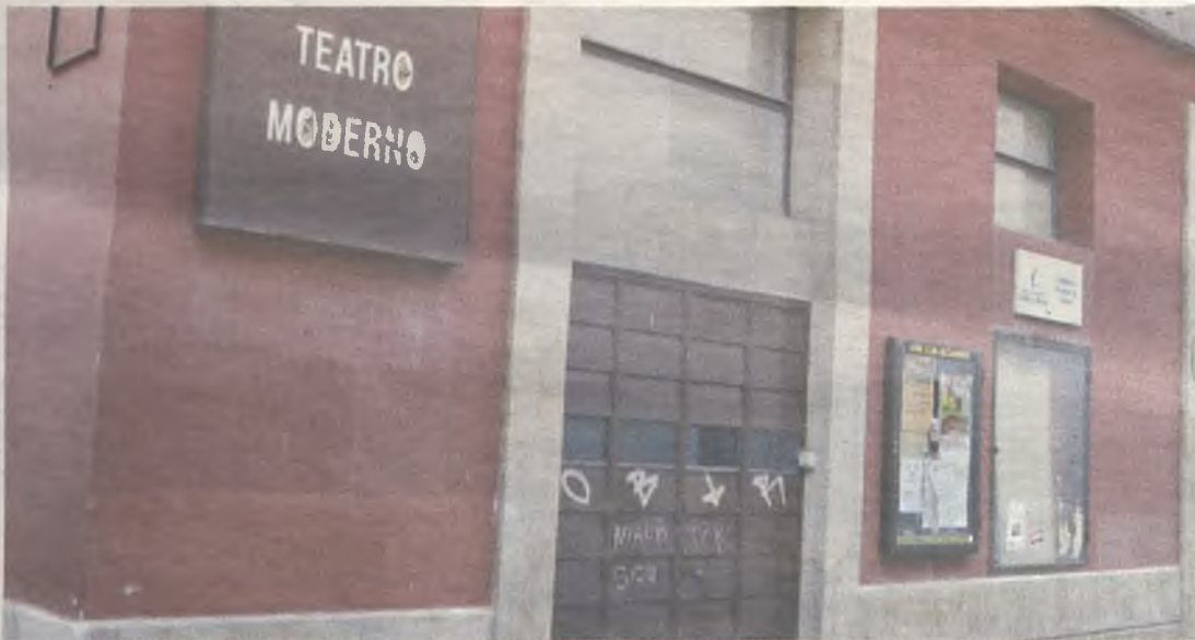
El Teatro Moderno./Gu30D

Tendrá lugar a finales de año, gracias a la inversión de 230.000 euros que realizará el Ayuntamiento y la Junta de Comunidades