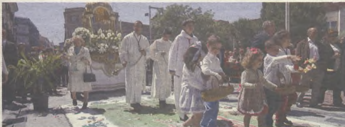
Niños y niñas vestidos de comunión acompañan a los apóstoles.

Declarada recientemente Bien de Interés Cultural, el domingo 22 de junio se celebrará la tradicional procesión del Corpus Christi protagonizada por la centenaria Cofradía de los Apóstoles –la más antigua de la ciudad– y los niños y niñas que este año han recibido la primera comunión. Saldrá de la iglesia del Fuerte de San Francisco y realizará su recorrido tradicional hasta llegar a la concatedral de Santa María. Como es habitual, distintas cofradías realizarán sus altares en Santo Domingo, Jardínillo, Miguel Fluiters y Santa María. En la calle Miguel Fluiters, la Cofradía de la Pasión del Señor realizará la alfombra floral.