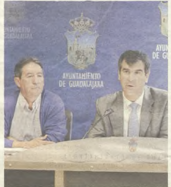
El Alcalde y el Director de Proyecto Hombre./J.R.

Por otro lado, el programa de prevención indicada se va a desarrollar este año por primera vez. La población diana son jóvenes de entre 13 y 21 años que hayan tenido contacto con las drogas. Podrán derivarse desde los centros educativos, servicios sociales o podrán recurrir a dicho programa por iniciativa propia. La forma de participar en este recurso será a través de la técnico del Plan Municipal de Drogas o a través de Proyecto Hombre.