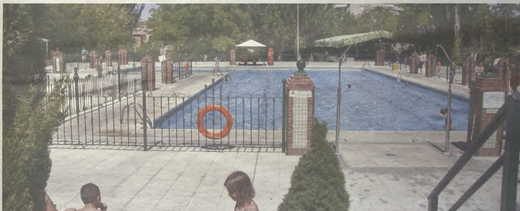
La piscina de verano abre el 7 de junio./Gu30D

- Guadabono jóvenes (de 13 a 17 años), tercera edad y discapacitados: 14,95 euros.