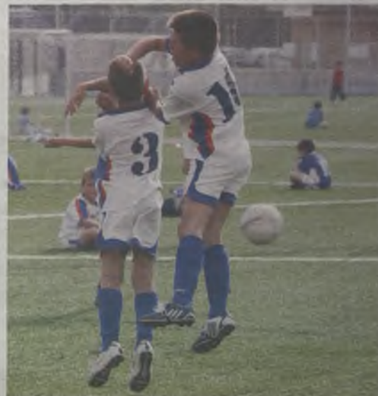
Participantes de todas las edades./Gu30D

El Ayuntamiento de Guadalajara y la Concejalía de Deportes apoyan la competición y colaboran como cada año en la organización de esta importante cita deportiva de la ciudad. El jueves día 12 de junio, a partir de las 18.00 horas, se celebrarán las distintas finales.