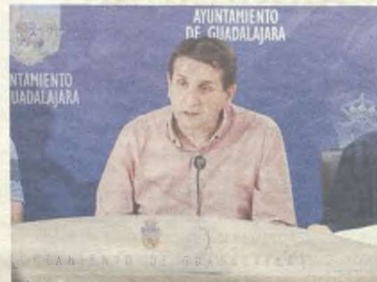
Este evento fue presentado por Eladio Freijo./J.R.

La mayoría de las pruebas son escolares. Habrá carreras de velocidad, de corta y media distancia, un concurso de longitud y unas carreras de relevos mixtos. El plato fuerte de la cita