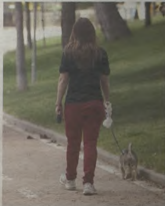
La Ordenanza fue aprobada por unanimidad.

- Aunque es algo que deberá concretarse más adelante, esta ordenanza deja la puerta abierta a que los perros no peligrosos se puedan soltar por la noche en determinadas zonas establecidas por el Ayuntamiento. En verano podrán soltarse de 11 a 8,30 horas y en invierno de 20 a 8,30 horas. Los dueños deberán estar pendientes en todo momento de sus animales.