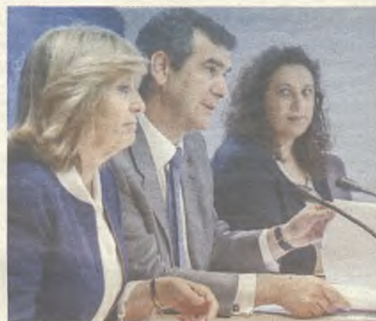
Presentación de las jornadas.

Estas jornadas se desarrollarán en el Centro Municipal Integrado Eduardo Guitián y serán inauguradas el día 10 de junio a las 11 horas, por el Alcalde de Guadalajara y altos representantes del Ministerio de Sanidad, Servicios Sociales e Igualdad y de la Federación Española de Municipios y Provincias.