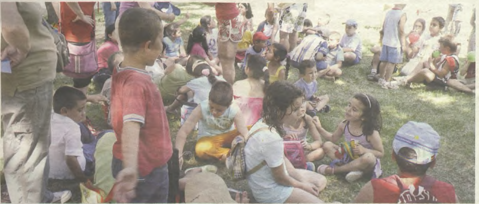
Actividades al aire libre del programa municipal de verano.

El plazo de inscripción será del 9 al 18 de junio en los centros sociales de Cifuentes y Los Valles y en www.guadalajara.es