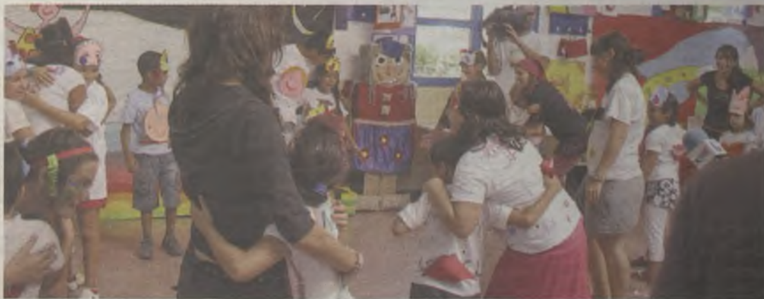
Juegópolis en el centro social de la calle Cifuentes.