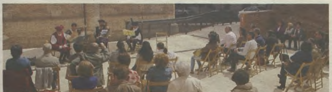
Última actuación frente a la Capilla de Luis de Lucena.

El ciclo Monumentos con Letra y Música se ha clausurado con un extraordinario concierto de música y la teatralización de antiguas leyendas de la historia de la ciudad. Este último concierto se celebró en la plaza situada junto a la Capilla de Luis de Lucena con una buena respuesta del público. Esta actividad estaba incluida en el programa dedicado a la figura de Álvaro Fáñez de Minaya en el novecientos aniversario de su fallecimiento.