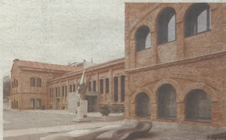
El Cuarterel del Henares ha sido completamente remodelado.