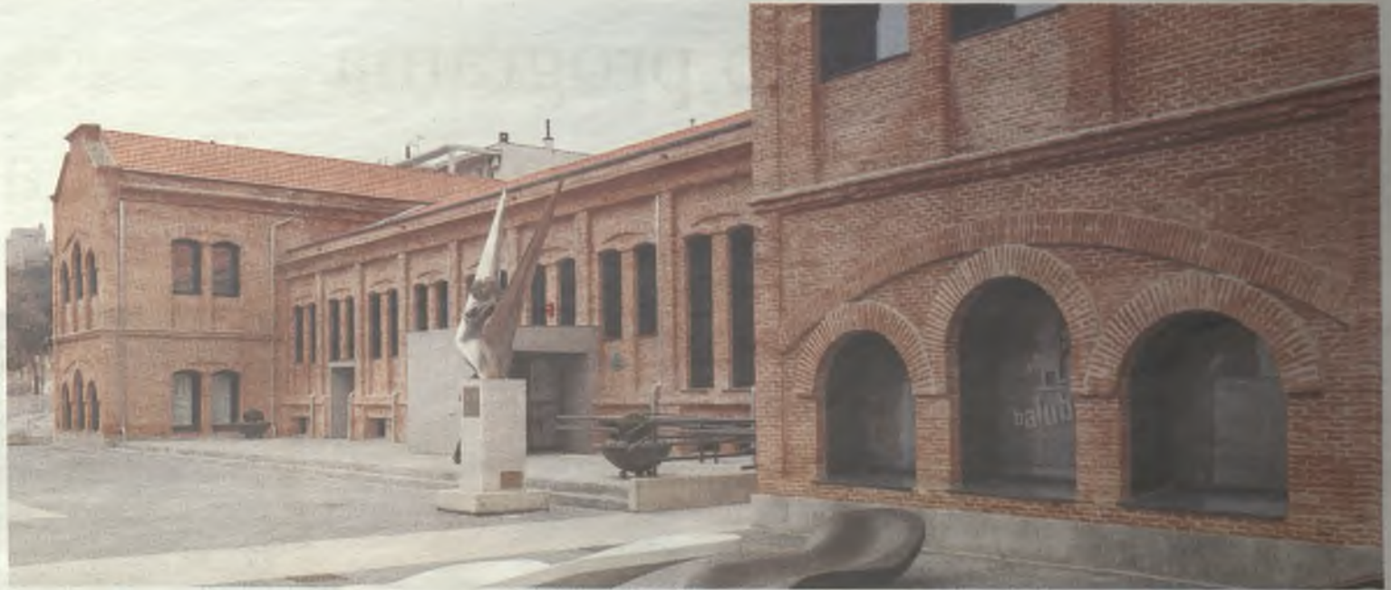
Imagen actual del Cuartel del Henares tras la rehabilitación.

Tal y como ha señalado Román, Los Manantiales ha experimentado evidentes mejoras en los últimos años. El Ayuntamiento ha realizado numerosas inversiones en él para mejorar la calidad de vida de sus vecinos. Se han remodelado las calles La Isabela, Lanjarón y Archena; también la Plaza de Los Manantiales. También ha mejorado el aspecto de la mayoría de las calles, creando nuevas zo-