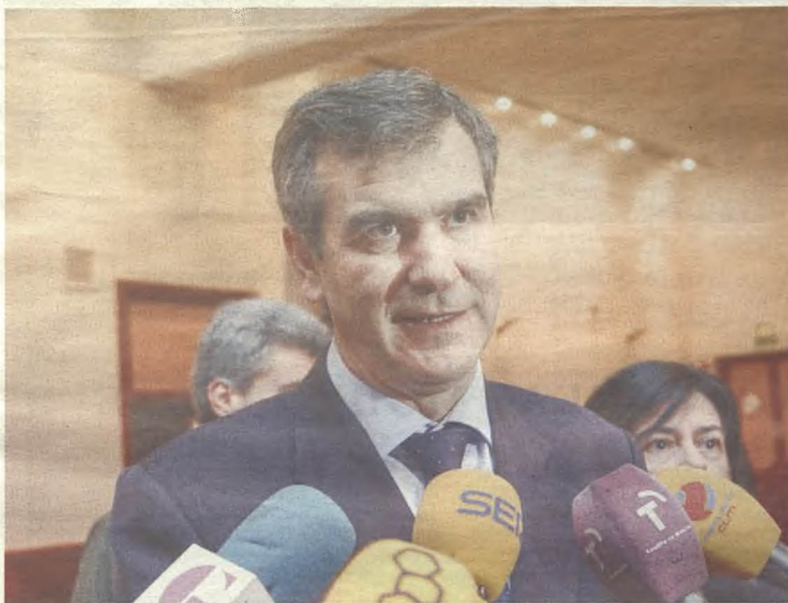
El Ayuntamiento ultima los detalles de su apertura.

El Teatro Moderno de Guadalajara volverá a abrir sus puertas el próximo martes 3 de marzo, con la música de Ara Malikian & Fernando