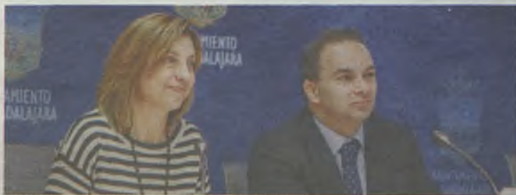
Carnicero y Jiménez presentaron las ayudas.

El plazo de presentación de solicitudes por parte de las empresas será de dos meses tras su publicación en el Boletín Oficial de la Provincia.