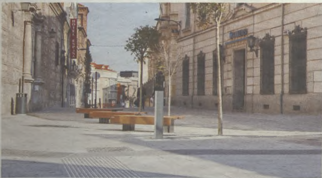
Nueva zona estancial frente a la iglesia de Santiago.

El presupuesto para poner en marcha la iniciativa "Guadalajara conect@" es de 992.852,69 euros y el Ayuntamiento colabora con un 30% de esta cantidad. Está previsto que el Ministerio de Industria y Energía financie el resto.