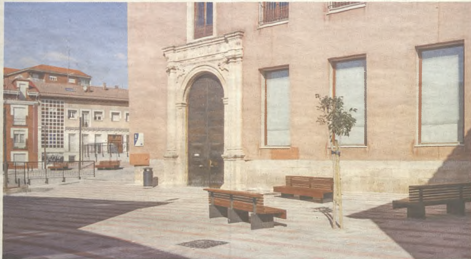
Nuevo acceso a la Biblioteca Municipal.

En el caso de los conductores que circulen por el Eje Cultural, hay que recordar que las obras de remodelación han creado un nuevo