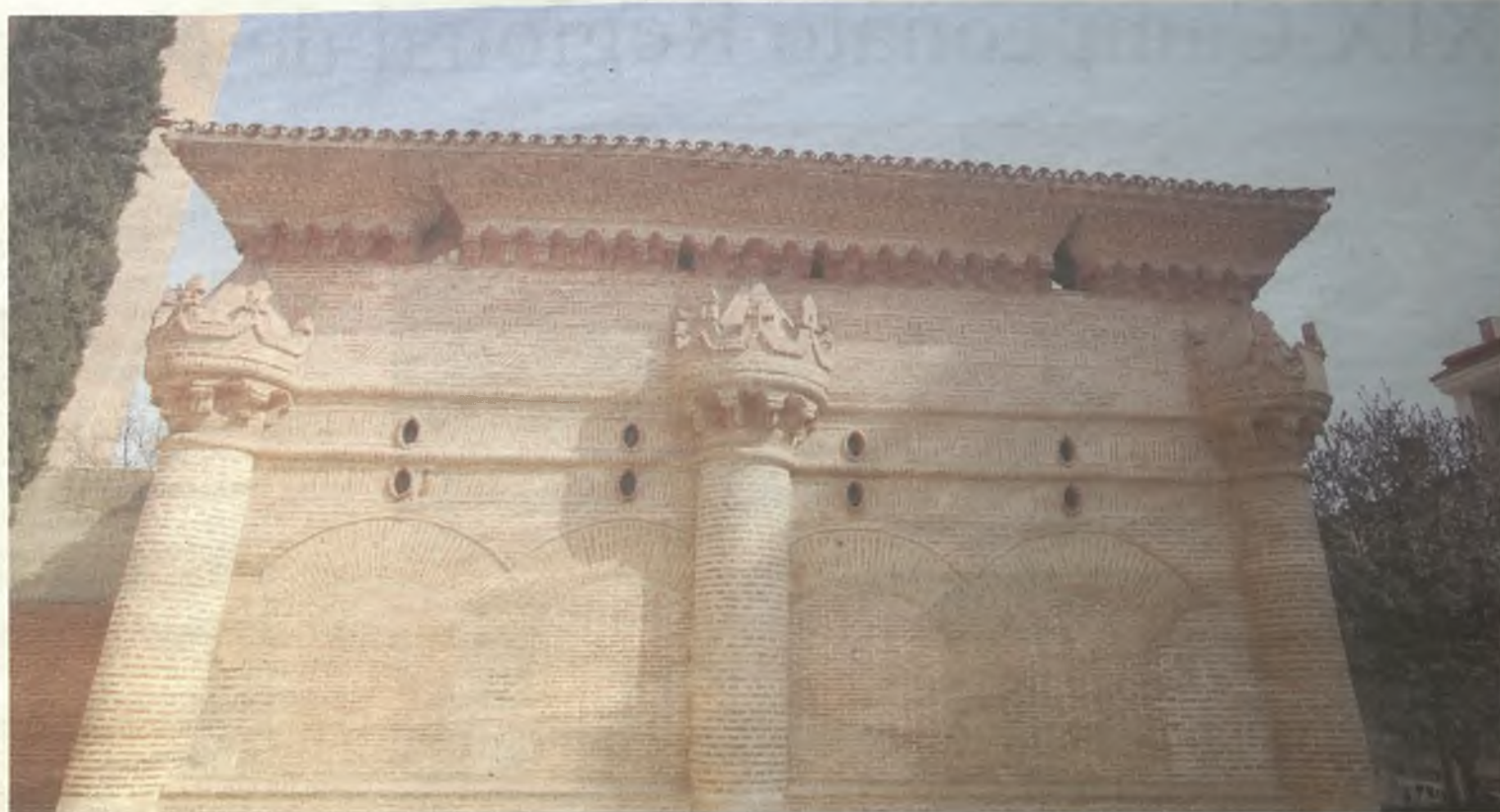
La Capilla de Luis Lucena, centro de este taller.

El taller está dirigido a niños y niñas de entre 4 y 10 años, acompañados de un adulto. Se realizará los sábados, días 7 y 21 de marzo, en la capilla de Luis de Lucena, a las 12 horas.