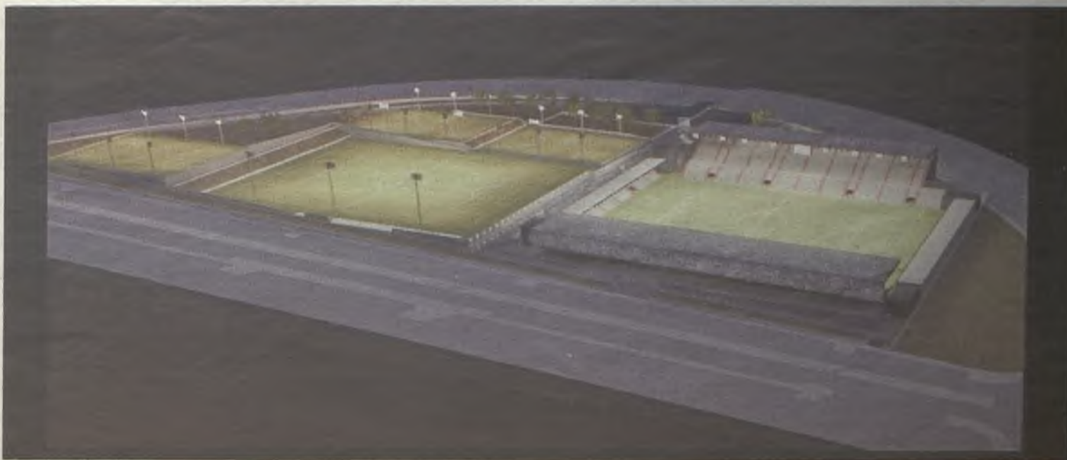
Infografía de cómo será la Ciudad del Fútbol de Guadalajara./Gu30D

Los clubes de fútbol de Guadalajara han acogido con satisfacción este anuncio.