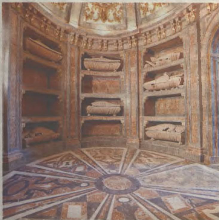
Cripta de la iglesia de San Francisco./Gu30D

Durante la guerra de la Independencia la cripta fue totalmente saqueada por los franceses, sufriendo numerosos daños. Los restos de los Mendoza fueron trasladados a la Colegiata de Pastrana, pero las urnas fueron mezcladas por lo que es difícil hoy en día saber a qué miembro pertenece cada urna. Lo que sí está acreditado es que entre esos restos se encuentran los de los Mendoza de mayor renombre.