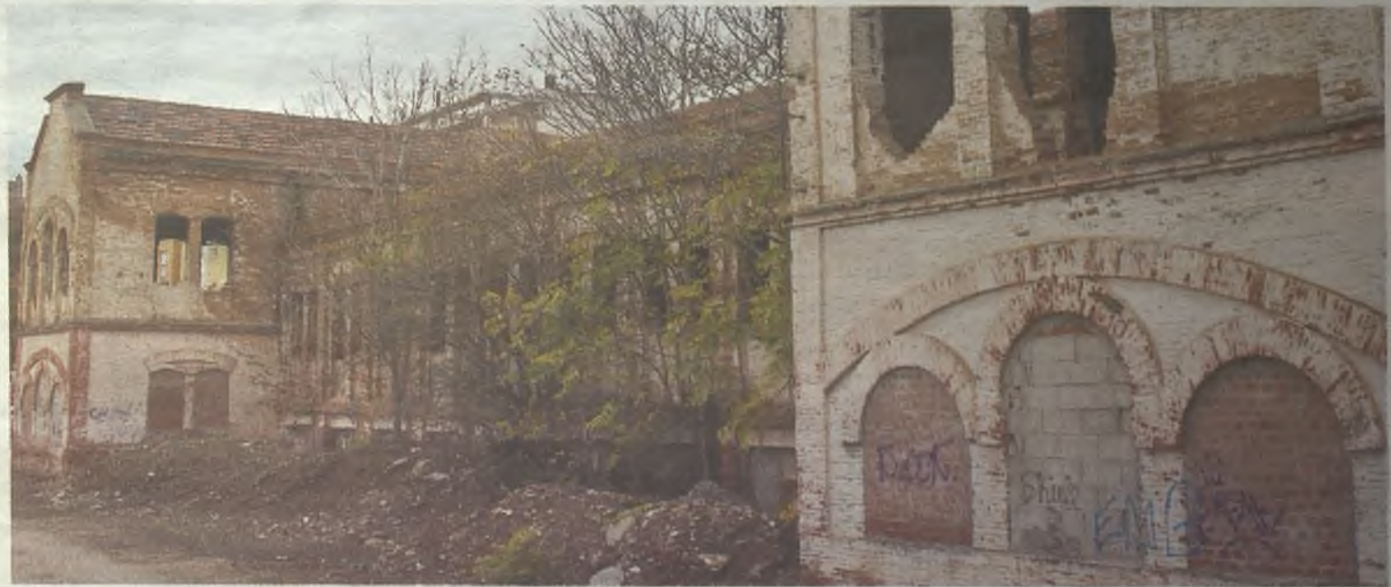
En este estado se encontraba el Cuartel del Henares antes de los trabajos de rehabilitación.