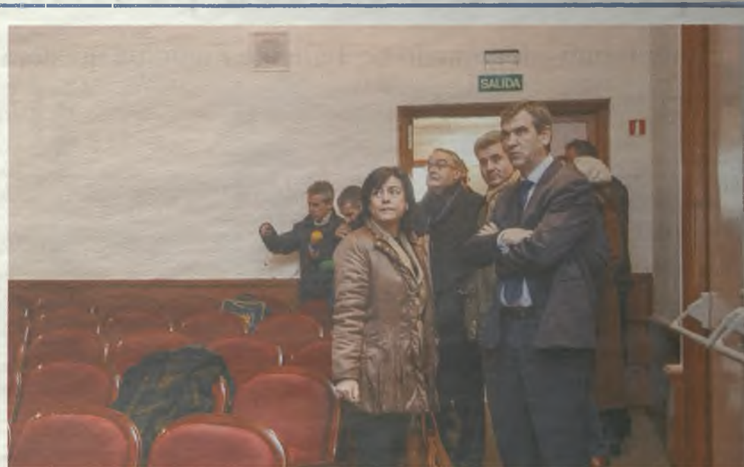
El Alcalde y los concejales visitaron el Teatro Moderno.

El Ayuntamiento de Guadalajara ha vuelto a apostar por aplicar una política de precios popular, que permita disfrutar a todos los vecinos de la programación que se va a desarrollar en este escenario. Los espectáculos infantiles tendrán un precio de 6 euros y el resto de 10 euros. El cine tendrá un precio de 2 euros.