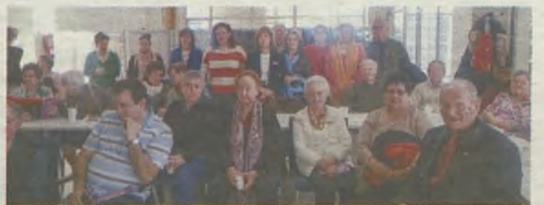
El catálogo se presentó a las asociaciones./Gu30D

lectivos, clasificados según sus fines en los siguientes epígrafes: acción social, atención social, asociaciones culturales, deportivas, de mayores, de mujeres, asociaciones de vecinos y otras englobadas en trabajo, consumo, animales y medio ambiente. Además se incluye un Catálogo de Gestión Asociativa.