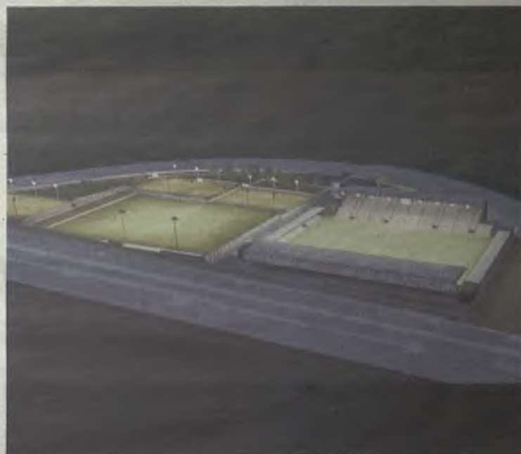
Aspecto que tendrá la Ciudad del Fútbol./Gu30D

por el Ayuntamiento también incluye la ejecución de dos fases más y, entre otros aspectos, contempla la ejecución de un estadio para 10.000 espectadores.