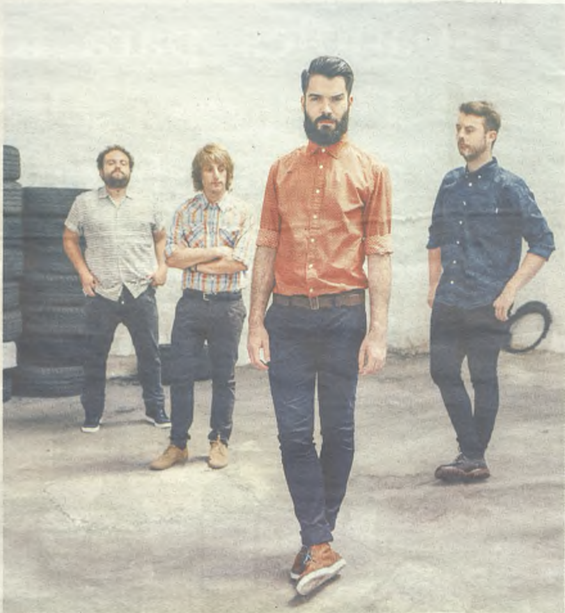
Supersubmarina, el 7 de marzo en el Teatro Buero Vallejo./Gu30D

El ilustre hidalgo Don Quijote de La Mancha. Ilustraciones de Trinidad Romero.