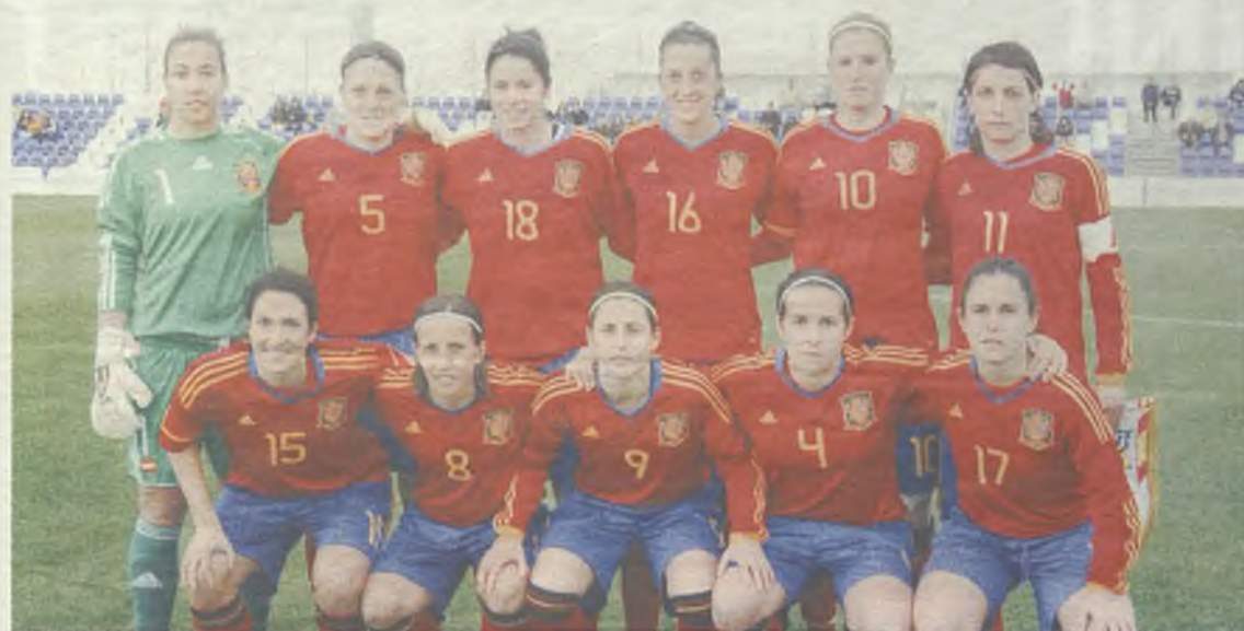
Las mejores futbolistas españolas estarán en Guadalajara./Gu30D

El 3 de marzo, en partido preparatorio para el Mundial de Canadá