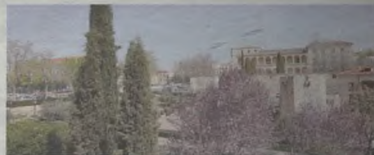
Las familias recorrerán Guadalajara./Gu30D

Información y reservas en la Oficina de Gestión Turística Municipal (949 887 099) turismo@aytoguadalajara.es .