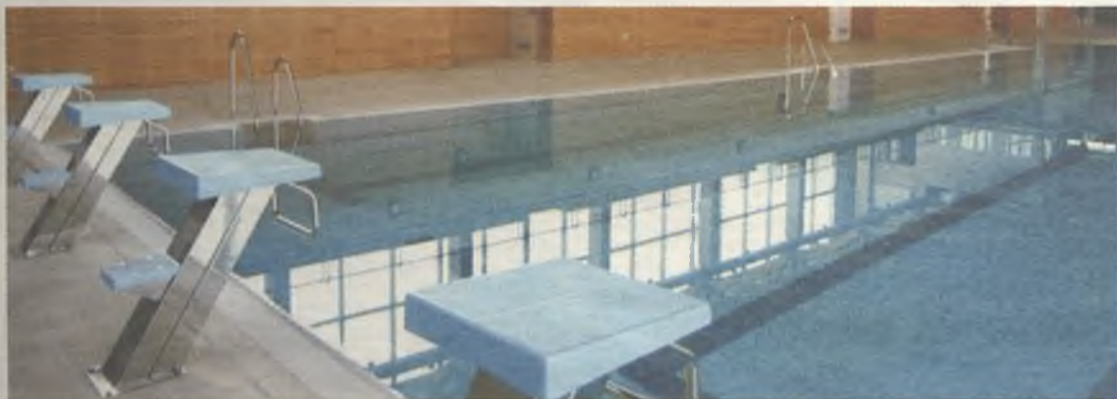
La piscina de la Fuente de la Niña acogerá esta competición.

Se celebrará en las instalaciones de la Fuente de la Niña