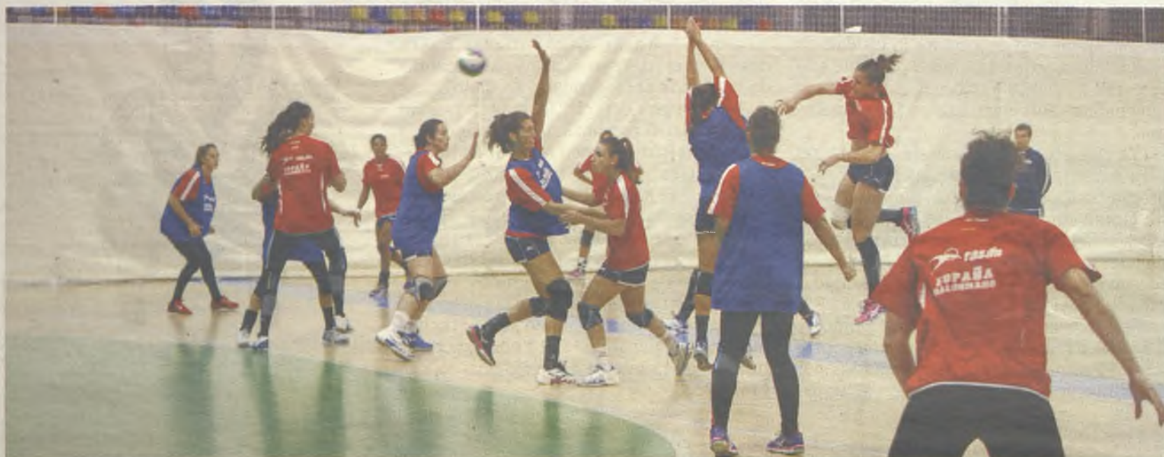
Las chicas dirigidas por Jorge Dueñas se han concentrado en nuestra capital para preparar el Campeonato de Europa que se disputa en Hungría./Gu30D

Guadalajara sigue siendo la ciudad elegida por muchas de nuestras selecciones nacionales para preparar sus compromisos internacionales. Las chicas del combinado absoluto de balonmano dirigido por Jorge Dueñas han utilizado las instalaciones deportivas de la capital para preparar el Campeonato de Europa de Balonmano que se disputa en Hun-