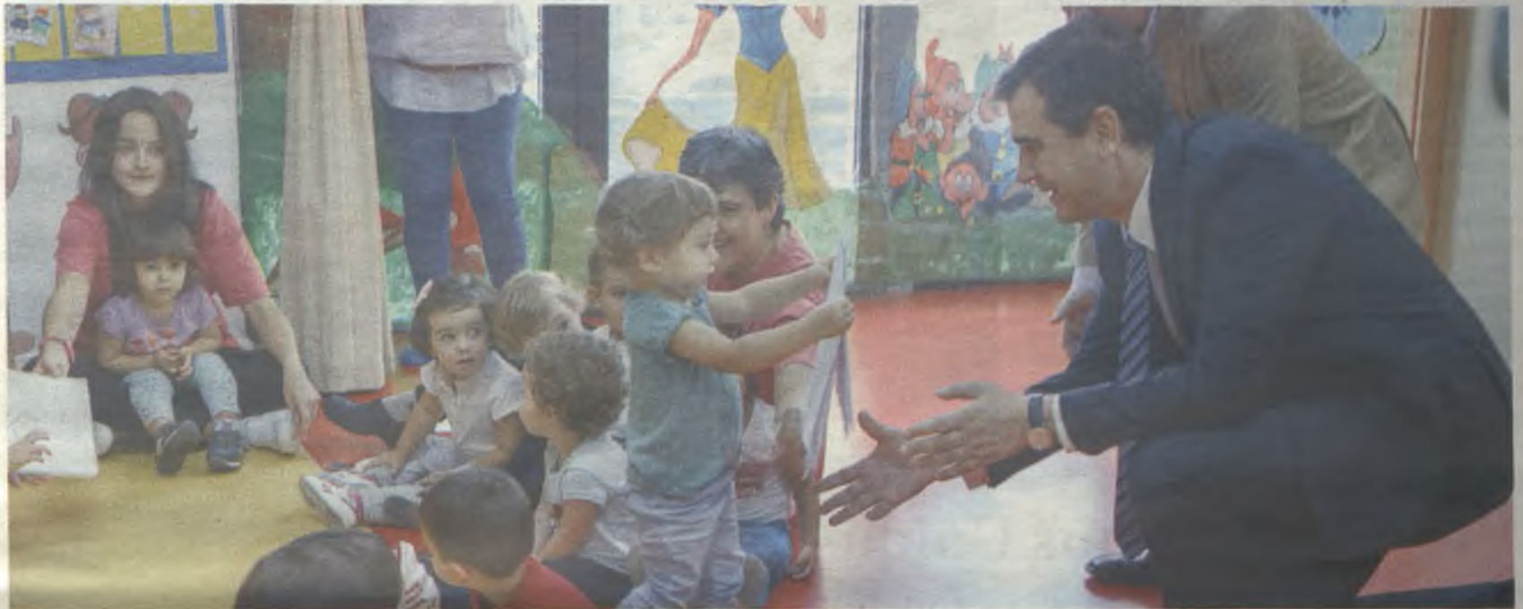
El Alcalde, durante la visita a la escuela infantil.

El Ayuntamiento oferta un total de 129 plazas, subvencionando con cerca de 93.000 euros al año este servicio