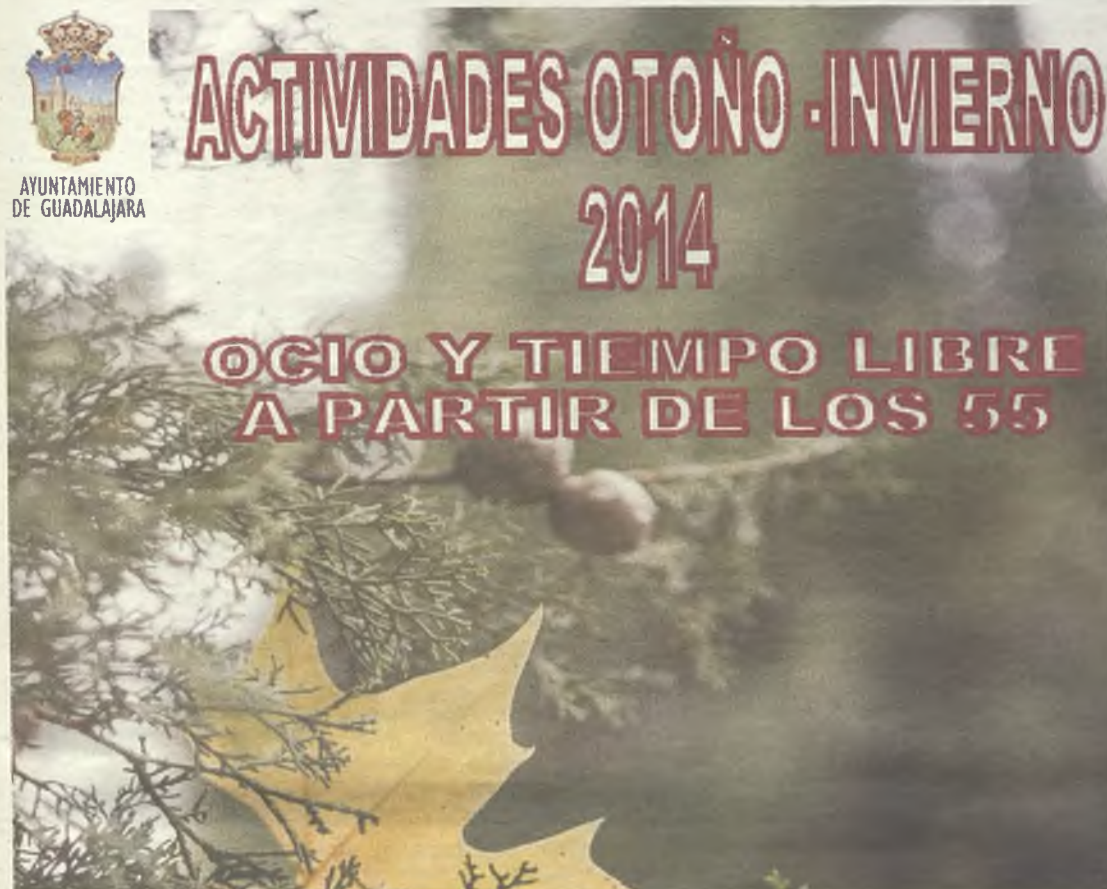
Los mayores vuelven a disfrutar de actividades de ocio y tiempo libre./Gu30D

La Concejalía de Familia pone nuevamente en marcha su programación de actividades de ocio y tiempo libre para mayores de 55 años. Se trata de la nueva edición del programa de otoño-invierno, que tiene el objetivo principal de poner a disposición de este colectivo una serie de propuestas que mejoren su calidad de vida y su tiempo de ocio.