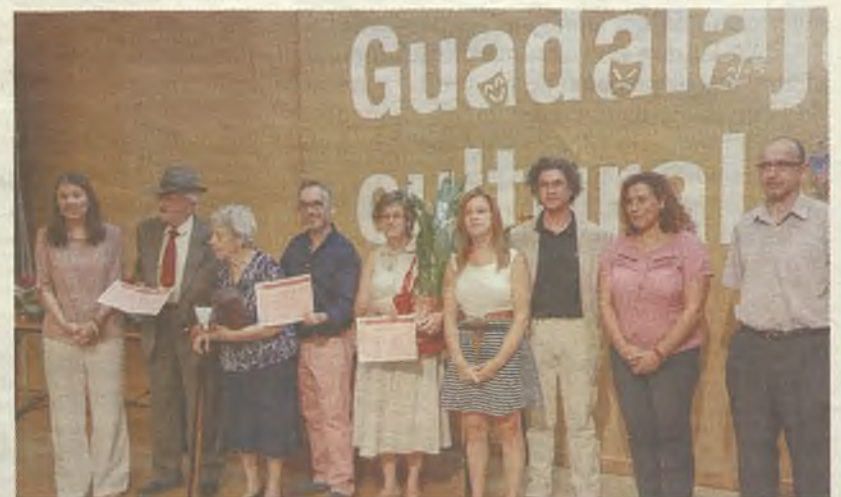
Los ganadores posaron con sus premios.