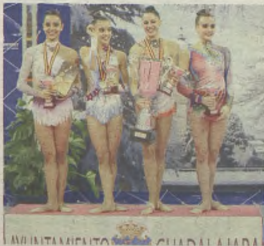
La gimnasia rítmica, protagonista.

El Multiusos de Aguas Vivas se convertirá el 1 de noviembre, nuevamente en sede nacional de la gimnasia rítmica. Después del éxito de la celebración en la primera semana de abril del Campeonato de España Base, la Copa de la Reina, la Copa de España y el Campeonato de España de Clubes, los mejores clubes de España regresan a nuestra capital. Una nueva oportunidad de disfrutar de las mejores deportistas de esta disciplina tan espectacular y sacrificada. No faltarán tampoco las representantes de los mejores clubes de nuestra provincia para homenajear por cuarto año a quién sigue siendo el máximo referente alcarreño en este deporte, Maite Nadal. La única alcarreña que ha participado en cinco Juegos Olímpicos como juez de gimnasia.