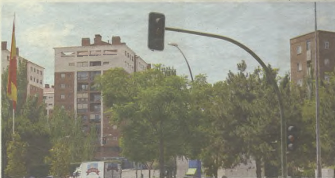
Se mejorará la gestión de la regulación semafórica.