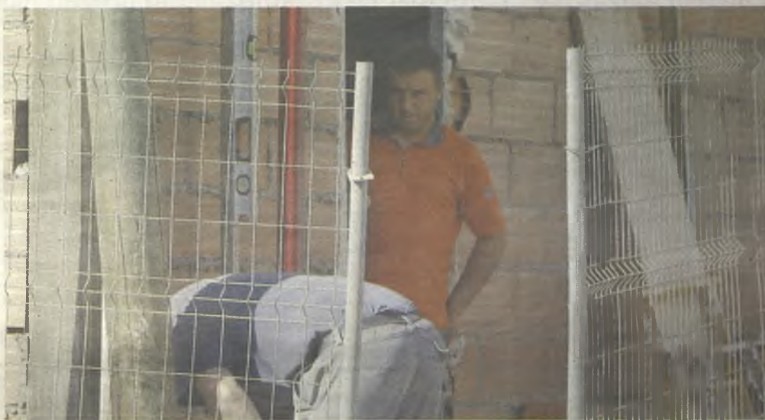
Muchos jóvenes de Guadalajara encontrarán empleo gracias a estas ayudas.

El importe de la ayuda a percibir será de 3.000 euros, cuantía que podrá incrementarse acumulativamente en 500 euros adicionales si la persona que se establece por cuenta propia se encuentra en alguna de las siguientes circunstancias: tiene una discapacidad reconocida igual o superior al 33%, están en situación de desempleo ininterrumpido durante los dos años anteriores, han agotado la percepción de