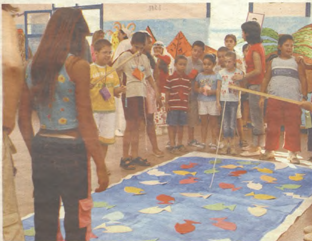
Los niños tienen muchas formas de divertirse en verano en Guadalajara.

Más información sobre estos programas en la web municipal www.guadalajara.es , en el Centro Municipal Integrado "Eduardo Guitián" y en los centros sociales municipales.