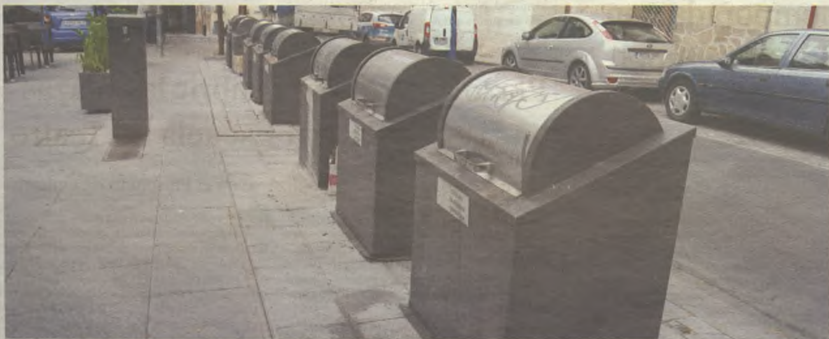
Entre los servicios de este contrato se encuentra la recogida de recursos urbanos.