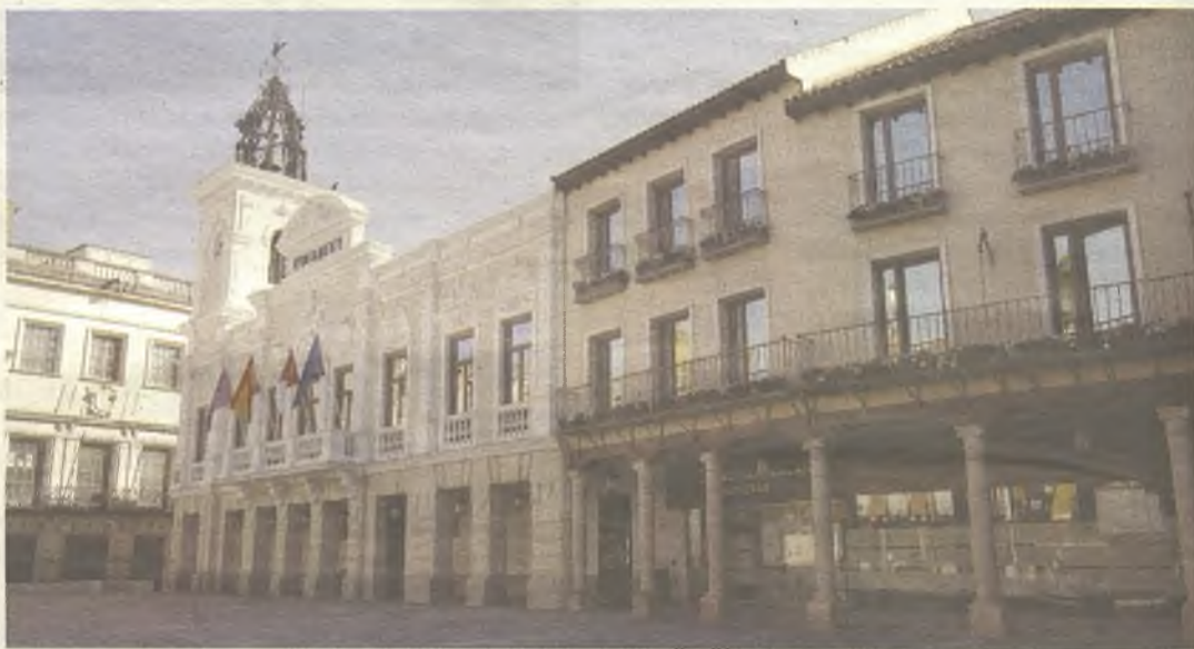
El Consistorio ha conseguido ajustarse a la Ley de Morosidad en seis meses.

Consistorio puedan cobrar también en estos mismos plazos a lo largo de los próximos meses.