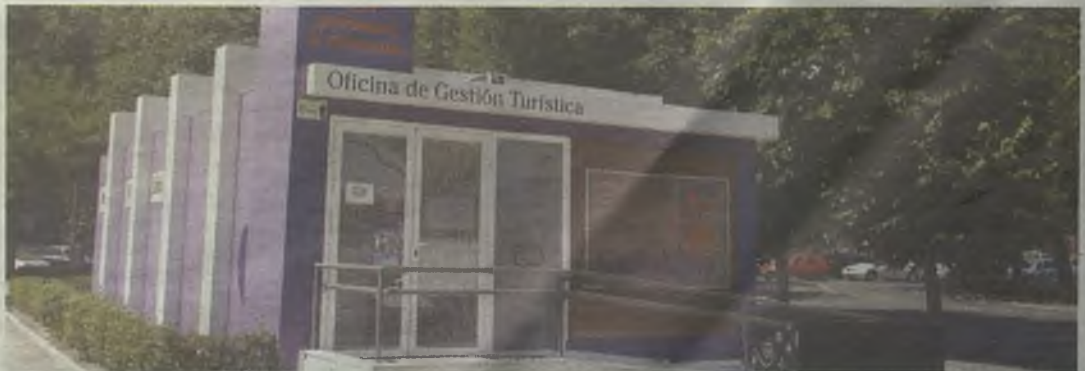
La Oficina Municipal de Turismo, 'brújula' para nuestros visitantes.

de la Aviación Militar Española, a las 11.30 horas, los sábados, domingo y festivos. El precio es de 5 euros (incluye la tarjeta Guadalajara Card) y de 2 euros para los menores de 12 años y estudiantes que acrediten su condición.