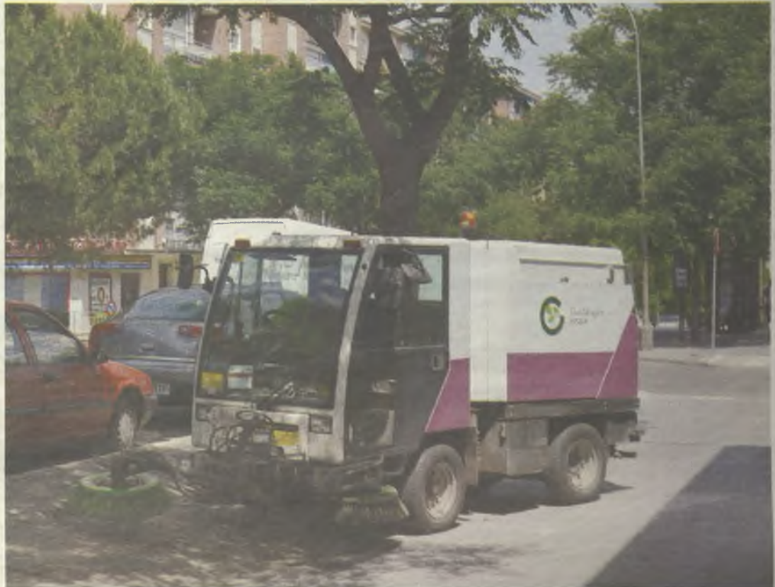
La limpieza de las calles, estratégica para el Ayuntamiento.

Las ventajas que obtendrán los ciudadanos son múltiples, dado que los servicios estarán mejor coordinados. Además van a tener un papel protagonista, dado que podrán disponer de aplicaciones para fotografiar incidencias y comunicárselas al contratista directamente para su resolución inmediata. También se les realizará encuestas de satisfacción sobre los diferentes