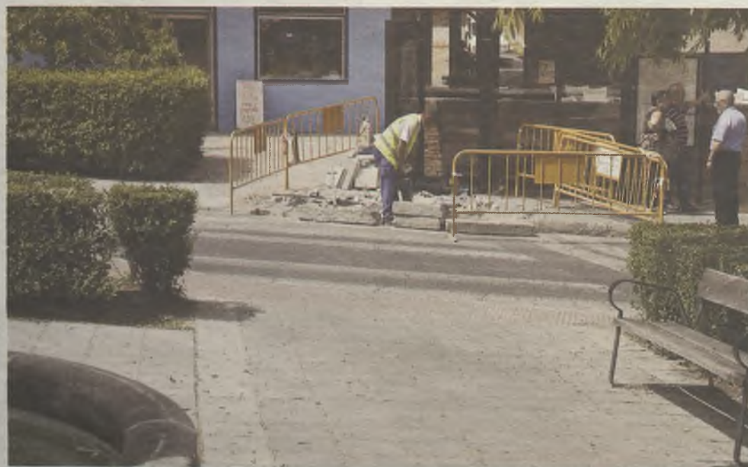
Los trabajos buscan mejorar la accesibilidad de los peatones.

Se están adecuando las aceras y los pasos de peatones