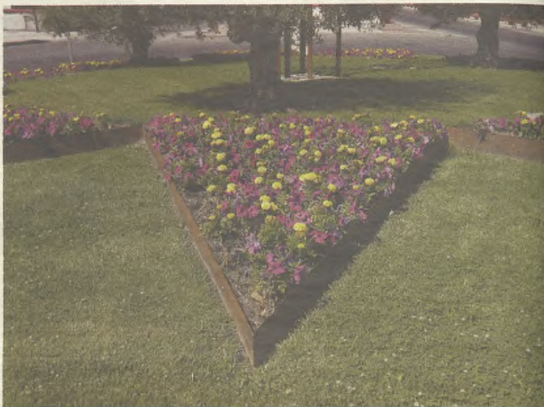
Los ejemplos de las mejoras en las zonas verdes están en toda la capital.

Dentro de estas actuaciones se encuentra, además, la eliminación de pintadas en los elementos de mobiliario existentes en los parques. De momento, este trabajo ya se ha realizado en el barranco del Alamin, en la plaza de los Caídos, en La Constitución y La Chopera.