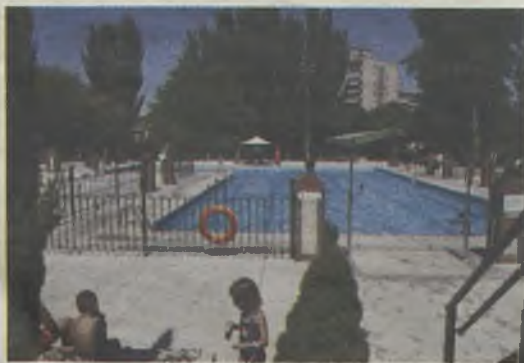
Los guadalajareños ya disfrutaban de su piscina.

La piscina está completamente adaptada para discapacitados con movilidad reducida e invidentes, gracias a las obras emprendidas por el Ayuntamiento de Guadalajara