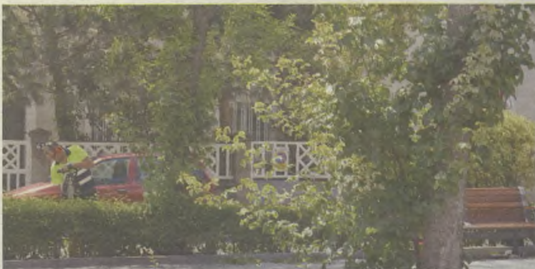
El cuidado de parques y jardines, entre los servicios que quedarán integrados.

servicios, y eso será uno de los factores que determine el cobro de la adjudicataria.