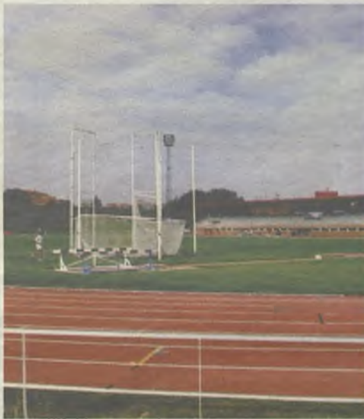
Atletas internacionales en La Fuente de la Niña.

La estratégica situación de nuestra ciudad, su infraestructura deportiva y la buena acogida que se dispensa a los atletas, han contribuido a que otras selecciones elijan Guadalajara como 'centro de operaciones'. Los atletas de Guatemala ya estuvieron anteriormente en el mes de mayo, mientras que es la primera vez que los ecuatorianos se preparan en la ciudad.