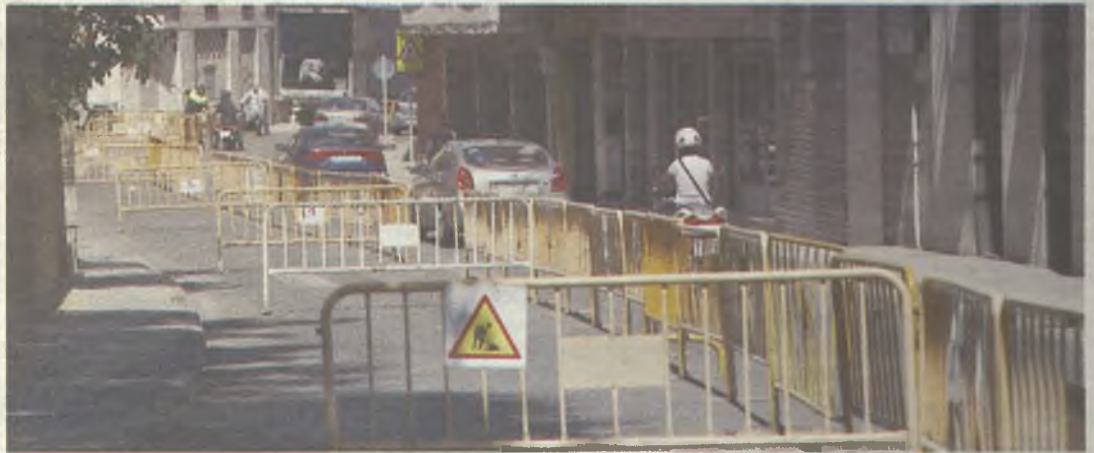
Las obras están debidamente señalizadas.

El Ayuntamiento de Guadalajara actuará también en las siguientes calles adyacentes: Francisco Torres, Francisco Cuesta, Sinagoga, La Ronda, Benito Hernando, Fernando Palanca, Teniente Gonzalo Herranz y Doctor Creus. Este proyecto de remodelación supone un paso más en la reforma del casco histórico de la ciudad iniciada por el Consistorio hace unos años.