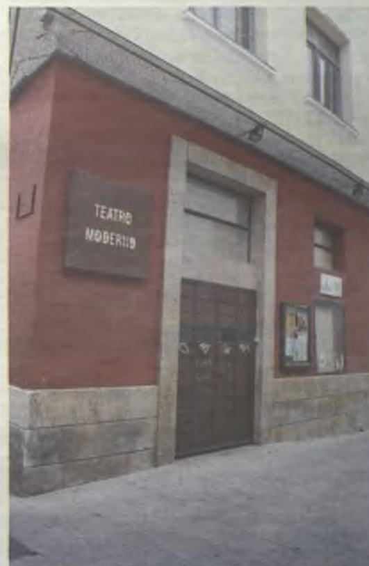
El Moderno abrirá con la gestión municipal.

laboración con distintas administraciones, entidades públicas y privadas, asociaciones y otros colectivos porque apoyamos la promoción cultural desde cualquier ámbito social”.