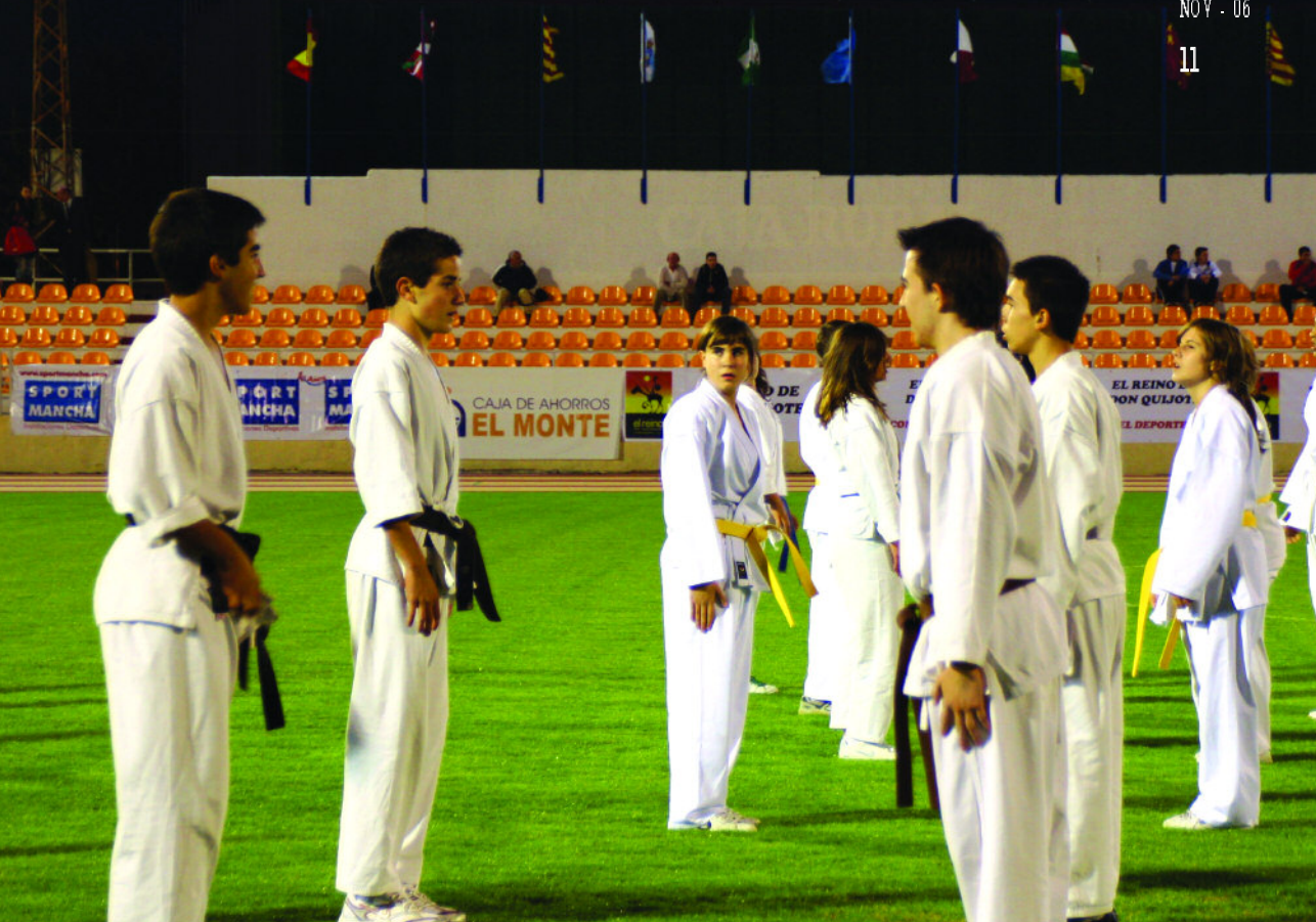
Fiesta de inauguración del Polideportivo Municipal Juan Carlos I

El campo se inauguró en 1973 y en sus 33 años de existencia no había conocido reforma alguna. Aún falta acometer la segunda fase, que en un par de meses estará finalizada, referente a la dotación electrónica e infraestructura interior de las oficinas. El nuevo espacio fue inaugurado el pasado cuatro de octubre en un acto que conjugó deporte, alegría y diversión.