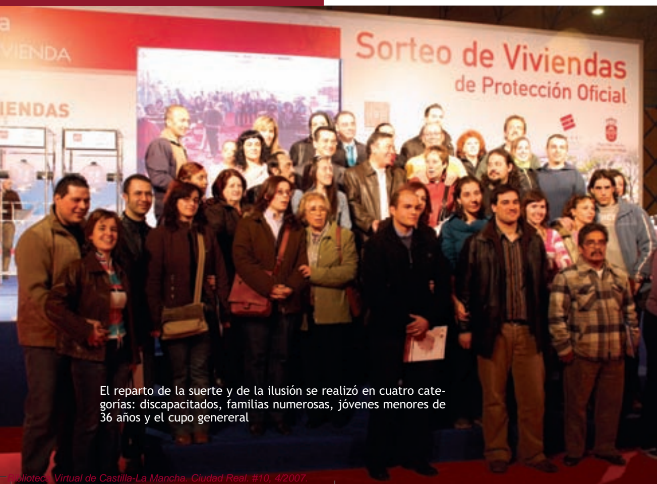
El reparto de la suerte y de la ilusión se realizó en cuatro categorías: discapacitados, familias numerosas, jóvenes menores de 36 años y el cupo general