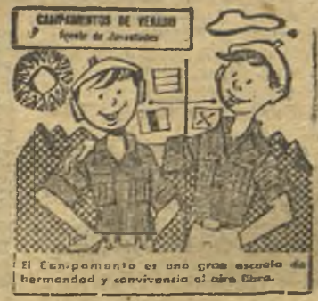
El Campamento es una gran escuela de hermandad y convivencia al aire libre.