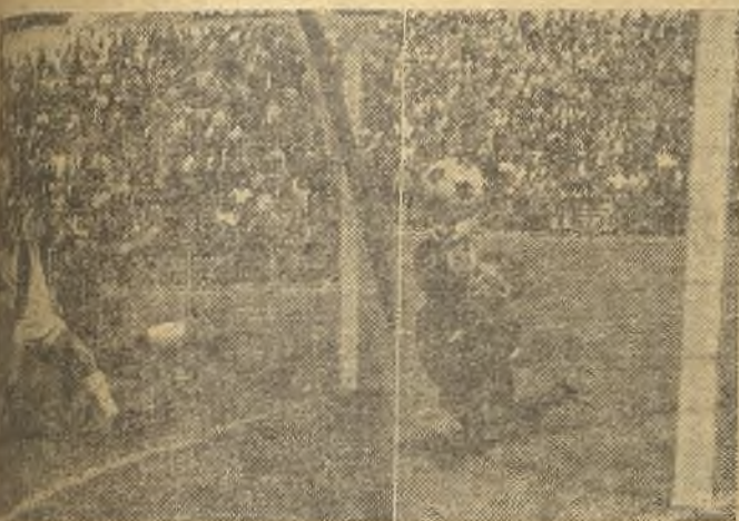
El domingo en Valladolid, el Calvo Sotelo rindió devolución de balón al Rayo. En las fotos de Balaguer, arriba, una parada de García Fernández y un balón que llegó a la red y no fue gol. Abajo, el equipo del Rayo. (Amplia información en página tercera)