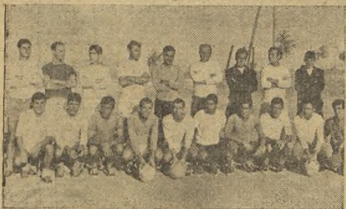
El Mérida Industrial, que parece que ha empezado muy fuerte esta temporada y que el domingo recibe nada menos que al Cacerense

El jugador comunicó a los directivos pacenses que si no se le resolvía a su favor un asunto en la capital sevillana, regresaría a nuestra ciudad para suscribir el contrato antes de la salida para El Ferrol del Caudillo.