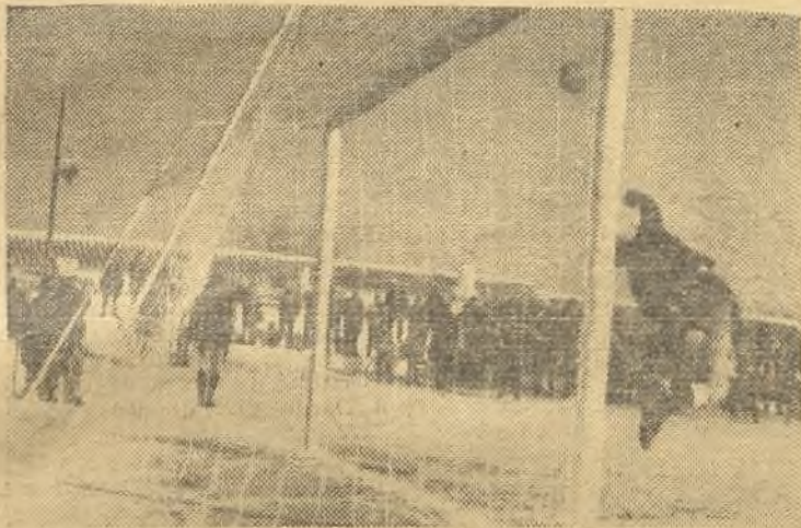
He aquí el único gol del partido marcado por Goyo de penalty.

Tal de primavera, aunque algo fresca. Buena entrada. Entrega al Plus Ultra de banderín, como recuerdo de su primera visita a Socuéllamos. Escasas lesiones fortu-