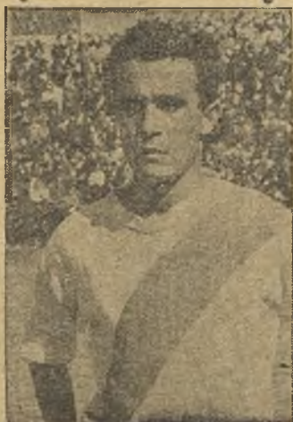
Felines, el más destacado

Del Calvo Cotel, Maiztegui nos pareció un defensa sobrio que ha de ir a más. Antoniet estuvo bien en su misión de centrocampista, porque, además, dispara fuerte en cuanto se le presenta la ocasión. Feliú y Al-