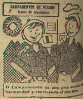
El Campamento es una gran escuela de hermandad y convivencia de todo el mundo.

Sucursal en Puertollano Garaje YEBENES Gran Capitán, 18