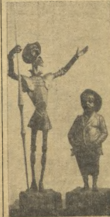
Este es el Trofeo Cervantes que se disputará en Alcalá estos días

comienzo de temporada en donde los equipos acusaron no estar aún acoplados, mucho menos el Guadalajara que incluso acusó la falta de entrenamiento, de todas formas luchó cuanto de