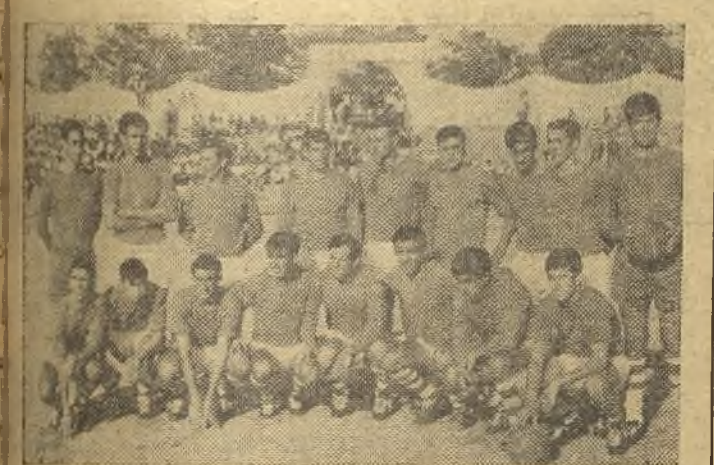
El C. D. Cacereño 67-68, en el que los aficionados confían plenamente. (Foto Burgos).

veras. Haciendo un juicio somero de cada una de las líneas digamos que los dos porteros Fermín y Caballero en las ocasiones que el balón les llegó fue con marchamo de gol inevitable. Al ex-madridista le colaron algún gol, quizás por falta de decisión.