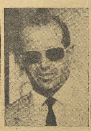
desde el presidente al último empleado.

¿Contento en el Madrid? «Todo lo que yo pueda decir es poco. Es una gran familia, adonde es difícil ingresar y a la que me honro en pertenecer. Lo que más admiro en ella, es, aparte de su organización, conocida por todo el mundo, el respeto con que tratan a todo el mundo. Creo que en el Real Madrid se aprende de todo,