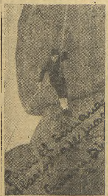
vencer a la montaña, bella sí, pero traidora.

Ha vuelto a surgir su innata alegría, esa que le permite afrontar el riesgo sin perder la sonrisa.