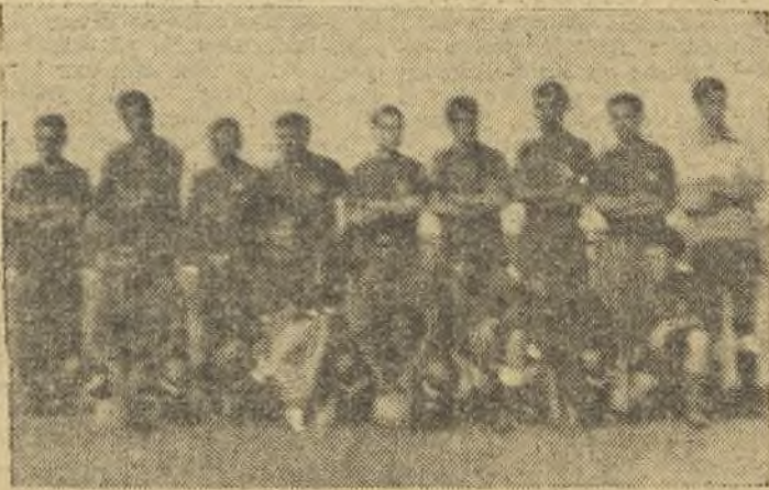
El C. D. Asland, vencedor del torneo Bodas de Plata sobre el C. D. Yuncos

La clasificación final fue: 1.º, Asland; 2.º, Yuncos; 3.º, At. Sta. Bárbara; 4.º, Iglesias; más los equipos juveniles.