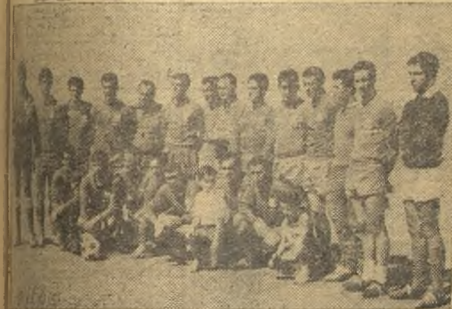
del Alcázar de la actual temporada 1967-68.

Aficionado: Por el Alcázar y por Alcázar hay que jalar al equipo. Se ventila el ser o no ser de nuestro fútbol. La lucha va a empezar. Animo.