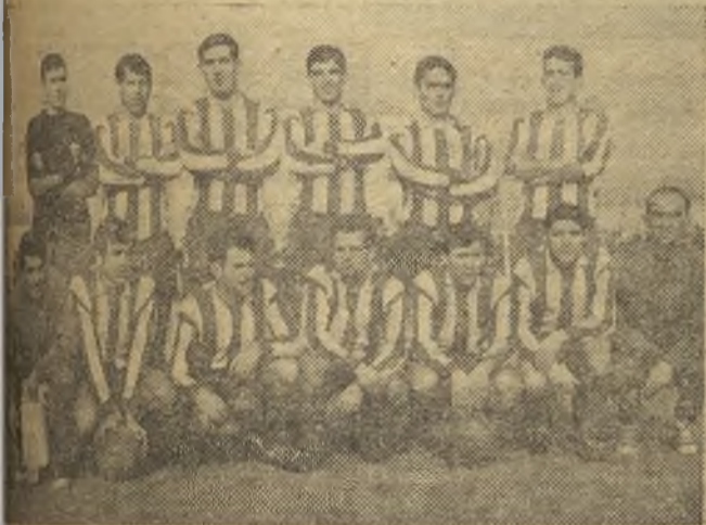
El Moscardó tuvo un buen comienzo, pero luego el Ibiza remontó el tanteo

que afirma la crónica que informamos en la página tercera: El Moscardó, pese a jugar un buen encuentro, se ha visto sorprendido por un fútbol rápido y por la preparación de los locales que no dieron mucho respiro a los muchachos de Usera. El Moscardó empezó el partido con mucha tranquilidad y los ataques han creado mucho peligro para la puerta de Luis; los madrileños dominaron en el comienzo de partido e incluso a los tres minutos se adelantaron en el marcador y por eso los locales en difícil situación, pero el conjunto isleño, derrochando mucha fuerza y ganas de triunfo, fue superior al dominio visitante y, poco a poco, creó una serie de