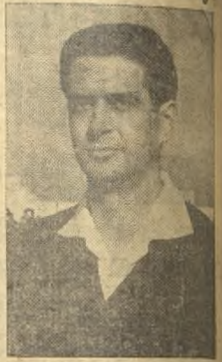
El señor Argote, Mr. Penalty, según la clasificación de nuestro colaborador, Molero Ordoñez, que insertamos en la página novena.