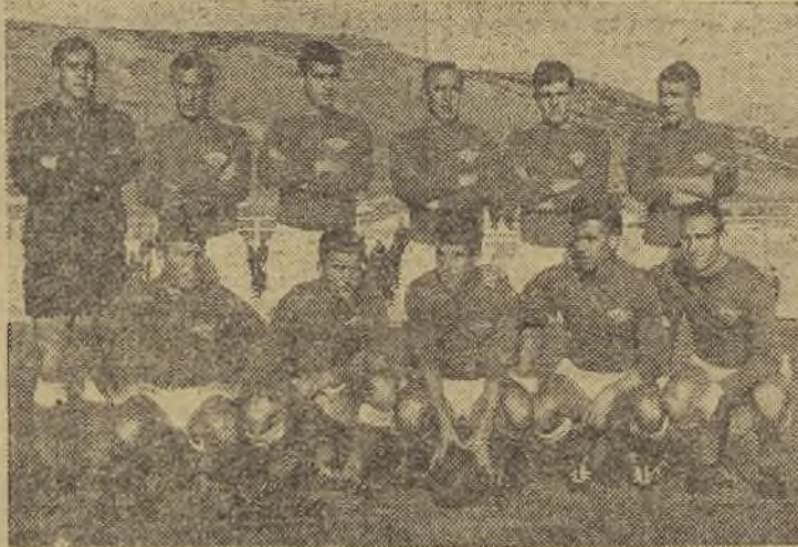
El Plus Ultra, con su triunfo en Gerona, tiene grandes posibilidades de pasar la eliminatoria