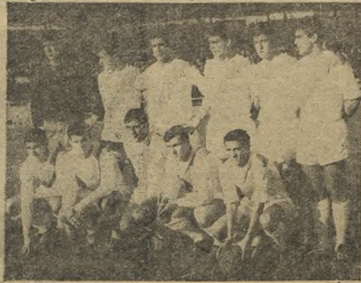
El Rayo Vallecano de la temporada 1966-67 que sin cambios notables se apresta a emprender la próxima temporada.