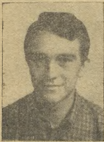
Olmos, uno de los mejores del Extremadura

EXTREMADURA: Gerardo; Luna, Carral, Blandón; Márquez, Olmo; Chicha, Chaparro, Eulalio, Maxi y Muñoz Romero.