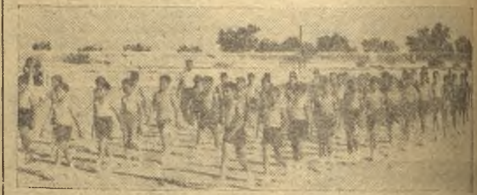
Los jóvenes gimnastas en el momento del desfile.

juegos dirigidos a cargo de las niñas. Simultáneamente se fueron celebrando las competiciones deportivas, cuyos resultados fueron así: Saltos de altura venció Matías, del Colegio Deportes, alcanzando 1,20; se clasificó en segundo lugar, Alumbros, del Colegio Ave María, con 1,15. En carreras de sesenta metros, resultó vencedor absoluto Cantero, del Colegio del Coso y, segundo clasificado, Anas de la Escuela de Loreto. En sal-