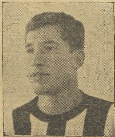
Pachón volvió a ser el coloso del equipo

parte cambiaría la decoración al tener el viento a favor y abierto el marcador, pero no fue así, hubo fallos en las líneas locales que arrastraron al conjunto, hombres triunfadores de otras tardes no supieron