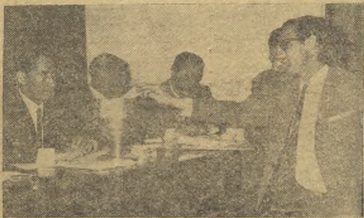
En la Federación Castellana se celebró, días pasados, una reunión de representantes de clubs de categoría regional. En la foto, vemos un momento de la elección de compromisarios que representarán a dichos clubs en la Federación. (Información en página tercera)