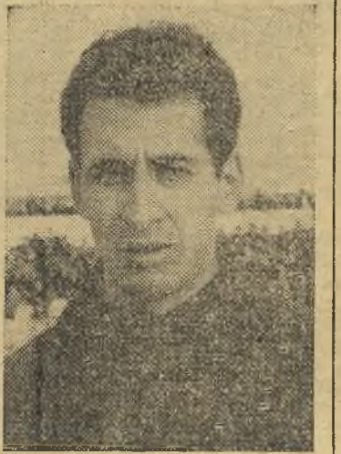
Chule se salva del desastre del equipo local.

Buena entrada en el Carlos III. Se nota la presencia de mu-