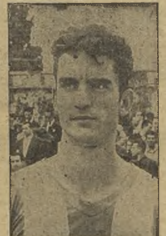
Criado sigue en su racha de goleador.

ba más de que los aviadores juegan "dos partidos" cada domingo, uno en la primera mitad, desangelado, lento y sin imaginación y otro en la segunda, en la que los mismos once