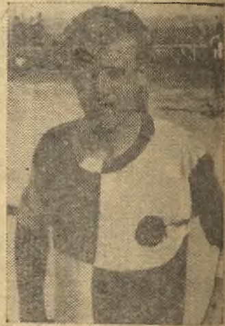
Flores fue otro de los destacados del Pegaso

2.2. Minuto 25. Pase de Jiménez a Flores, quien centró el balón para que lo rematara