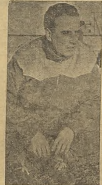
Oyaregui tuvo un "quid pro quo" al principio del partido con los directivos

La directiva tomellosera, que está buscando sin cesar refuerzos de categoría, encontró, por fin, dos muchachos murcianos de inmejorables referencias, pero, a la hora de la verdad, el "mister" dice que "nones" y que los "refuerzos" se sienten en la grada. Y entonces interviene