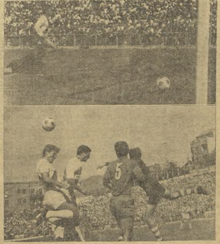
Los "celtas" no han sido nunca malos. El domingo ardieron en Vallecas y arrieron bien, aunque el Rayo hizo méritos para haber ganado, pero el fútbol es así. En las fotos de Balaguer, arriba, el gol del Rayo; abajo, el portero céltico a la espeja de puño ante un ataque rayista. (Información en tercera página)