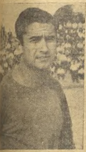
El más batallador de los valdepeñeros

Valdepeñas. (De nuestro corresponsal, Ensagar). Valdepeñas, 1 (Martínez, de penalty); Cacereño, 1 (Aparicio).