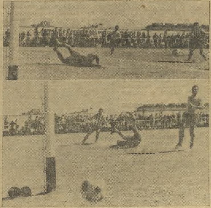
El Moscardó ganó en los primeros quince minutos, gracias a dos goles logrados en ellos. Luego, el Diter dominó, pero no tuvo fortuna en el disparo. En las fotos de Angel, arriba, una buena parada del portero Arjona y un balón que sale rozando el poste. (Información en página catorce)