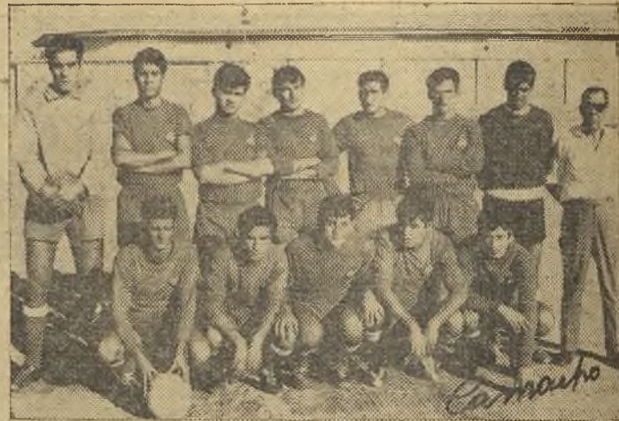
El Asland, que el domingo venció en Manzanares.

el pase y ha dejado un hueco propicio para las penetraciones adversarias, obligando a trabajar a destajo a los interiores locales y a Mascaraque. Si Toni hubiese estado en su papel la delantera habría contado con más efectivos a la