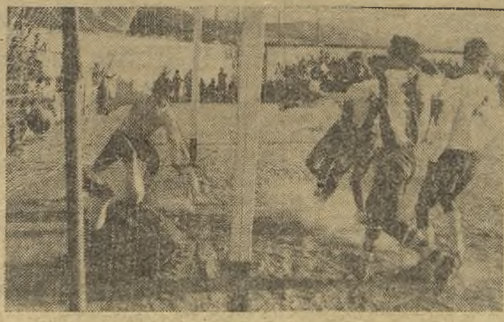
El Plasencia ganó por la mínima ante un duro Boctlicher. Este es el segundo gol local, marcado un poco a trompicones y ayudado por el interior derecho visitante, en una melée. (Información en página doce)