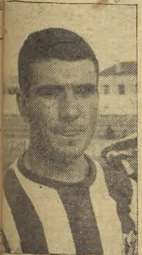
... el único que apuntó alguna cosa

Elices: "Nuestra táctica ha (Pasa a la página décima)