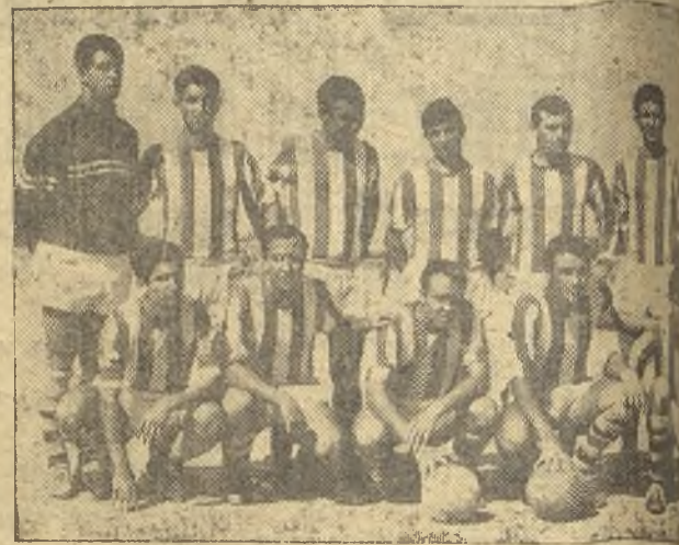
Equipo del Fercu de la actual temporada. (Foto A)

que se mantenga un pugilato más reñido entre los dos equipos que van en cabeza, de todas las competiciones de Castilla.