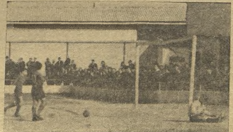
El Manzanares ganó por 3-0 al Tajamar. En la foto de Camacho, el segundo gol local y desolación del portero visitante. (Información en octava página).