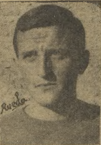
Posada, uno de los destacados en Tenerife

para el Tenerife, puesto que supuso un verdadero jarro de agua fría, puesto que si la línea de retaguardia no habían funcionado hasta entonces muy bien, a partir de ahora lo hicieron peor, tal vez por los nervios.