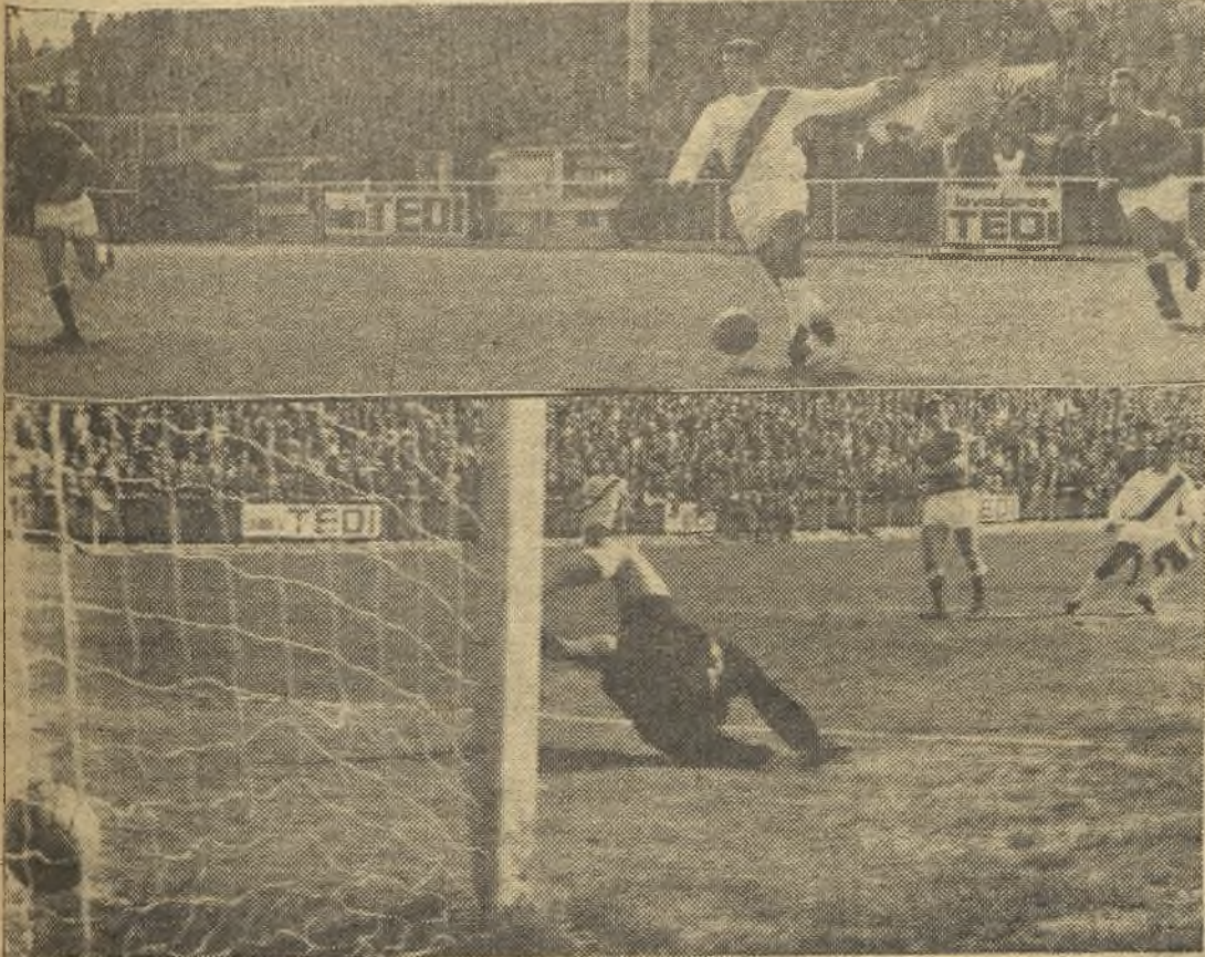
El Rayo volvió por sus fueros e Iznata también. En las fotos de Balaguer, vemos una jugada del delantero rayista y, abajo, el segundo de sus goles. (Amplia información en página tercera)