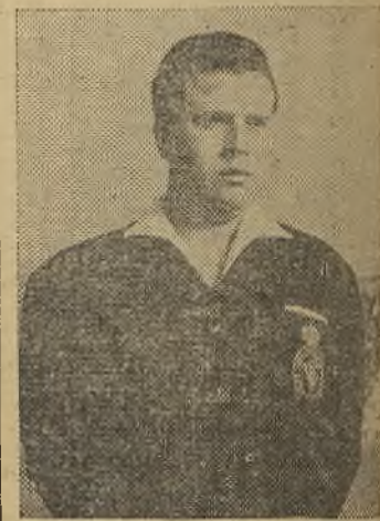
Sr. Romero Los grupos XIV y XV de Tercera División. Actualmente, la tabla es la siguiente:

Transcurrido ya el primer mes de la competición liguera, vamos a ofrecer a ustedes la clasificación de los árbitros que pitan en