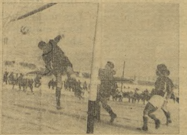
Así se produjo el único gol del Socuellamos.

el Femsa; continuó la presión local, pero siguió, también, la inoperancia e ineficacia de los delanteros azul socuellaminos. El encuentro no tuvo más brillantez que la de la excelente tarde y el consiguiente disgusto. Destacaron por el Femsa, Hernández, Cantalapiedra, Pérez, Serrano. Por el Socuellamos, Palero, sobre todos, siguiéndole en