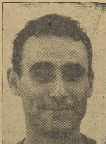
Anta, el único que se salva del naufragio

del solitario gol marcado en lo que va de Liga. Esto nos recuerda cierta crónica escrita por nosotros en la anterior estancia del Badajoz en Segunda División, y no que-