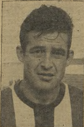
Cacereño, uno de los más distinguidos del Talavera

Con este gol el partido se pone al rojo vivo y los dos equipos juegan de poder a poder, en busca del balón junto al poste. Fué un